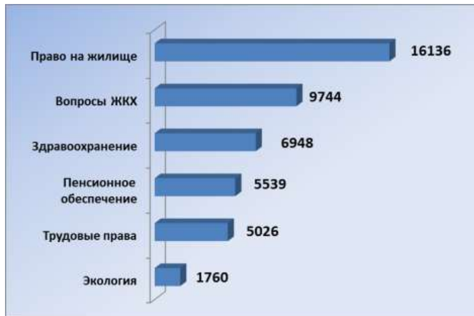
Количество жалоб к региональным уполномоченным по правам человека в 2019 году

Из основных тематик, составляющих блок социальной группы прав, жалобы на нарушения прав в сфере ЖКХ занимают второе место по количеству обращений