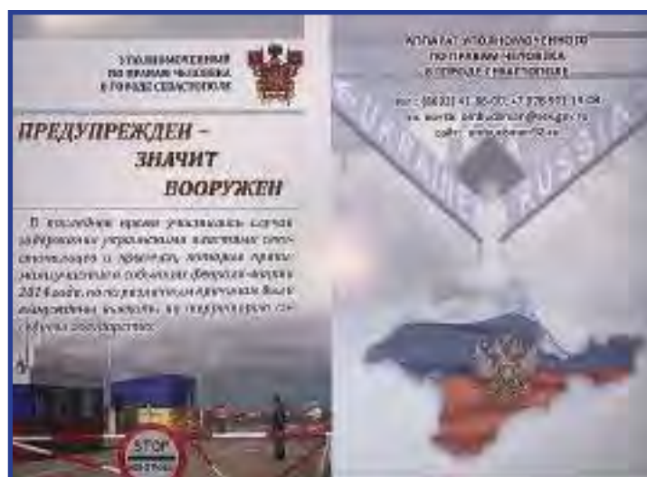
Лицевая и задняя сторона разворота памятки для военнослужащих

В дальнейшем текст памятки одобрен командованием Черноморского флота, которое довело его до всех объединений, воинских частей и организаций ЧФ. После этого силами Аппарата омбудсмена памятка была изготовлена и отпечатана возможно большим тиражом. Электронная версия памятки представлена на официальном сайте Уполномоченного 1 , а также в официальной группе в социальной сети «ВКонтакте» ( https://vk.com/ombudsman92 ) 2 .