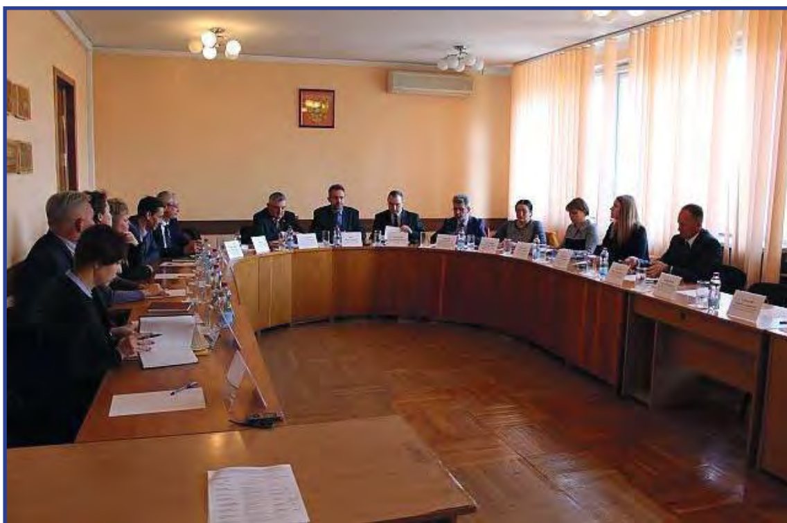
Обсуждение памятки для военнослужащих на заседании Общественного экспертного совета при УПЧ в городе Севастополе 17 апреля 2019 г.

В сложившейся ситуации считаем необходимым создание в городе Севастополе специального фонда для помощи нашим согражданам, оказавшимся в подобных жизненных обстоятельствах.