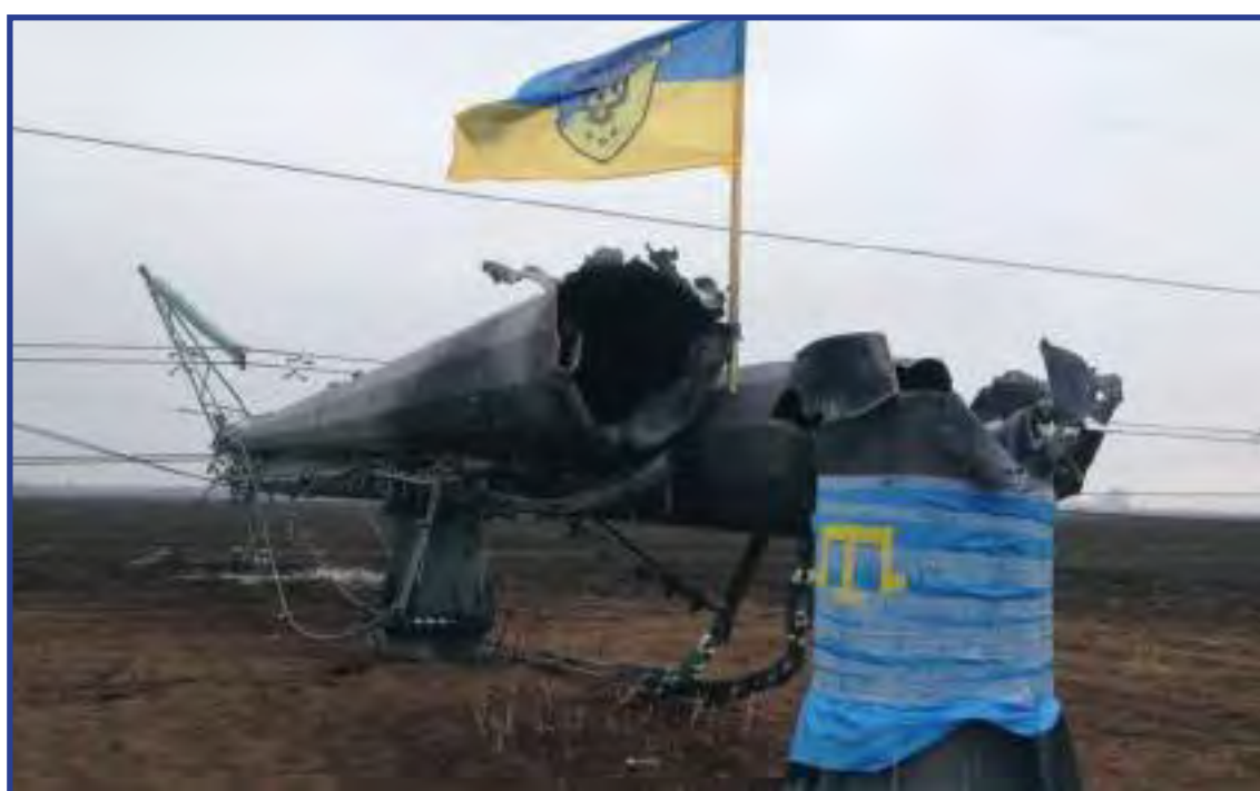
Взорванная опора линий электропередач, подающих энергию в Крым. Херсонская область (Украина), осень 2015 г.

Общая сумма убытков, нанесенных предприятиям города Севастополя вследствие энергоблокады, составила 263,9 млн рублей 1 .