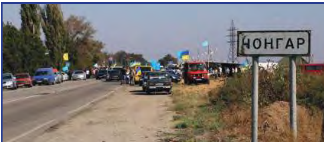
«Гражданская блокада» Крыма. Осень 2015 г.

На протяжении нескольких месяцев в обоих субъектах люди жили в режиме чрезвычайной ситуации (далее – ЧС). Проблема успешно разрешилась после строительства энергомоста.