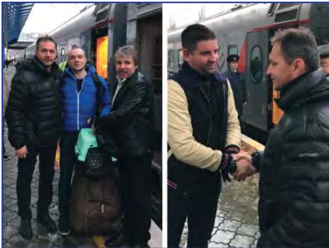
Севастопольский омбудсмен встречает наших сограждан, освобожденных из украинского плена. 1 января 2020 г.

В первый день 2020 года произошло долгожданное радостное событие. Из украинского плена вернулись наши соотечественники – гр. Р. и гр. Р., которые были освобождены в результате обмена, состоявшегося 29 декабря 2019 года.