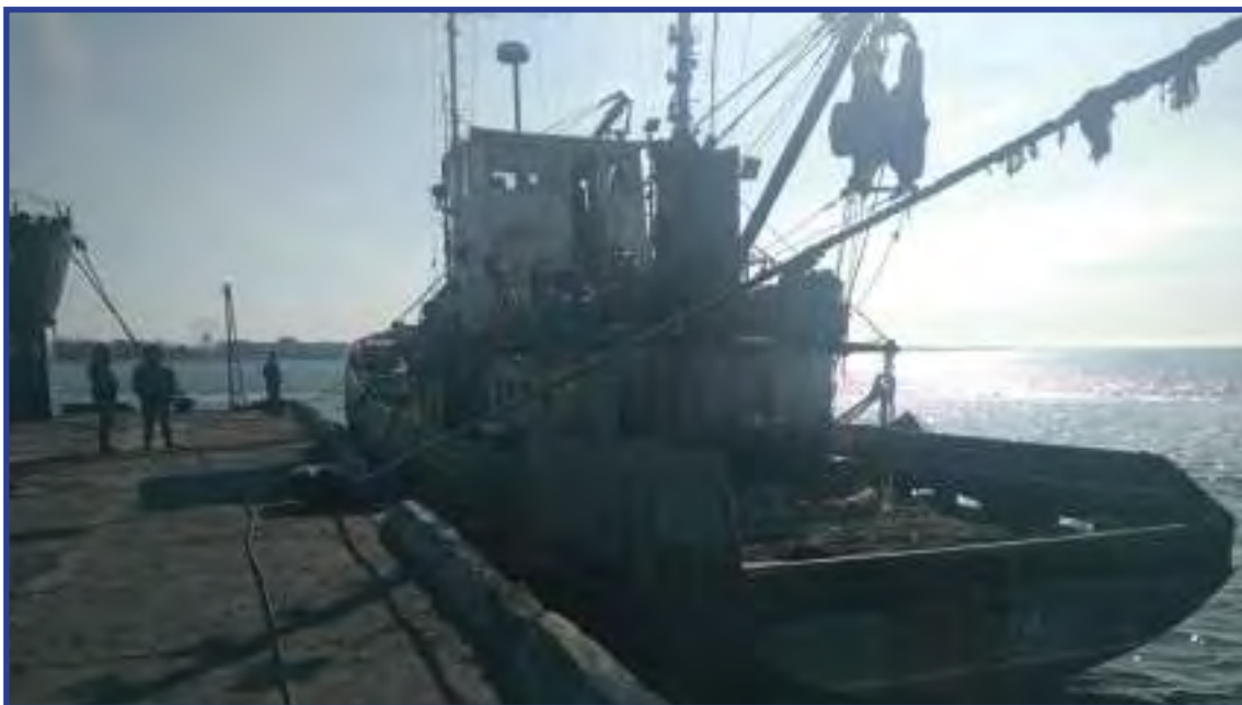
Российское судно «Норд», задержанное украинскими пограничниками

25 марта 2018 года судно с 10 членами экипажа было задержано в Азовском море.