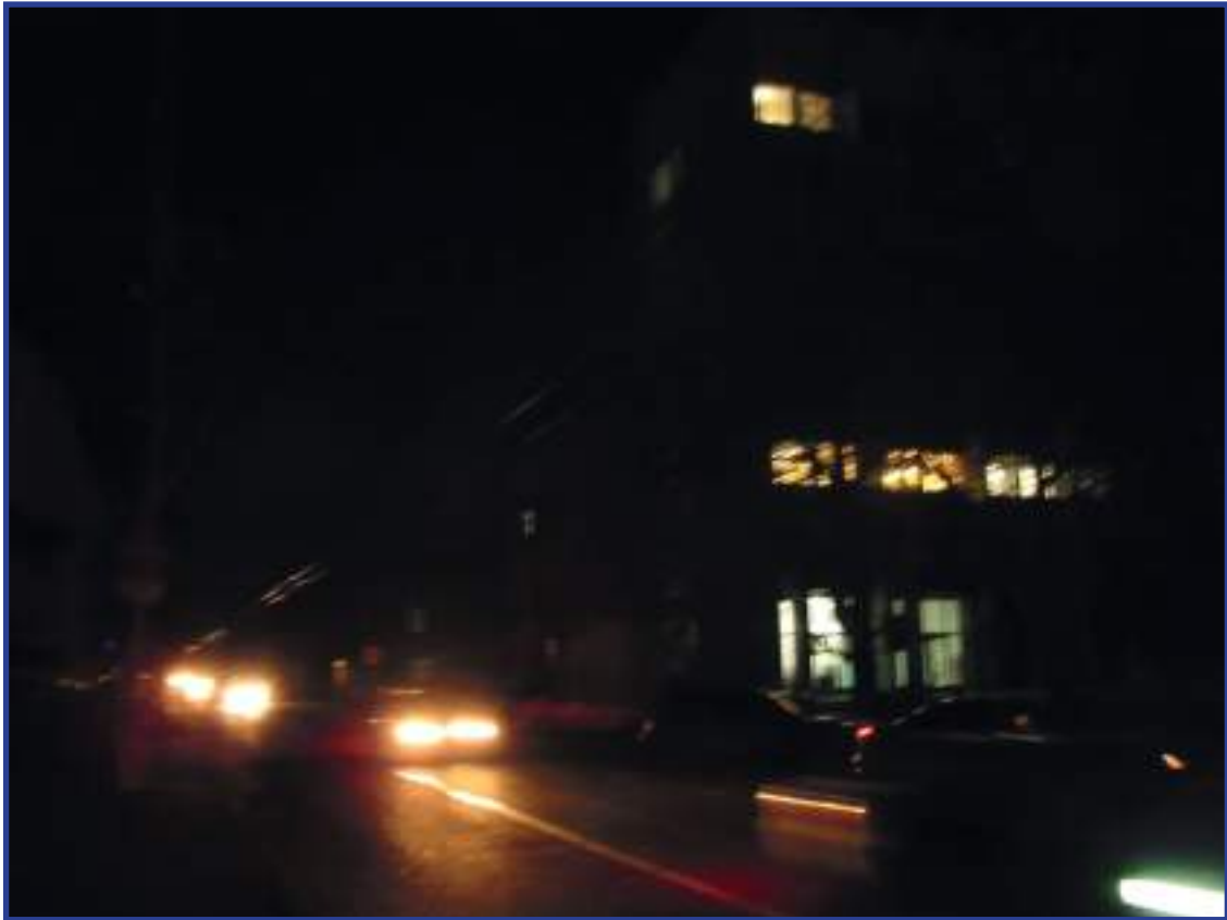
Севастополь в период энергоблокады. Декабрь 2015 г.

Начало энергоблокады совпало с началом деятельности института Уполномоченного по правам человека в городе Севастополе (далее – Уполномоченный, УПЧ или омбудсмен).