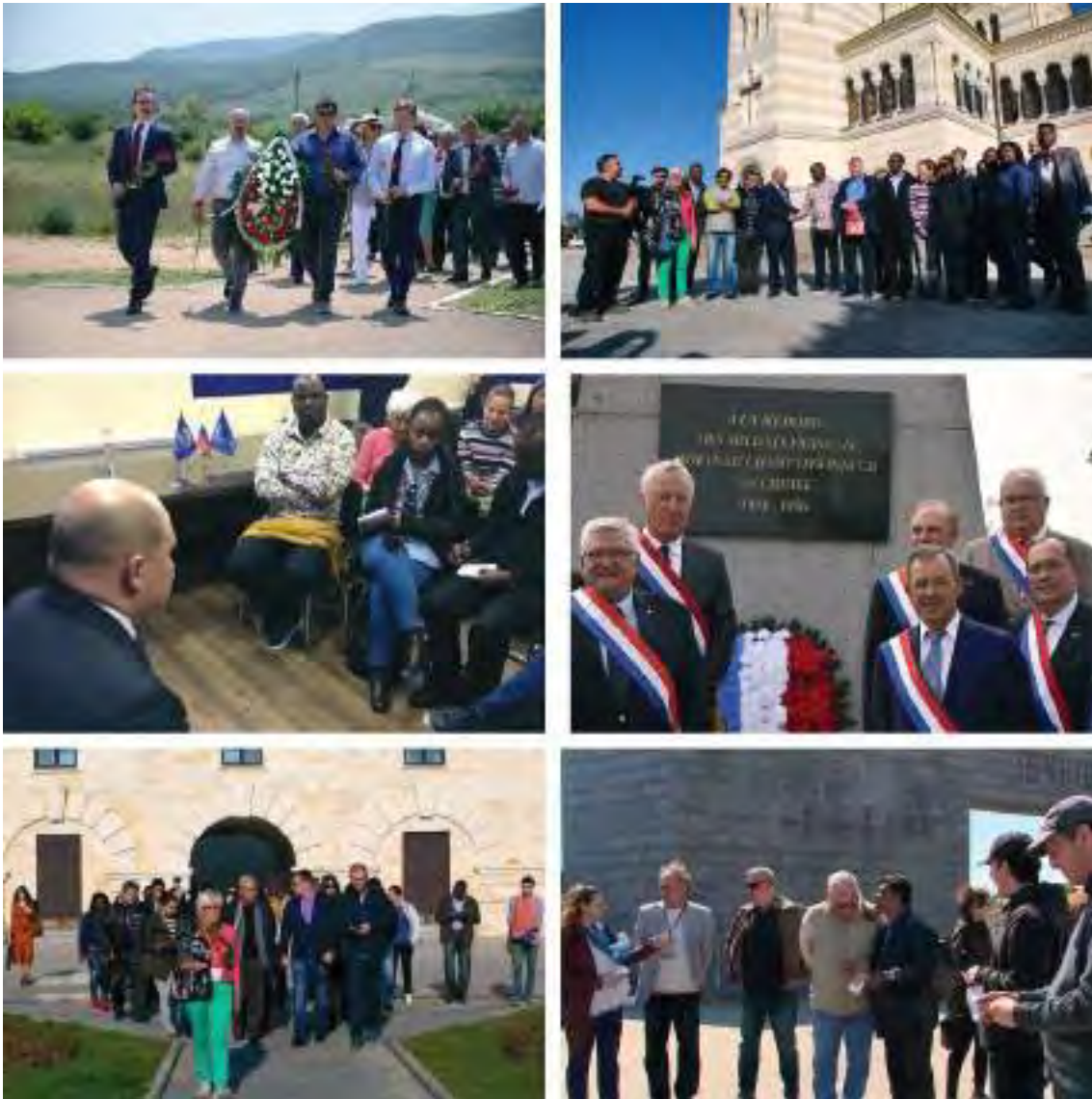
Иностранные делегации в Севастополе

Наглядное подтверждение – следующие высказывания.