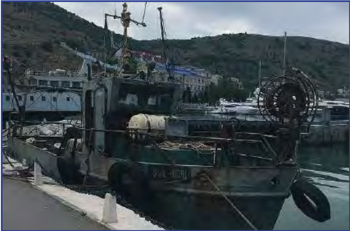
Украинское рыболовецкое судно ЯМК-0041, задержанное у берегов Крыма

Ситуация, которая сложилась в связи с задержанием российских и украинских моряков, в течение многих месяцев находилась на личном контроле УПЧ РФ, Уполномоченных в Республике Крым и городе Севастополе.