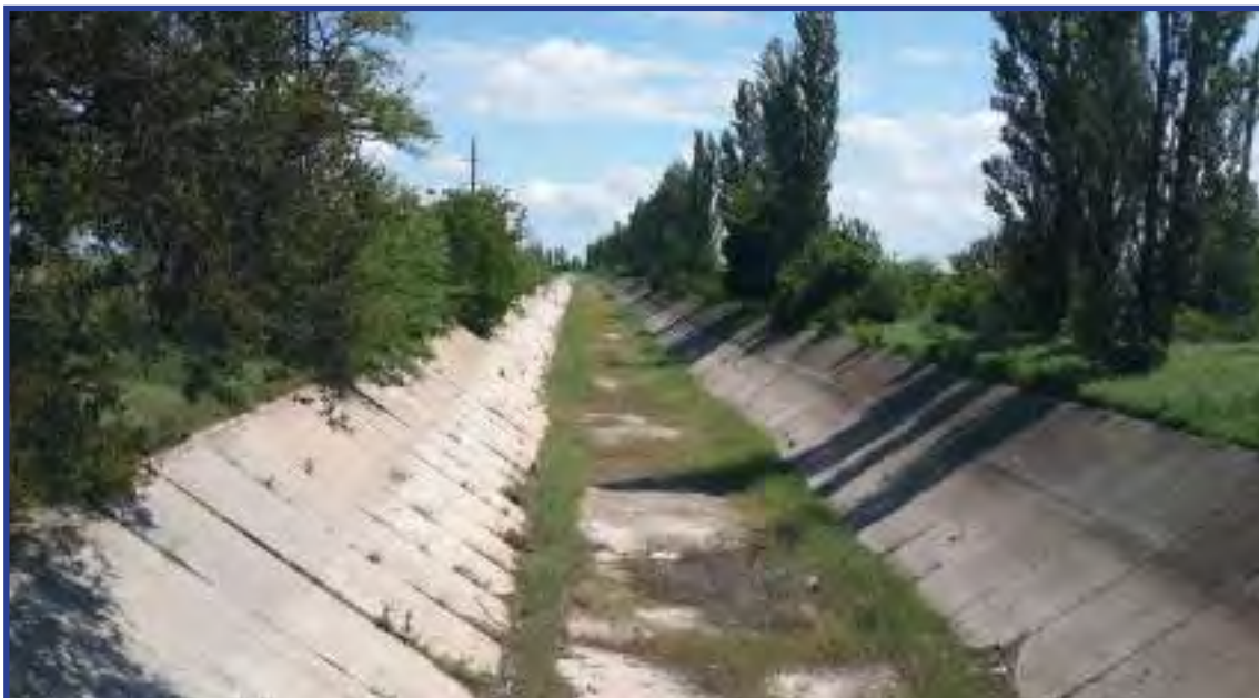
Последствия водной блокады Крыма

26 апреля 2014 года Украина полностью перекрыла шлюзы Северо-Крымского канала, через который вода из Днепра поступала на Крымский полуостров 3 .