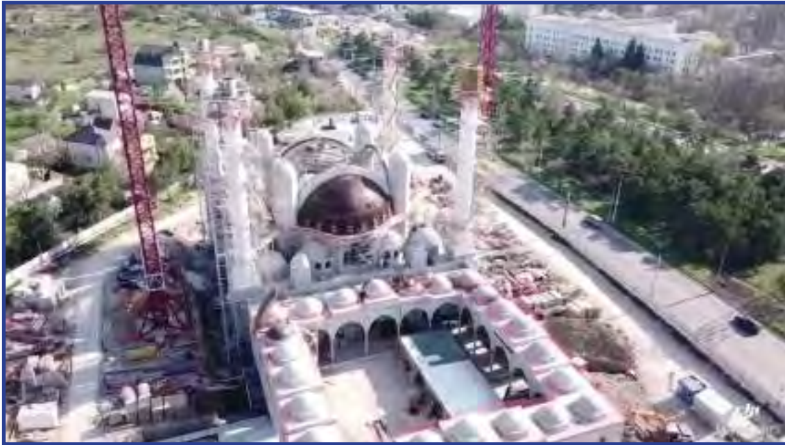
Строительство соборной мечети в городе Симферополе

На территории полуострова действует организация «Украинская община Крыма», которая пользуется поддержкой со стороны государства в лице республиканских органов власти.