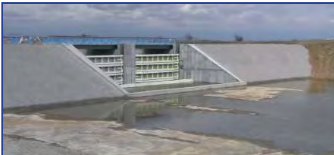
Дамба, перекрывающая Северо-Крымский канал

14 апреля 2014 года по решению Киева поставки пресной воды из Украины в Республику Крым Российской Федерации по Северо-Крымскому каналу были сокращены в три раза под явно надуманным предлогом (якобы неправильно оформлены документы) 1 .