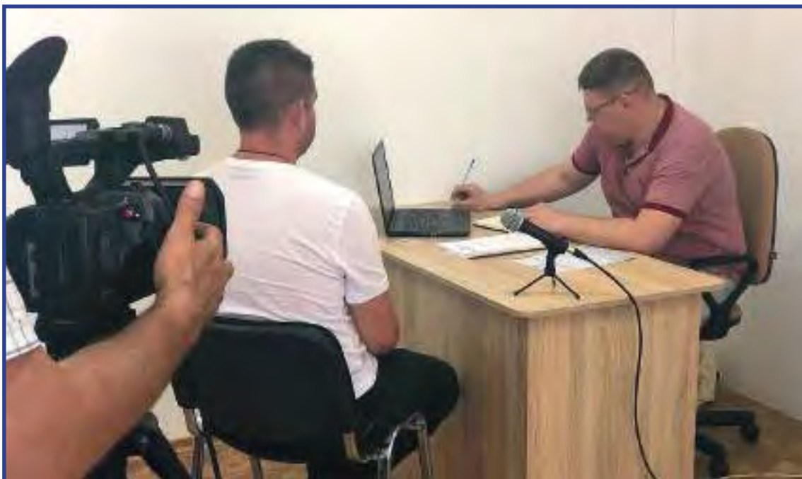
Допрос гр. Р., жителя города Севастополя, задержанного на Украине 11 июня 2019 года

11 марта 2019 года на территории Херсонской области во время проведения операции «Розыск» силами Национальной полиции Украины задержан бывший украинский военнослужащий, житель города Севастополя, 1985 года рождения, который после 2014 года перешел на службу в Вооруженные Силы Российской Федерации. Имя задержанного до настоящего времени не удалось установить. В настоящий момент в отношении задержанного ведутся следственные действия.