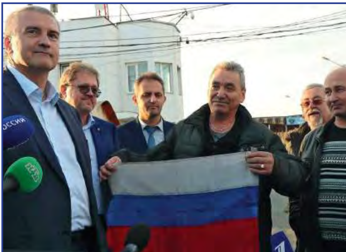
Встреча моряков судна «Норд», которые вернулись на Родину