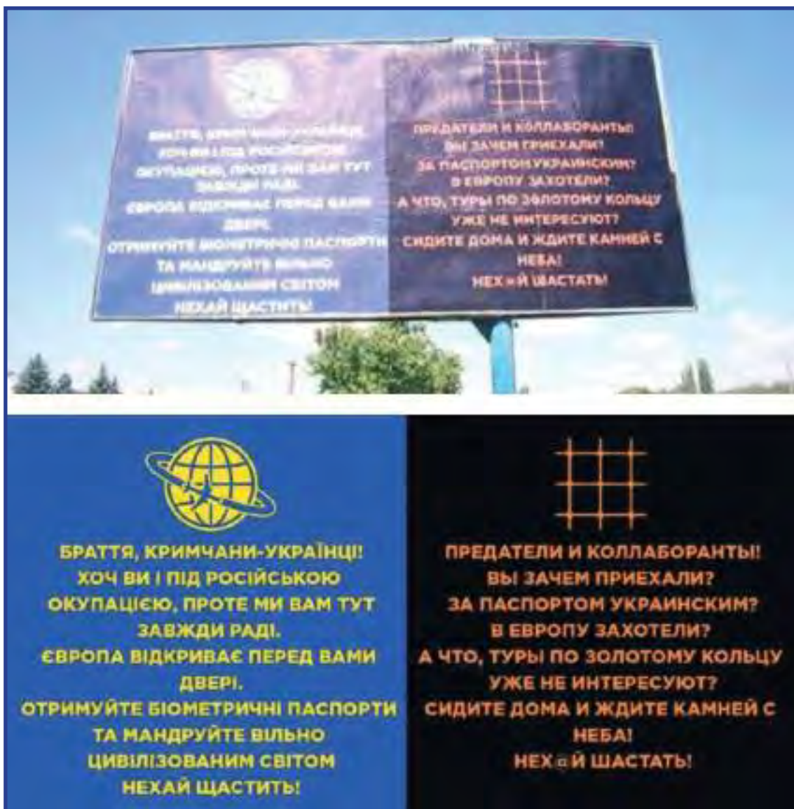
Пример агитации, направленной против жителей российского Крыма. Херсонская область (Украина), весна 2017 г.

Таким образом, выезжая на территорию Украины, севастопольцы и крымчане подвергаются серьезному риску.