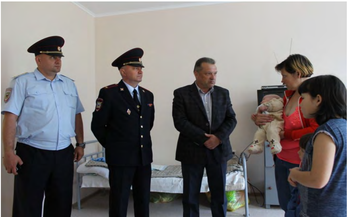
Посещение Центра временного содержания иностранных граждан г. Гулькевичи, 17 мая 2017 г.