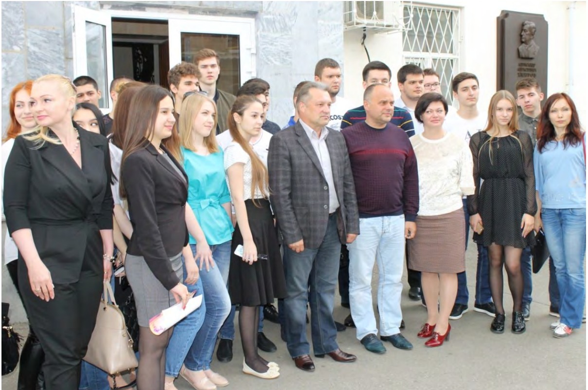
Встреча со студентами юридического факультета Кубанского государственного университета г. Краснодар, 18 мая 2017 года