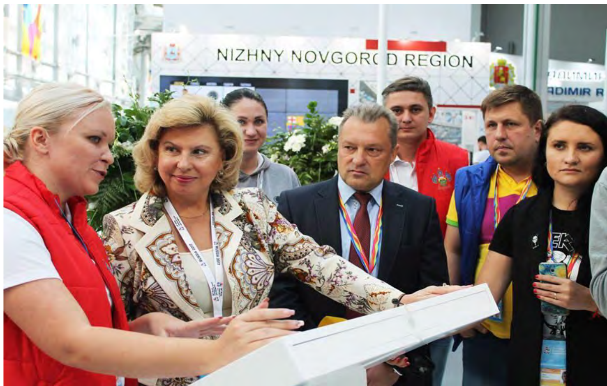
XIX Всемирный фестиваль молодежи и студентов г. Сочи, 4-22 октября 2017 г.