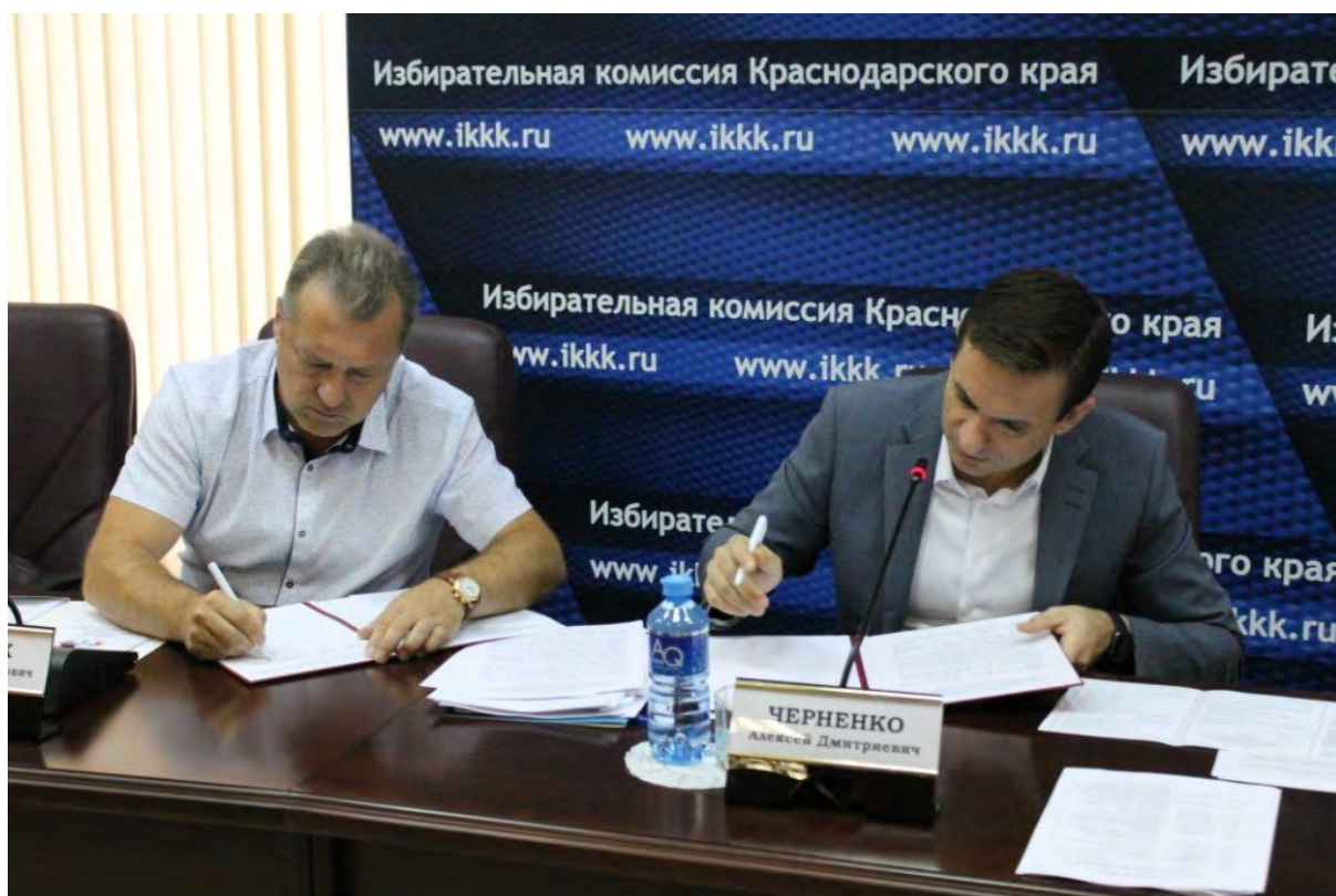
Подписание Совместного открытого обращения об обеспечении реализации избирательных прав граждан в ходе выборов депутатов Законодательного Собрания Краснодарского края г. Краснодар, 22 августа 2017 г.