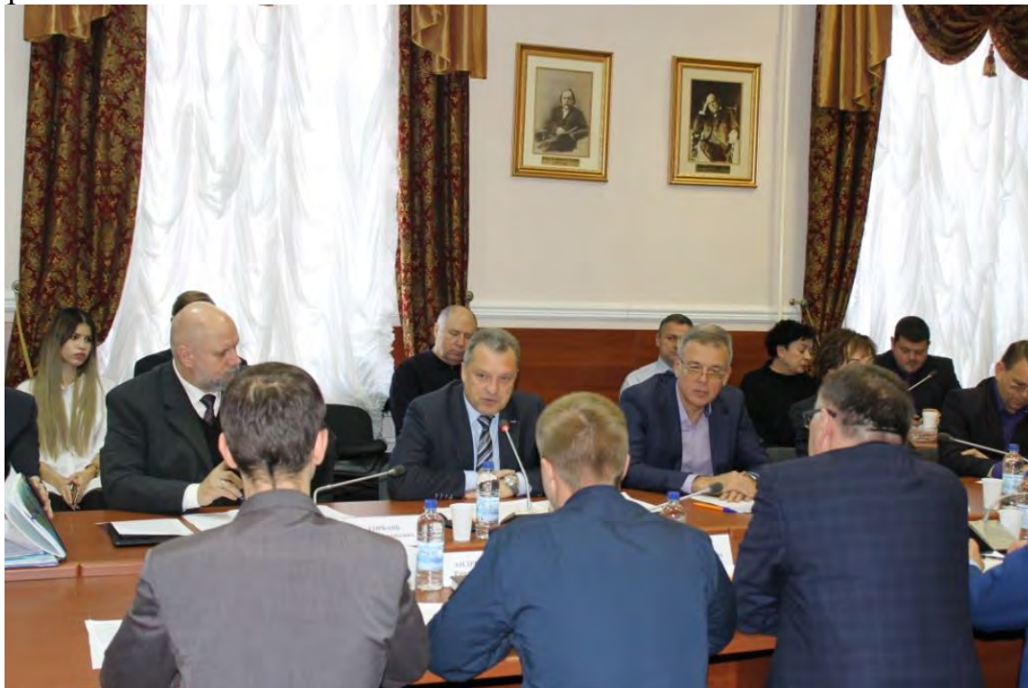
Заседание Клуба гражданских активистов Кубани на тему «Ресоциализация и адаптация граждан, освободившихся из мест лишения свободы: проблемы и пути решения» г. Краснодар, 28 ноября 2017 г.