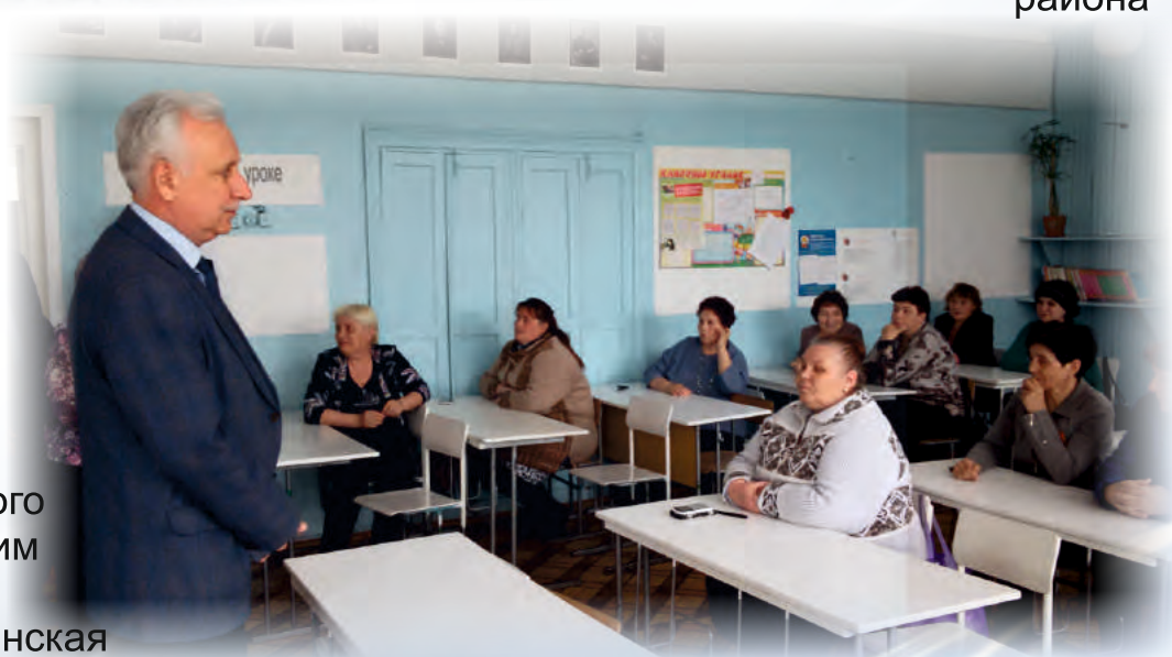
Встреча Уполномоченного с педагогическим коллективом МБОУ Крутишинская СОШ Шелаболихинского района