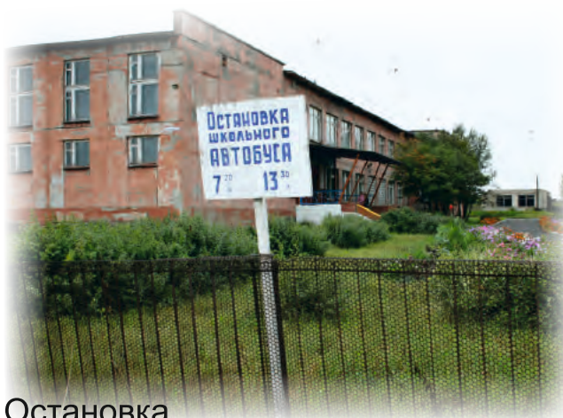
Остановка школьного автобуса МКОУ Новоберезовская СОШ Первомайского района