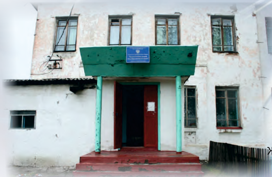
Фасад здания МКОУ Журавлихинская СОШ 1952 года постройки требует ремонта