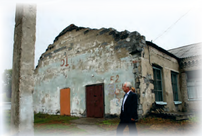
Спортивный зал МКОУ Журавлихинская СОШ