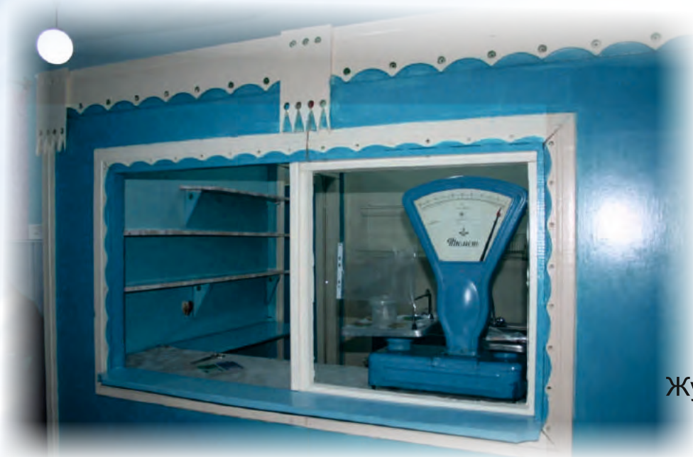
Школьный буфет МКОУ Журавлихинская СОШ Первомайского района