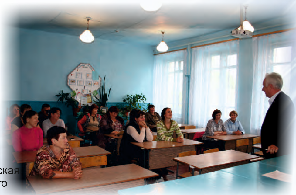
Встреча Уполномоченного с педагогическим коллективом МКОУ Журавлихинская СОШ Первомайского района