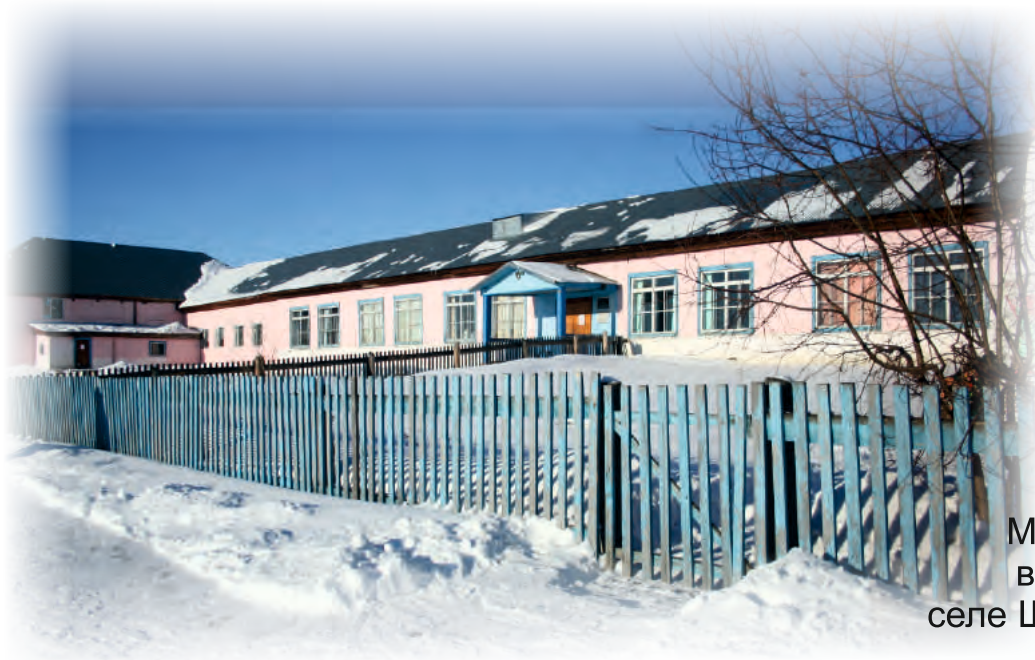
МБОУ Инская СОШ в труднодоступном селе Шелаболихинского района