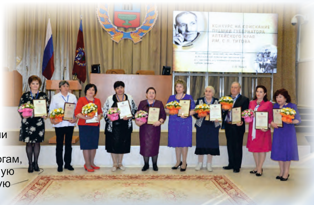
Вручение премии им С.П. Титова сельским педагогам, ведущим активную просветительскую деятельность