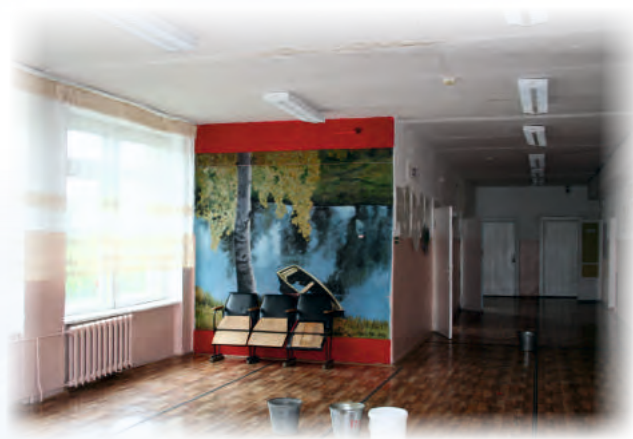
МКОУ Новоберезовская СОШ Первомайского района требуется срочный ремонт кровли