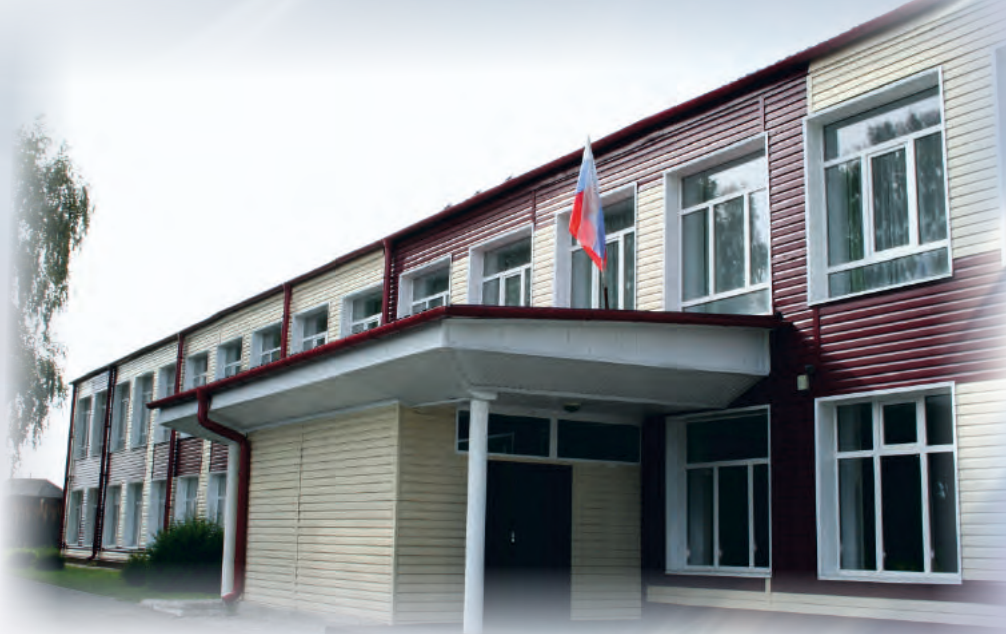
На ремонт школы в с. Быстрянка Красногорского района было выделено 45 млн. руб.