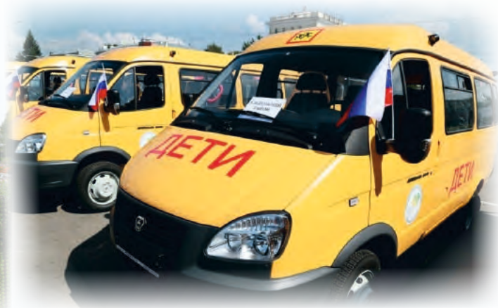
Новые школьные автобусы готовы к работе по доставке детей в школы