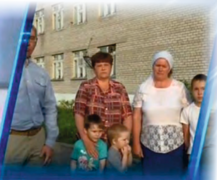
пос. Старая Суртайка

На связи с Президентом России Владимиром Путиным жители села Старая Суртайка