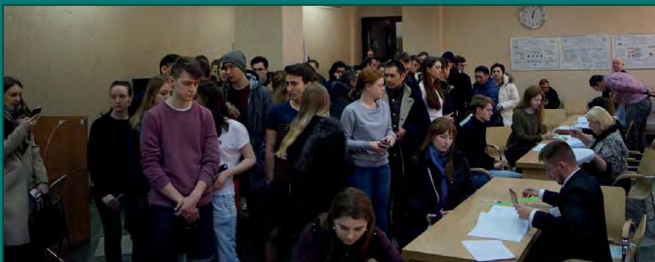
УИК № 158. Общежитие Горного университета. 18.03.2018.