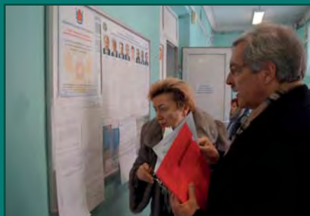
Проверка информационных стендов в УИК № 125 (Василеостровский район). 18.03.2018.