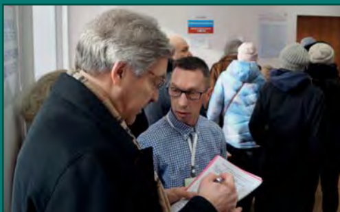
УИК № 185 в месте временного пребывания избирателей. Городская наркологическая больница. 18.03.2018.