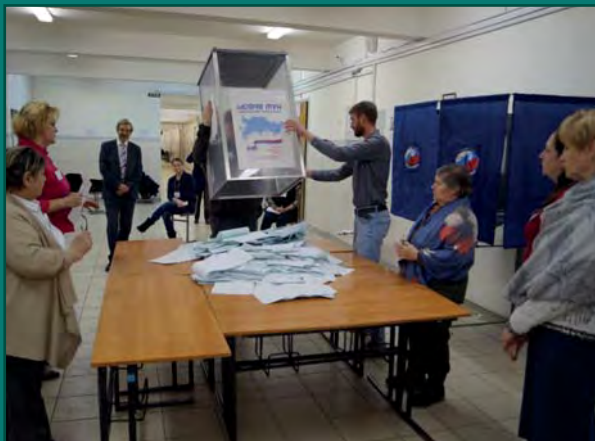
Подведение итогов голосования. УИК № 534 (Калининский район). 18.03.2018.