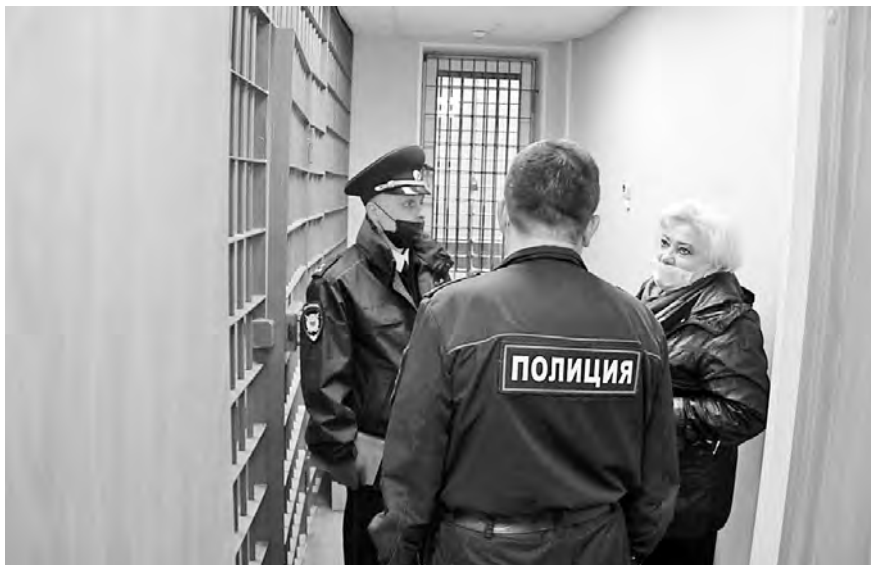
Посещение Уполномоченным изолятора временного содержания (г. Петрозаводск, ноябрь, 2020 г.)

ветственности, посещались изоляторы временного содержания, входящие в структуру МВД (в г. Петрозаводске). В результате этих посещений нарушений прав лиц, содержащихся в ИВС, не выявлено.