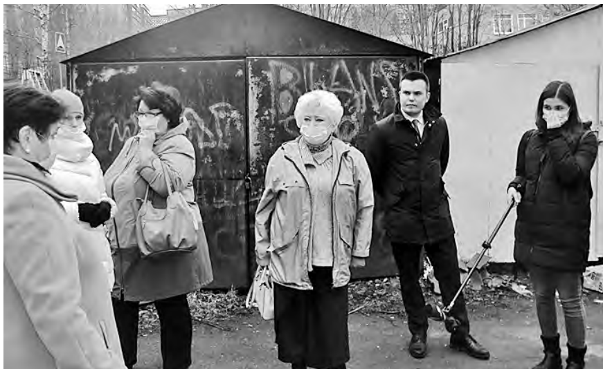
Встреча Уполномоченного с жителями микрорайона «Кукковка» г. Петрозаводска 11