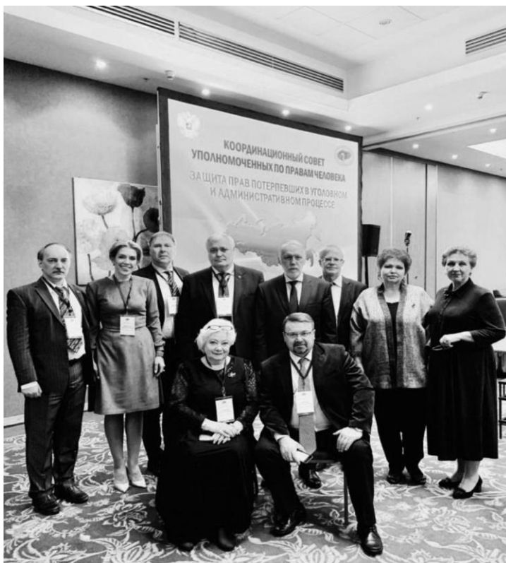
11.12.2019 года в г. Москва. Участие в заседании Координационного совета Уполномоченных по правам человека (на представленной фотографии – Уполномоченные в субъектах СЗФО РФ- группа «одинадцать»)