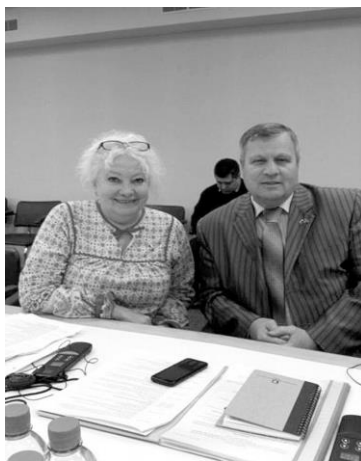
Встреча с Уполномоченным по правам человека в Республике Карелия А.С. Шарповым (полномочия 2014 – 2019 гг.)