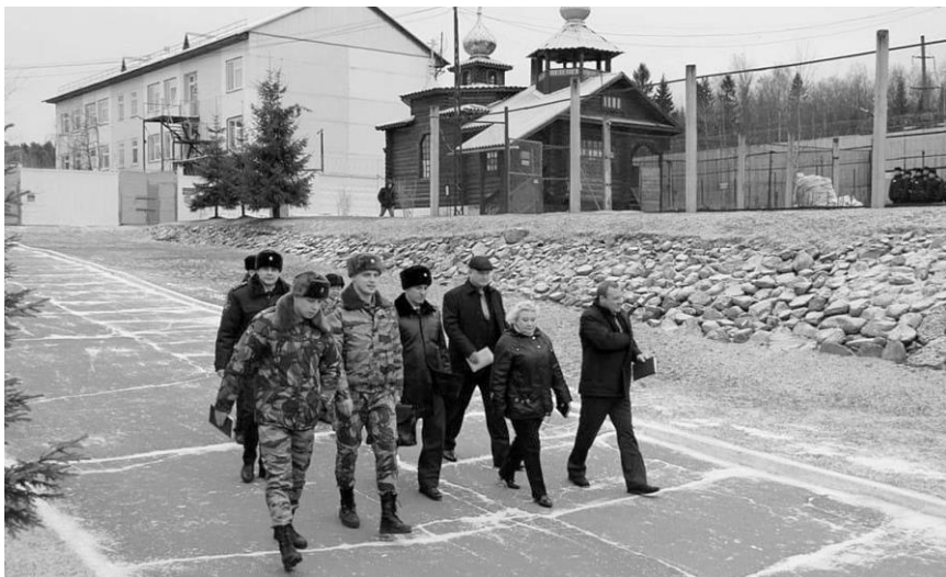
Посещение Уполномоченным, совместно с работниками прокуратуры Республики Карелия и представителями Общественной наблюдательной комиссии Исправительной колонии УФСИН России по РК (28.11.)

В 2019 году, Уполномоченный, действуя в рамках полномочий и имеющимся с УФСИН России по Республике Карелия «Соглашением о взаимодействии в вопросах защиты прав и свобод человека и гражданина», принимал меры по разрешению жалоб лиц, находящихся в