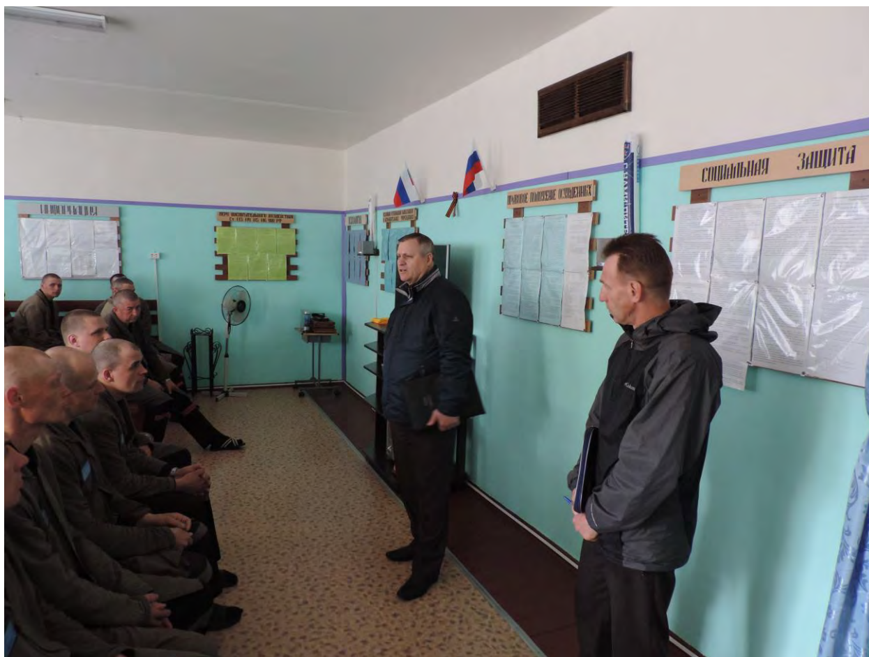
Посещение учреждения УФСИН

В 2016 году Уполномоченным, при проведении мониторинга по защите прав осужденных и содержащихся в учреждениях УФСИН по РК было установлено, что их обеспеченность вещевым имуществом составила лишь 91 %, а выделенные на эти цели средства составляли чуть более 40 % от заявленных потребностей. В связи с чем, уполномоченными СЗФО была направлена соответствующая информация для ее обобщения Уполномоченному по правам человека в Российской Федерации.