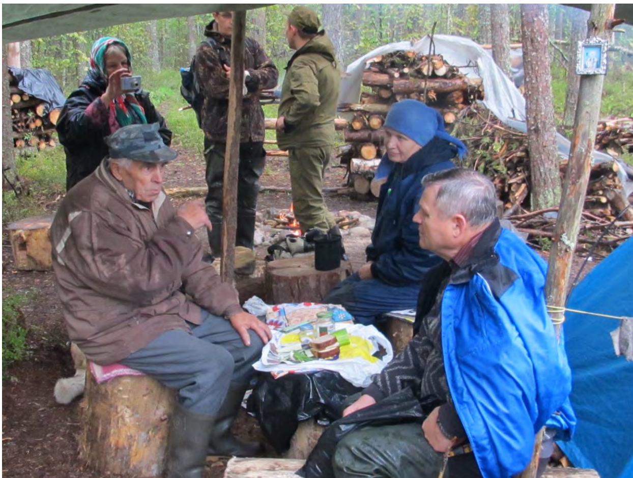
Посещение Сунского бора

Возрастающую экологическую напряженность в республике предопределяет высокий уровень захламления земель, уплотнительная (точечная) застройка в жилых массивах, увеличение количества автомобилей.