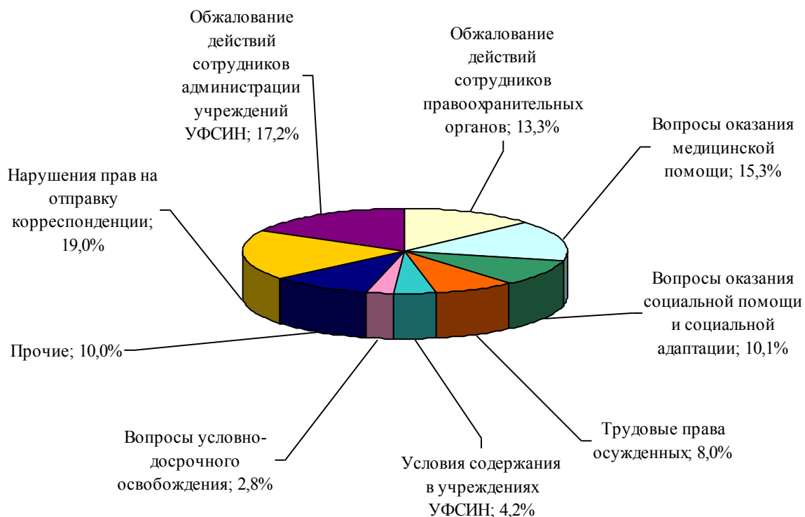
Рис.2. Тематическая структура жалоб и обращений в защиту прав лиц, находящихся в учреждениях УФСИН, поступивших в адрес Уполномоченного в 2013 году.

В целях обеспечения и восстановления прав лиц, отбывающих наказание в местах лишения свободы и содержащихся под стражей, по всем обращениям Уполномоченным принимаются предусмотренные законом меры, в результате чего значительная часть содержащихся в жалобах проблем разрешается путем взаимодействия Уполномоченного с руководством УФСИН, СУ СК России по Архангельской области и НАО, а также с органами прокуратуры Архангельской области. Большое значение для разрешения обращений указанной категории лиц также играют правовые консультации и разъяснения норм действующего законодательства, а также форм и способов защиты нарушенных прав, предоставляемые сотрудниками аппарата Уполномоченного в различных формах.