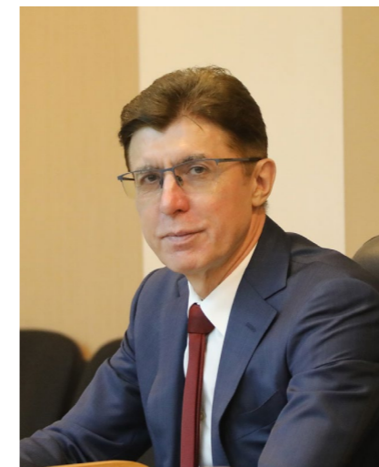
Юрий Борисович Мельников, уполномоченный по правам человека в Приморском крае

Распространение коронавирусной инфекции внесло изменения в деятельность судебных и правоохранительных органов. К сожалению, эти изменения повлекли ограничения законных прав граждан, участников уголовно-процессуального производства, а также осужденных, находящихся в местах лишения свободы.