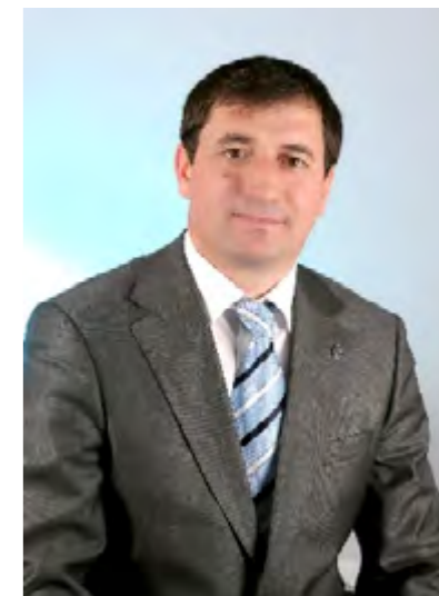
Ф. РАДЖАБОВ ЗАМЕСТИТЕЛЬ ПРЕДСЕДАТЕЛЯ КОМИТЕТА НАРОДНОГО СОБРАНИЯ РЕСПУБЛИКИ ДАГЕСТАН ПО ЗАКОНОДАТЕЛЬСТВУ, ЗАКОННОСТИ И ГОСУДАРСТВЕННОМУ СТРОИТЕЛЬСТВУ

Таким образом, все выявленные нарушения получают соответствующее прокурорское реагирование, в результате чего обеспечиваются реализация и защита избирательных прав граждан.