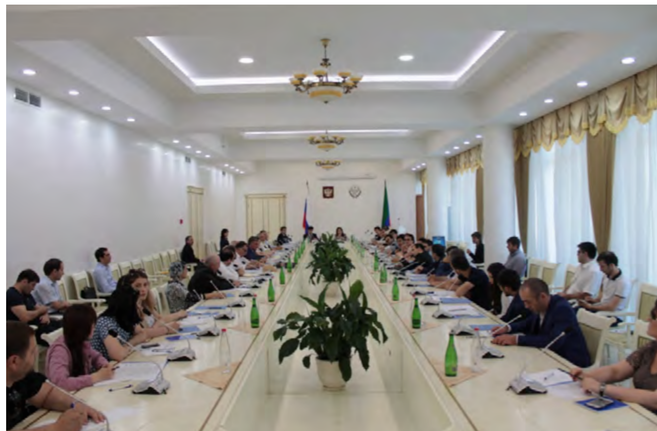
Круглый стол с участием представителей политических партий на тему: «Повышение гражданской активности населения и подготовка наблюдателей для проведения выборов 18 сентября 2016 года», 15 июня 2016 года