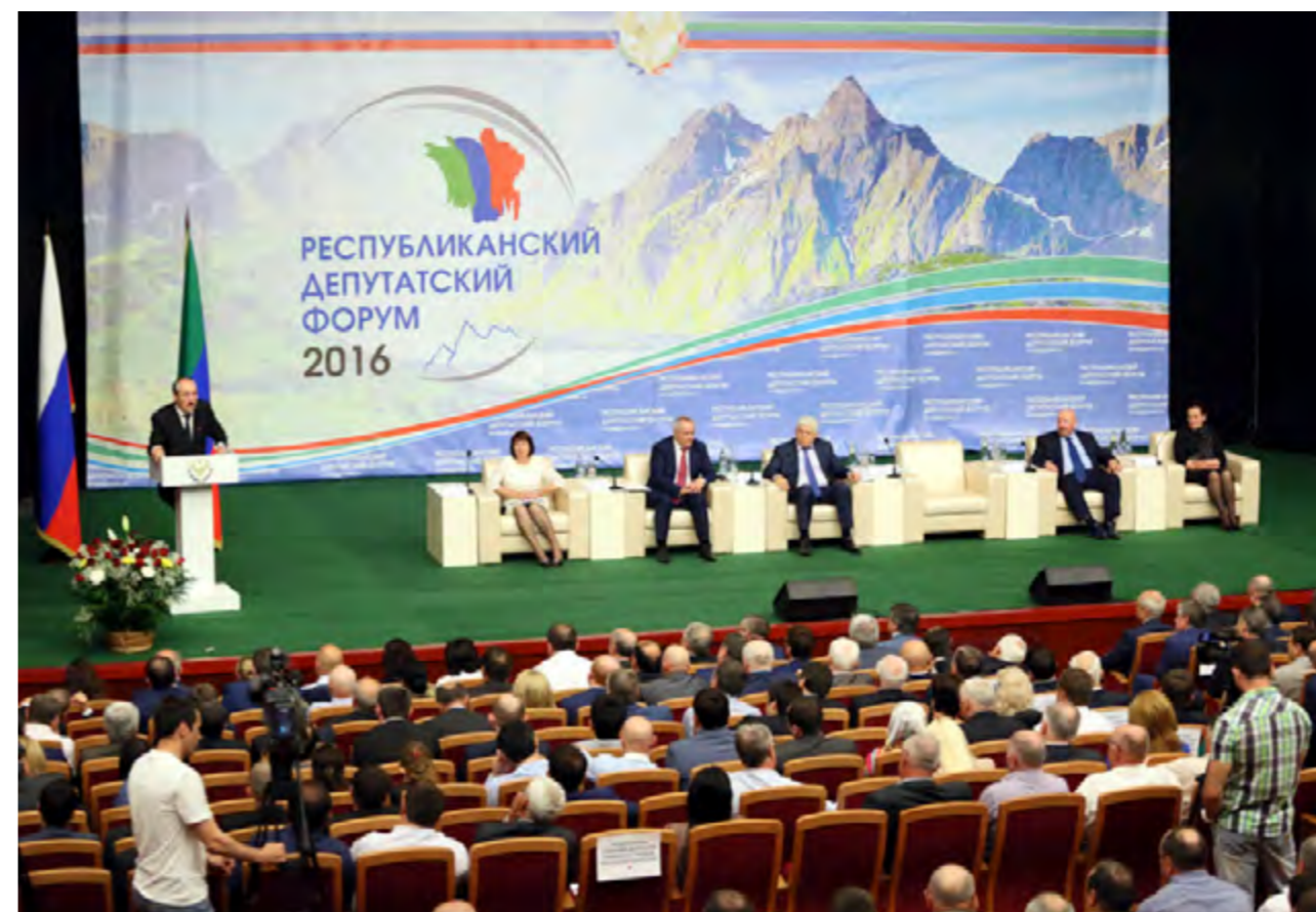
Уполномоченный по правам человека в Республике Дагестан приняла участие в Республиканском депутатском форуме, 31 мая 2016 года