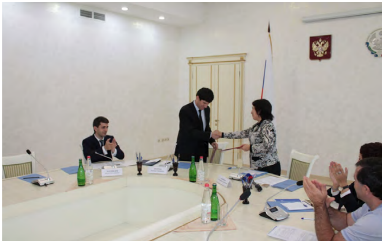
Уполномоченный по правам человека в Республике Дагестан и председатель Избирательной комиссии Республики Дагестан подписали соглашение о взаимодействии, 15 июня 2016 года