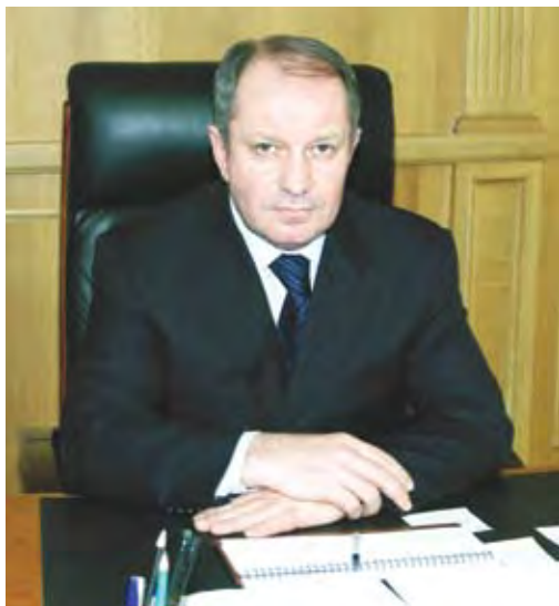
М.З. Азизов, министр образования и науки Республики Дагестан