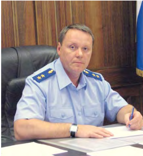
А.И. Назаров, прокурор Республики Дагестан