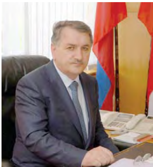
И.А. Мамаев, министр здравоохранения Республики Дагестан