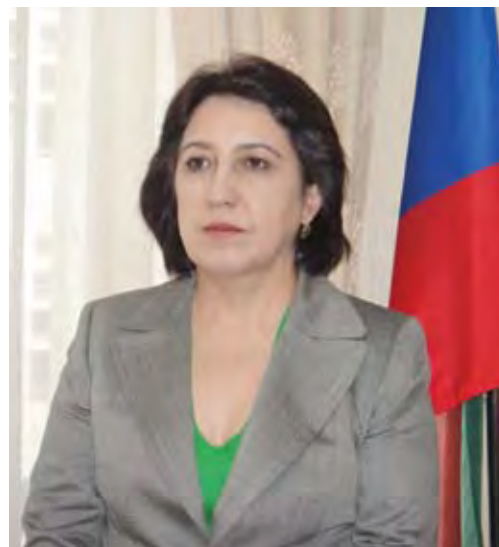
У. А. Омарова, Уполномоченный по правам человека в Республике Дагестан