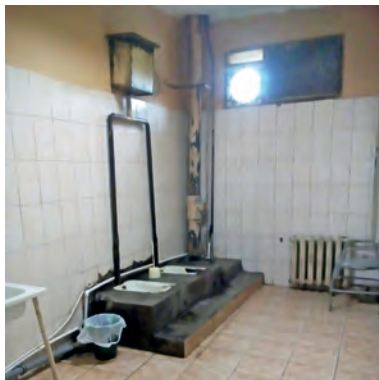
Туалет в мужском стационарном отделении Сызранского ПНД

В соматогериатрическом мужском отделении Самарской областной клинической психиатрической больницы душевые и санузлы с напольными чашами Генуя не соответствуют современным представлениям об обеспечении гигиены в 21 веке. В стационаре Чапаевского филиала больницы на 60 человек 1 душевая комната с 3 душами, в мужском отделении в туалете нет сидений для унитаза. В мужском отделении Сызранского психоневрологического диспансера санитарно-гигиеническая комната также оборудована чашами Генуя. Нецелесообразность их замены современными унитазами руководство учреждения обосновывает тем, что пациенты, находящиеся в острых стадиях заболеваний, часто разбивают сантехническое оборудование.