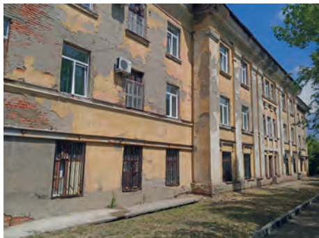
Здание стационара Сызранского психоневрологического диспансера

Учреждение нуждается в строительстве нового лечебного корпуса на территории стационара и располагает достаточным для этого земельным участком. Плановое задание на строительство стационара согласовано министерством здравоохранения Самарской области в 2017 году, проведено согласование сметной стоимости проектных работ с министерством строительства Самарской области. Но до настоящего времени вопрос о выделении финансовых средств на выполнение проектных работ и строительство лечебного корпуса стационара остается открытым.