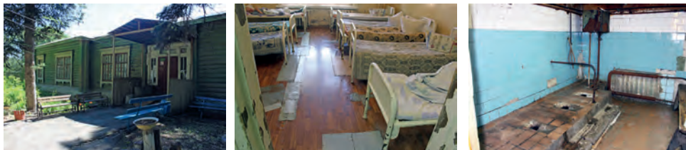
Здание, палата и туалет соматogerиатрического отделения Самарской областной психиатрической больницы

В одном из таких корпусов, 1886 года постройки, размещено соматogerиатрическое мужское отделение. Палаты переполнены (до 12-18 человек), полы в заплатках, стены, двери, душевые и санузлы с напольными чашами Генуя требуют модернизации. Условия пребывания в таком здании нельзя назвать удовлетворительными и безопасными для пациентов.