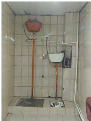
Туалет в одном из отделений Большеераковского отделения Потаповского интерната

унитазов. Чтобы как-то решить проблему нехватки унитазов в туалетных комнатах установили дополнительные передвижные стульчаки.