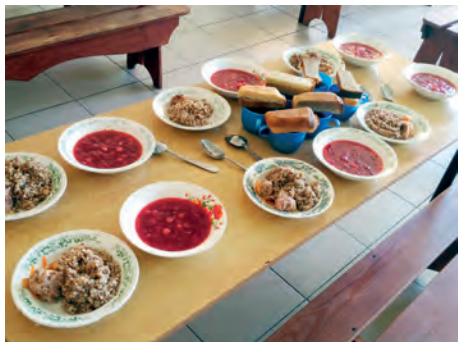
Обед в психиатрическом стационаре

входят говядина, птица, рыба, сыр, молоко, кисломолочные продукты, творог, сметана, масло сливочное и растительное, яйца, крупы, овощи свежие и консервированные, фрукты свежие, сахар, хлеб, чай, какао, настой шиповника, витаминно-минеральные комплексы и др. При наличии пациентов с сахарным диабетом и иными заболеваниями, нуждающимся организовано диетическое питание.