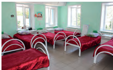
Меблированная палата (Солнечнополянский интернат) Палата (Владимировский интернат)

Существующий в большинстве психоневрологических интернатов дефицит площадей не позволяет предоставлять находящимся в них гражданам комфортные условия, обеспечивающие, в том числе соблюдение санитарно-гигиенических требований.