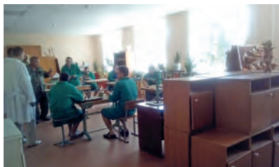
Швейная мастерская в Приволжском пансионате Столярная мастерская в Сергиевском интернате

В молодежных интернатах внедрены элементы самоуправления подопечных, созданы условия для их направленного образа жизни, абилитации. В специально оборудованных комнатах социальной адаптации наиболее сохранные инвалиды осваивают навыки самостоятельного приготовления разнообразных блюд и сервировки стола.