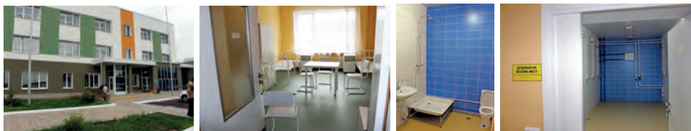
Здание, палата, санузел и душевая в новом корпусе Потаповского интерната

В новом корпусе есть гостиная с уютными диванами, буфетная, тренажерный зал и даже собственные парикмахерская и пекарня.