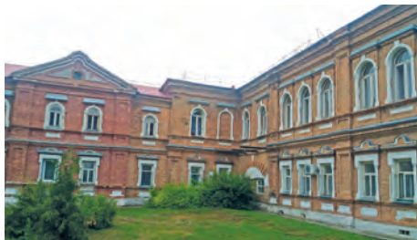
Здание Большераковского отделения Потаповского интерната

Здание Потаповского мужского отделения построено в 1966 году, из-за его изношенности, неудобства планировки и стесненных условий проживания на территории отделения построен новый современный корпус.