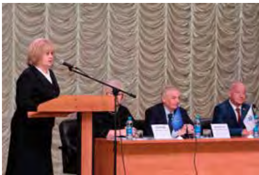
Пленарное заседание конференции по вопросам реализации и защиты экологических прав граждан

окружающую среду, а в случае невозможности их пресечения совершенствование механизмов компенсации оказанного негативного воздействия на окружающую среду.