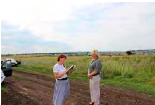
Выезды сотрудников аппарата с целью осмотра мест несанкционированных свалок, в том числе и ликвидированных

обращений. Всем обратившимся были даны разъяснения действующего законодательства, а по выявленным нарушениям приняты меры реагирования.