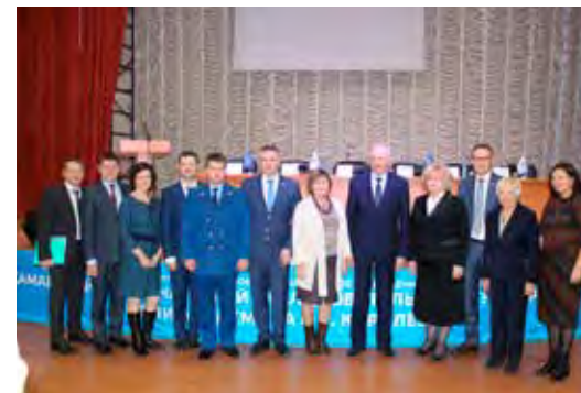
Конференция по вопросам реализации и защиты экологических прав граждан 19.10.2017 г.

– принять неотложные меры по ликвидации несанкционированных мест размещения отходов (свалок отходов, навалов мусора),