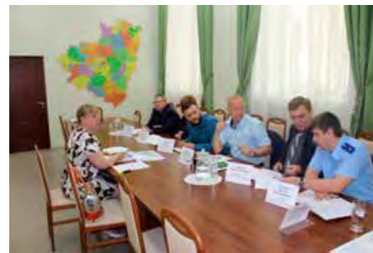
Целевой прием граждан, посвященный вопросам защиты прав на благоприятную окружающую среду

Данным нормативным актом министерству лесного хозяйства, охраны окружающей среды и природопользования Самарской об-