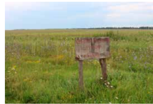
В с. п. Старая Шентала несанкционированные свалки были ликвидированы.

21 сентября 2017 года было проведено расширенное заседание Общественного и Экспертного советов по вопросам прав и свобод человека при Уполномоченном, основным вопросом рассмотрения на котором являлось состояние соблюдения на территории Самарской области прав граждан на благоприятную окружающую среду, закрепленных статьей 42 Конституции Российской Федерации.