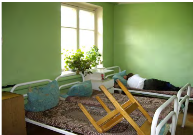
Вид жилой комнаты Нытвенского ПНИ, лето 2007 года

Не менее остро в интернатах стоит вопрос соблюдения прав граждан на жилище. Не секрет, что благоустроенность жилых помещений многих интернатов уже давно оставляет желать лучшего. Жилые помещения отдельных учреждений не соответствуют установленным санитарным и техническим требованиям, предъявляемым к жилым помещениям. Создать домашнюю обстановку для проживающих удается, к