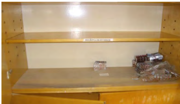
Пустые полки, предназначенные для хранения психотропных препаратов (Кизеловский ПНИ).