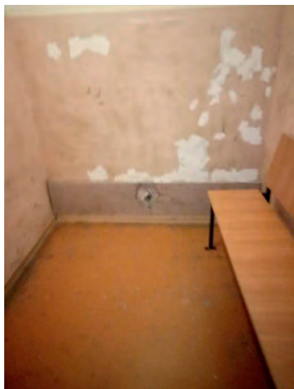
Камера для подсудимых Горнозаводского районного суда Пермского края