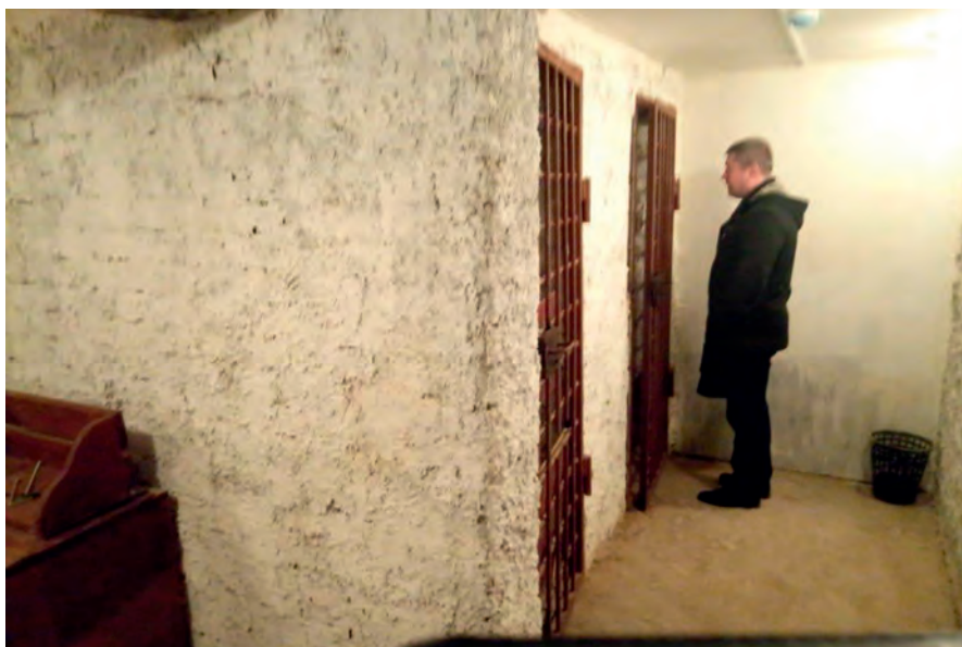
Покрытие типа «шуба» на стенах конвойного помещения Нытвенского районного суда Пермского края (псп Оханск)