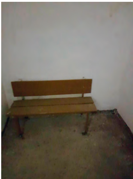
Камера конвойного помещения Косинского районного суда Пермского края