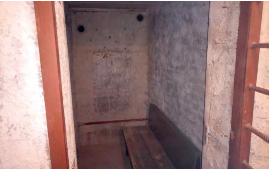
Камера для содержания подсудимых (отсутствует искусственное освещение) в конвойном помещении Нытвенского районного суда Пермского края (псп Оханск)