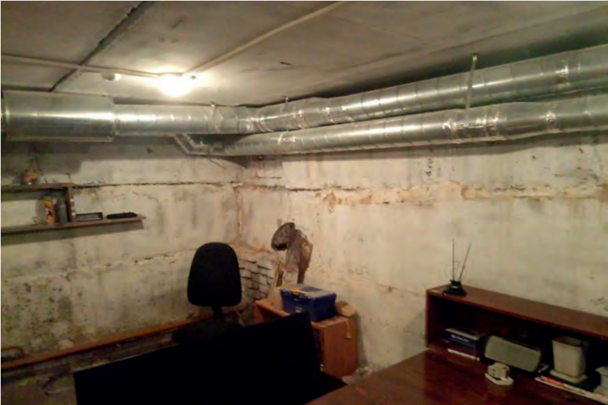
Комната для размещения конвоя в конвойном помещении Нытвенского районного суда Пермского края (псп Оханск)