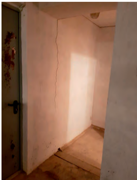
Повреждение стены коридора Косинского городского суда Пермского края