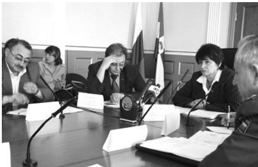
Круглый стол “Проблемы защиты прав военнослужащих и призывников” Август 2005 год

Присвоение военными комиссариатами полномочий призывных комиссий. Одной из основных проблем в сфере призыва на военную службу является присвоение военными комиссариатами полномочий, возложенных законом на призывные комиссии, которые являются гражданскими структурами. Военные комиссариаты незаконно возлагают на себя несвойственные им по закону функции и полномочия, которые входят в компетенцию призывных комиссий, что, в конечном счёте, ведет к нарушению прав граждан.