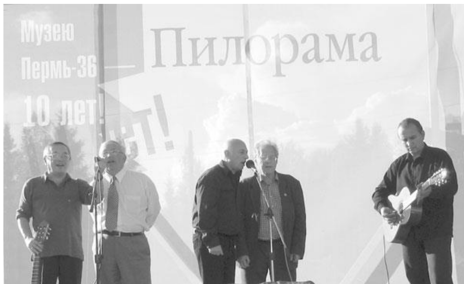
Фестиваль гражданской песни в Мемориальном музее-центре «Пермь-36» Август 2005