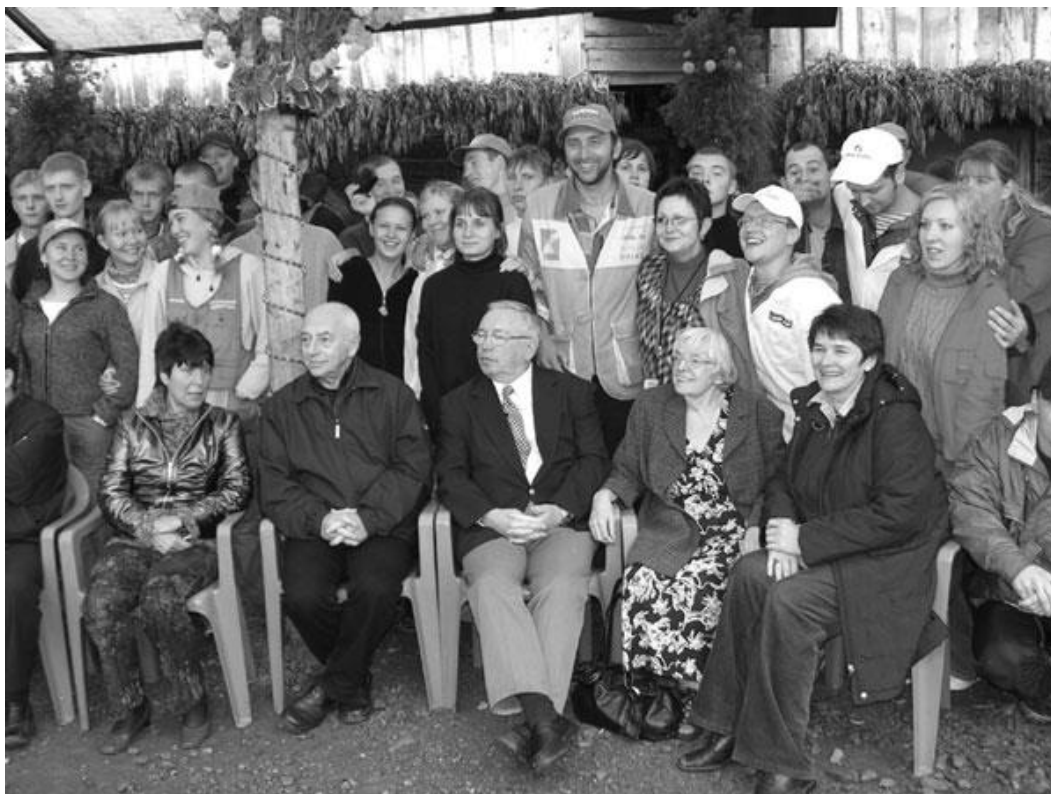
Волонтеры мемориального музея-центра «Пермь-36» - студенческий отряд «Урал-Сервис»