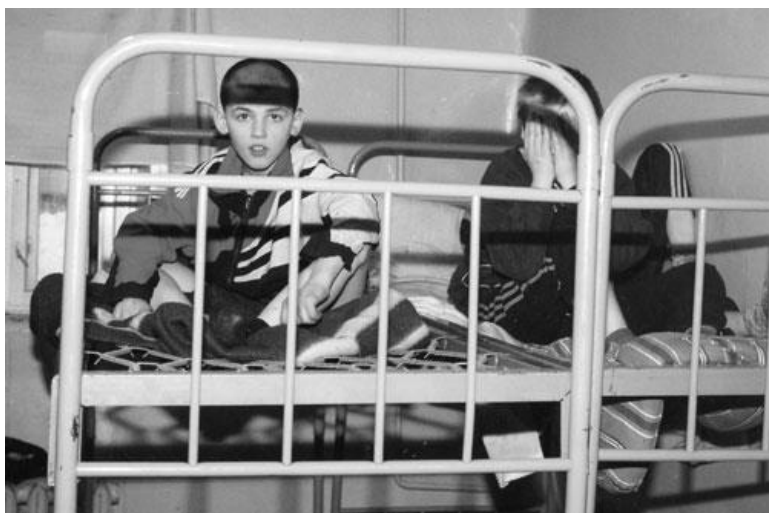
В детском приюте

По инициативе пермской Гражданской палаты и пермского правозащитного центра Уполномоченный по правам человека совместно с администрацией области планируют организовать в 2006 году общественный контроль за интернатными учреждениями области, чтобы способствовать соблюдению и восстановлению прав детей, обеспечить основу для разработки Закона «Об общественном контроле социальной сферы».