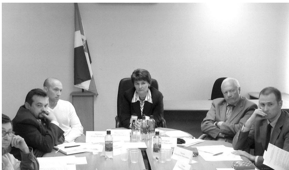
Круглый стол «Участие некоммерческих организаций в подготовке, принятии и реализации решений законодательной и исполнительной власти», 5 июля 2005 год.

В 2005 году в связи с реформированием аппарата управления администрации области традиционные формы взаимодействия региональной власти и общественных организаций заметно ослабли: не был проведён областной конкурс социальных и культурных проектов, не состоялась коммуникативная площадка для диалога власти и НКО.