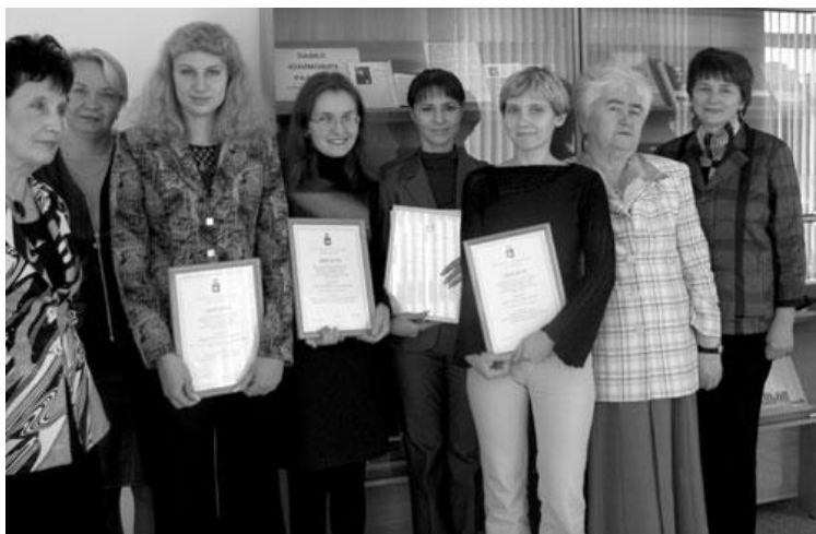
Победители регионального тура Всероссийского конкурса студенческих работ “Права человека”