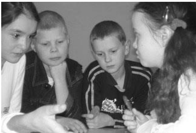
Участники финала регионального тура Всероссийского конкурса работ учащихся «Права человека глазами ребенка»