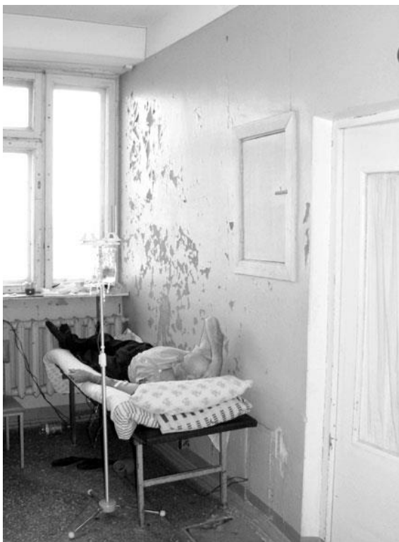
Состояние неврологического отделения МСЧ № 3

В учреждениях появилась информация для населения о видах медицинской помощи, гарантированной государством.