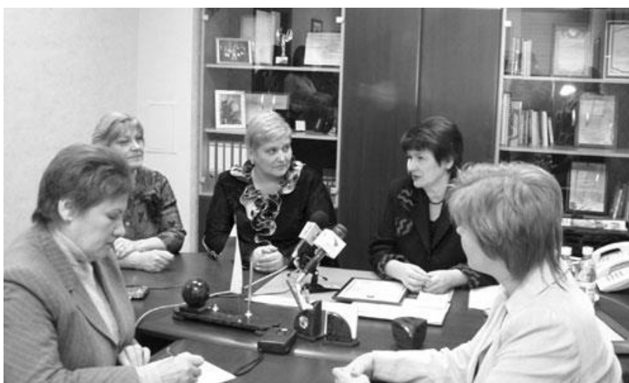
Открытие общественной приёмной по социальным вопросам г. Пермь, ул. Героев Хасана, 9а