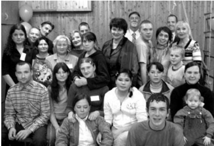
На праздновании пятилетия социального приюта «Дорога к дому» для беспризорных детей “Мост любви”.