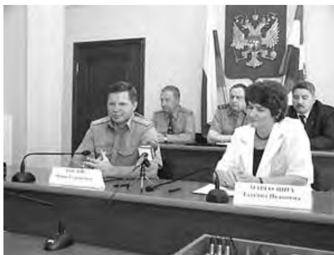
Подписание соглашения о сотрудничестве между ГУВД Пермской области и Уполномоченным по правам человека в Пермской области.

Несмотря на определенные перспективы решения материально-бытовых проблем, в ряде ИВС (Добрянском, Краснокамском, Нытвенском) необходимы меры экстренного реагирования на вопиющие условия нахождения людей. Так, например, в ИВС ОВД г. Добрянки арестованные вынуждены для умывания и питья пользоваться водой из трубы, предназначенной для смыва фекалий и расположенной в 30 см от канализационного отверстия, отправлять естественные надобности на глазах у всех остальных, содержащихся в камере, поскольку полностью отсутствуют какие-либо ограждения. Для оправления задержанных в ИВС Чердыни используются ведра, простаивающие наполненными длительное время в камерах и создающие смрад.