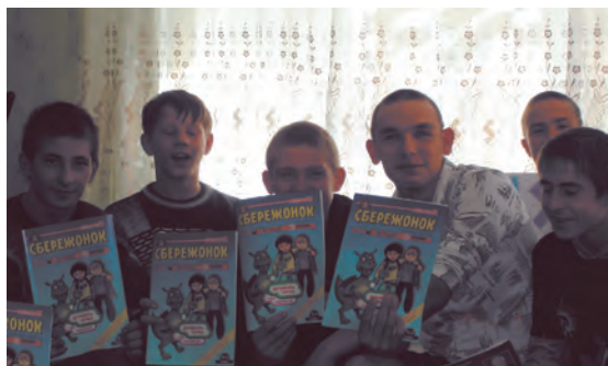
Воспитанникам «Пермяковского детского дома» к началу учебного года подарен журнал по правовому просвещению детей «СБЕРЕЖОНОК».

На обеспечение права каждого ребенка Пермского края жить и воспитываться в семье ориентирована также программа реструктуризации детских домов , предполагающая поэтапное