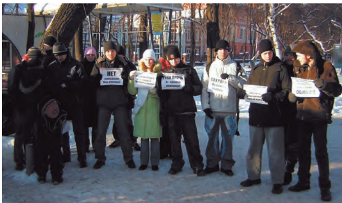
Протестная акция студентов медицинского училища декабрь 2006 года

Уполномоченным зафиксирована ситуация, когда недостаточность информации и нежелание должностных лиц предоставить эту информацию своевременно, в полном объеме и в корректной форме привело к активным протестным действиям.