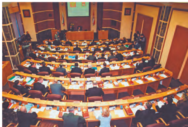
Заседание Законодательного Собрания Пермского края

В 2006 году были утверждены Концепция Устава Пермского края и Концепция Программы социально-экономического развития региона, что определило перспективы развития вновь созданного субъекта федерации.