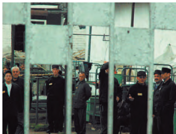
Уполномоченным зафиксирован факт проживания осужденных под открытым небом в ФГУ ИК-40 в г. Кунгур

В ходе «Круглого стола», проведенного Пермским региональным правозащитным центром на тему нарушений прав граждан в ИВС, была выявлена проблема существенного нарушения 10-дневного срока содержания в ИВС обвиняемых и подсудимых, совершенном по указанию органов прокуратуры и суда в нарушение требований ст.