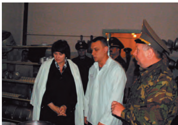
Осмотр условий приготовления пищи в ФГУ ИК–40 в г. Кунгур

В ходе совместного посещения учреждения с прокуратурой края и представителями ГУФСИН в феврале 2006 г. было установлено, что в связи с отдаленностью колонии, отсутствием какой–либо современной связи и инфраструктуры, учреждений медико–социальной сферы имелась острейшая проблема по укомплектованию штата профессиональными кадрами. Какая–либо компьютерная и печатная оргтехника в учреждении отсутствовала, что затрудняло работу учреждения по оформлению