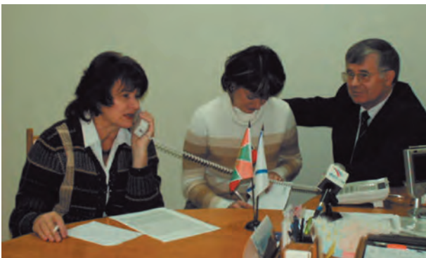
“Прямая телефонная линия” по проблемам пребывания в Пермском крае иностранных граждан и лиц без гражданства, организованная Уполномоченным по правам человека в Пермской области и Федеральной миграционной службой России по Пермскому краю.

Уникальность мероприятия заключалась в том, что семинар собрал представителей разных сторон: органов власти и общественных организаций, ведущих практическую работу по оказанию поддержки