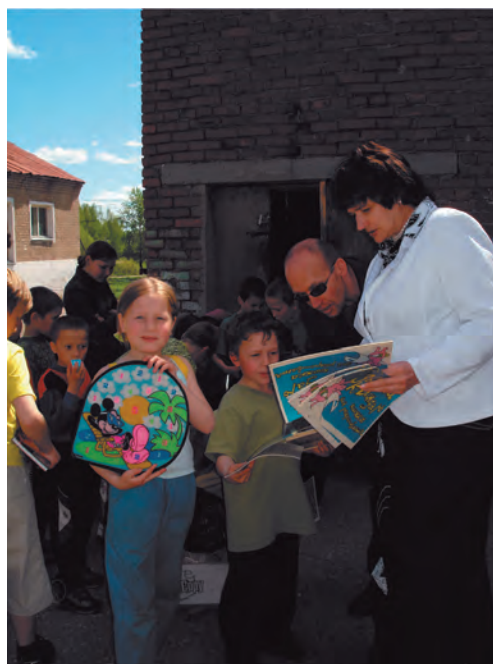
В рамках программы «Гражданские диалоги» в г. Кудымкар вручение воспитанникам детских домов подарков от жителей г. Перми

закрытие детских домов и перепрофилирование их в профессиональные центры, занимающиеся семейным устройством детей, оставшихся без попечения родителей и комплексным сопровождением замещающих семей. Это вполне естественный процесс. Однако необходимо подчеркнуть: реструктуризация детского дома в службу сопровождения – это следствие реализации права ребенка на семейное воспитание . Ликвидация детского дома как цель деятельности составляет значительный риск нарушения прав воспитанников.