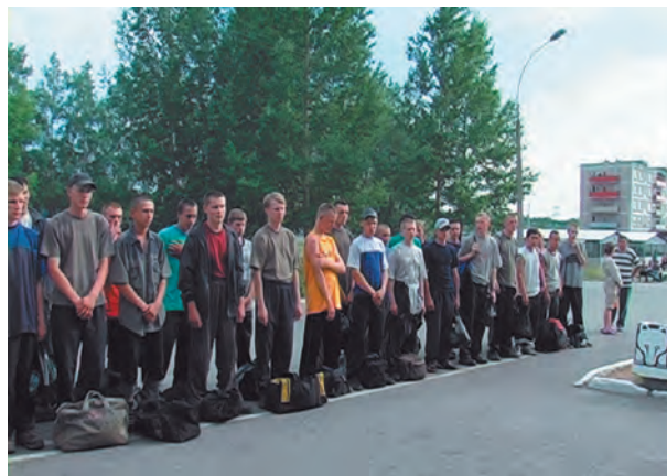
Призывники на сборном пункте Пермского края

Это – нарушение сроков призыва и незаконные вызовы в военные комиссариаты призывников, имеющих отсрочки, либо не являющихся призывниками (не достигшими призывного возраста 18 лет); нарушения прав призывников при медицинском освидетельствовании; присвоение военными комиссариатами полномочий призывных комиссий; нарушение процедуры работы призывных комиссий; нарушения права граждан на замену военной службы альтернативной гражданской службой; трудности общественного контроля за призывом, в том числе трудности общественного контроля за условиями содержания призывников на сборных пунктах.