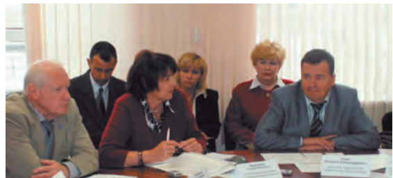
Заседание Межведомственного Совета по созданию системы ювенальной юстиции в Пермском крае

«Государство-участник в качестве первоочередных мер должно гарантировать, чтобы с детьми, не достигшими возраста наступления уголовной ответственности, не обращались как с криминальными элементами».