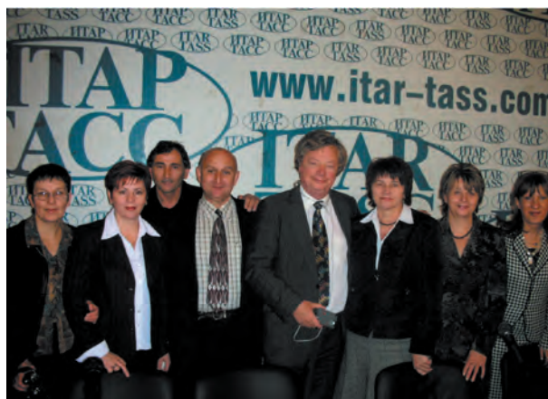
Председатель Комитета ООН по правам ребенка Джоанн Дюк с региональными Уполномоченными по правам ребенка на конференции: «Права ребенка в Российской Федерации сегодня и перспективы на будущее» (Москва)

В 2007 году институт Уполномоченного по правам человека в Пермской области должен приобрести статус краевого.