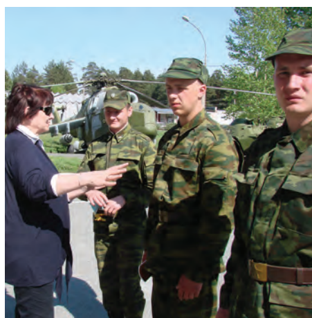
Встреча с призывниками на сборном пункте Военного Комиссариата Пермского края.