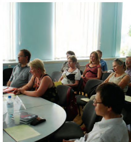
Круглый стол «Библиотеки и правозащитная деятельность», презентация публикаций Управления Верховного комиссара ООН по правам человека. (23 июля 2010, г. Пермь).