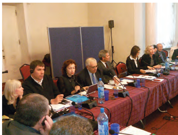
Круглый стол Уполномоченных по правам человека и Совета Европы «О ратификации протокола 14 Европейской Конвенции о защите прав человека и основных свобод и перспективах взаимодействия с Европейским Судом по правам человека» (г. Пушкино, Ленинградская область, сентябрь, 2010 г.).