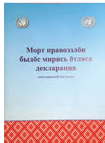
Первое издание на коми-пермяцком языке Всеобщей Декларации прав человека.