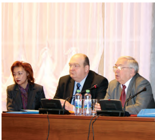
Заседание координационного совета Уполномоченных по правам человека с участием Директора Федеральной службы исполнения наказаний А.А. Реймера (в центре) (г.Москва, 10 декабря 2010г.).