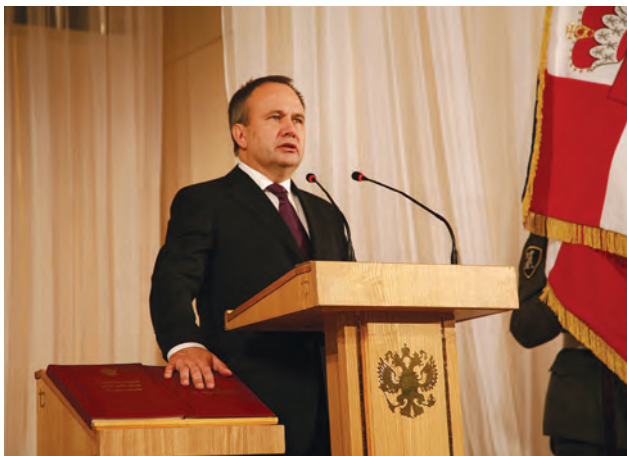
Инаугурация губернатора Пермского края Олега Анатольевича Чиркунова.