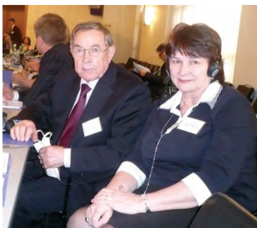
Советник Президента РФ В.Ф. Яковлев и Уполномоченный по правам человека в Пермском крае на международном экспертном семинаре. (25 марта 2010 г., Вена).