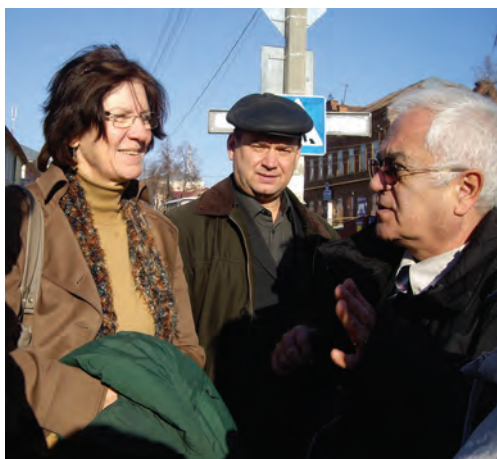
Глава Представительства УВКБ ООН в Российской Федерации госпожа Геше Карренброк во время посещения Центра временного размещения иммигрантов (беженцев) в г. Очёр (октябрь 2010 г.).