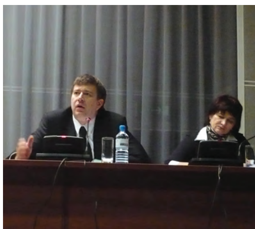
Заседание координационного совета Уполномоченных по правам человека. Встреча с министром Юстиции РФ А.В. Коноваловым. (6 апреля 2010 г., Москва).