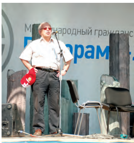
Уполномоченный по правам человека в РФ Владимир Лукин на международном форуме «Пилорама» (Пермский край, июль 2010 г.).