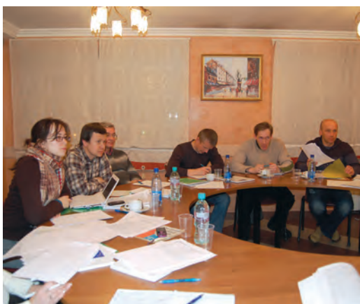
Заседание пермской гражданской коалиции «За прямые выборы».