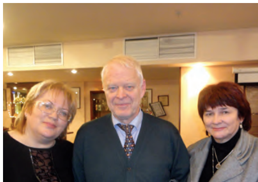
Верховный комиссар Совета Европы Томас Хаммерберг в Международный день прав человека с Уполномоченными по правам человека в субъектах РФ. (10 декабря 2010г., Москва).