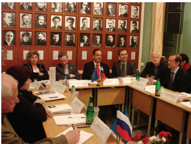
Дискуссия Еврокомиссии «20 лет спустя – становление гражданского общества в России», (май 2010 г. Мемориальный музей политических репрессий «Пермь-36»).