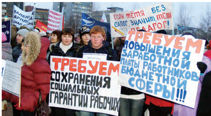
Протестные действия работников бюджетной сферы по проблемам заработной платы (10 ноября 2010 г., г. Пермь).