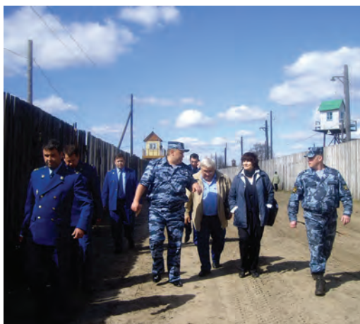
Уполномоченный по правам человека в Пермском крае в ходе совместной проверки с надзорными органами ФБУ ИК-11.