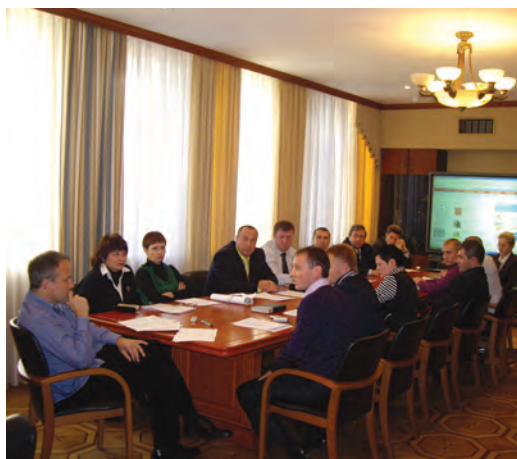
Рабочее совещание губернатора Пермского края О.А. Чиркунова с руководителями антинаркотических реабилитационных центров Пермского края. (8 ноября 2010г.).