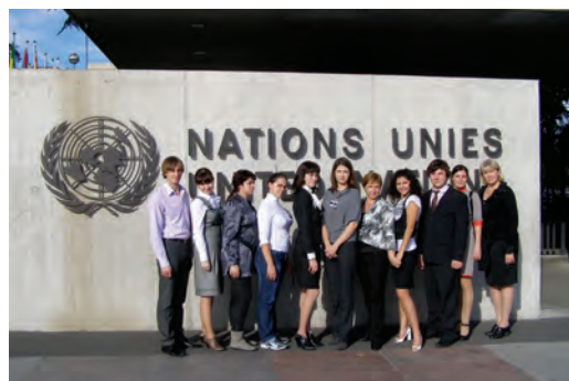
Пермская волонтерская организация «Вектор дружбы» на Социальном форуме ООН.