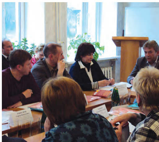
Выездное заседание комитета по социальной политике Законодательного Собрания в Чердынский район по проблемам доступности медицинской помощи (Чердынь, 9 июня 2010г.).