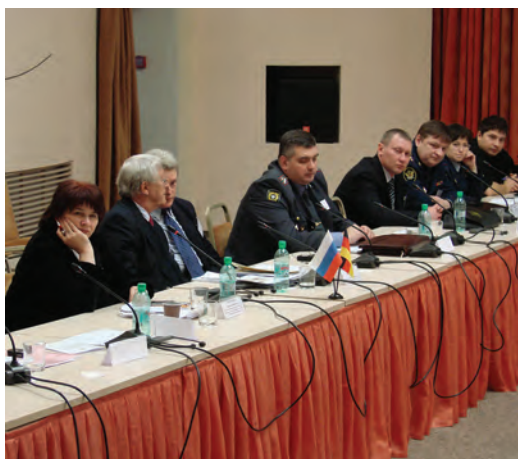
Международная Конференция «Проблемы соблюдения прав человека в местах принудительного содержания». (28–29 января 2010 год, Пермь).