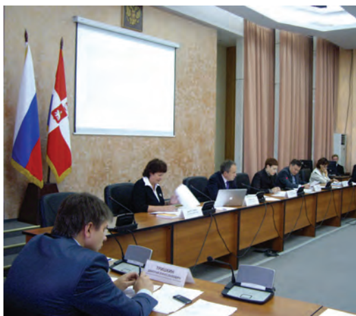
Заседание Совета по делам инвалидов при губернаторе Пермского края. (8 октября 2010 год).