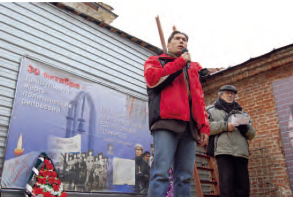
День памяти жертв политических репрессий. Пермь