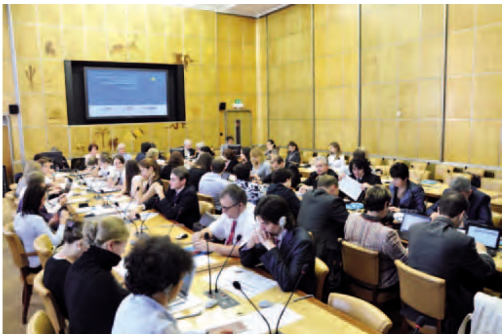
Участие Пермской делегации волонтеров АНО «Организация «Вектор Дружбы» в II Международной конференции «Общественная дипломатия и молодежное добровольчество». Октябрь 2011. Женева. Дворец Наций (ООН)

Помимо этого, в числе основных направлений деятельности организации реализация краевых, межрегиональных и международных проектов: в партнерстве с Европейским отделением Международного союза адвокатов и Торговой палатой Россия-Швейцария – организация молодежных обучающих и ознакомительных программ, проект «Край равных