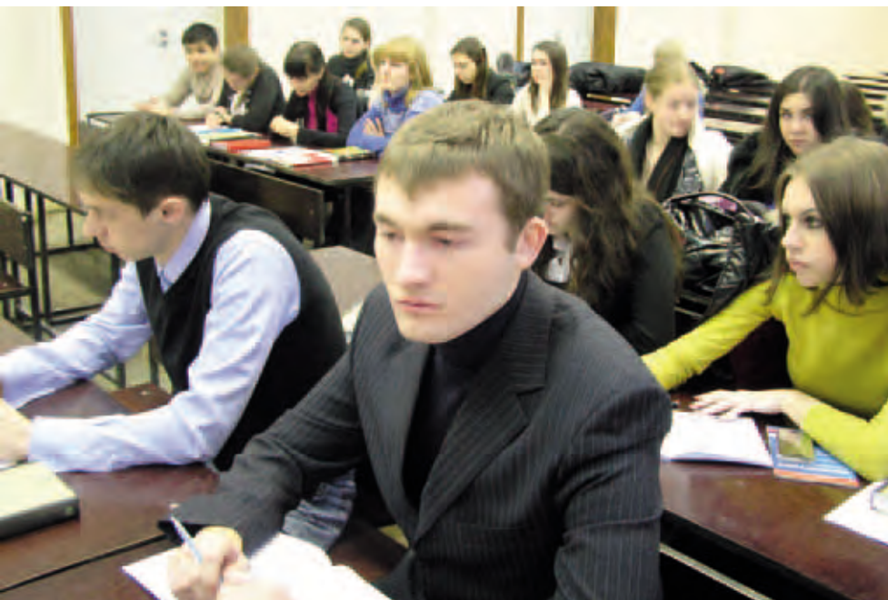
Курс права человека на юридическом факультете Пермского государственного национального исследовательского университета

В 2010 году была принята Хартия Совета Европы о воспитании демократической гражданственности и образовании в области прав человека в рамках Рекомендации Комитета министров Совета Европы, что представляет собой важный этап в работе Совета Европы и международного правозащитного сообщества в области гражданского образования.