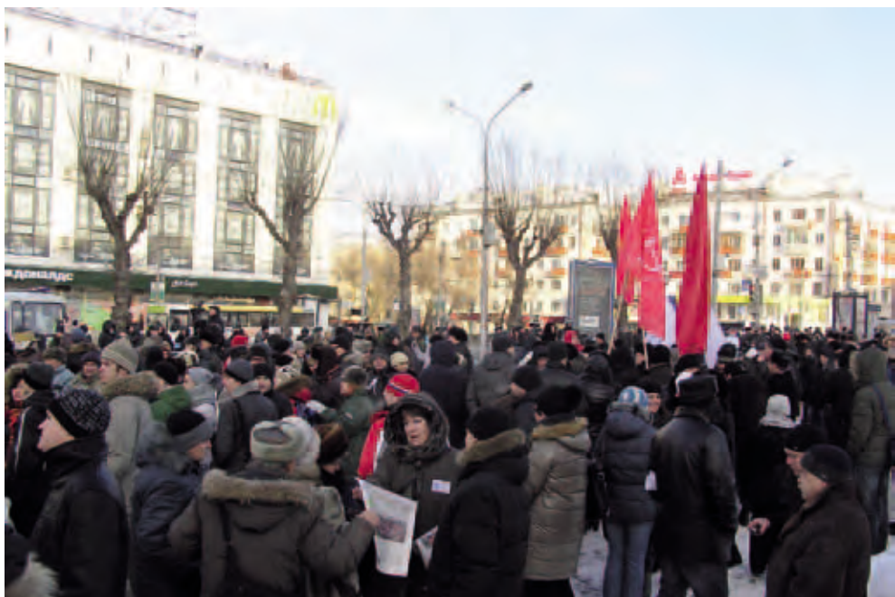
Акция «За честные выборы». 11 декабря 2011г. Пермь

Отметим, что избирательный участок является общественным местом, а члены комиссий, давая свое согласие на вхождение в их состав, становятся публичными фигура-