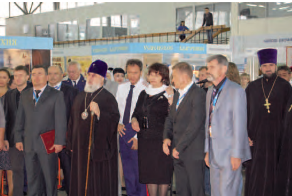
Открытие выставки «Православная Русь». Август 2011. Пермь