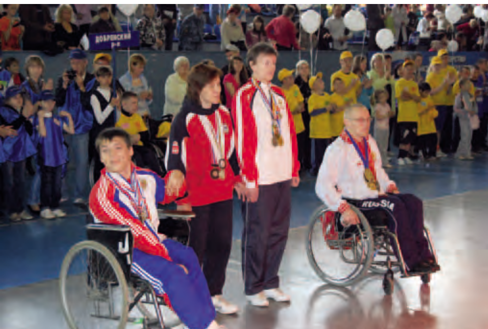
Фестиваль спорта инвалидов. Манеж Спартак

колясках в здании аэропорта и на прилегающей территории.