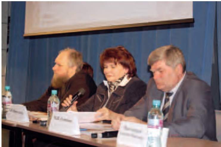
Международный симпозиум «Свобода совести и культура духовности». Май 2011. Пермь