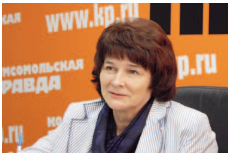
Уполномоченный по правам человека в Пермском крае Татьяна Ивановна Марголина

Ежегодный Доклад Уполномоченного по правам человека в Пермском крае подготовлен в соответствии с ч. 1 ст. 13 Закона Пермского края от 05.08.2007 № 77-ПК «Об Уполномоченном по правам человека в Пермском крае» с целью представления органам государственной власти и местного самоуправления, населению Пермского края информации о результатах деятельности Уполномоченного, его оценки ситуации с соблюдением прав и свобод человека и гражданина в Пермском крае.