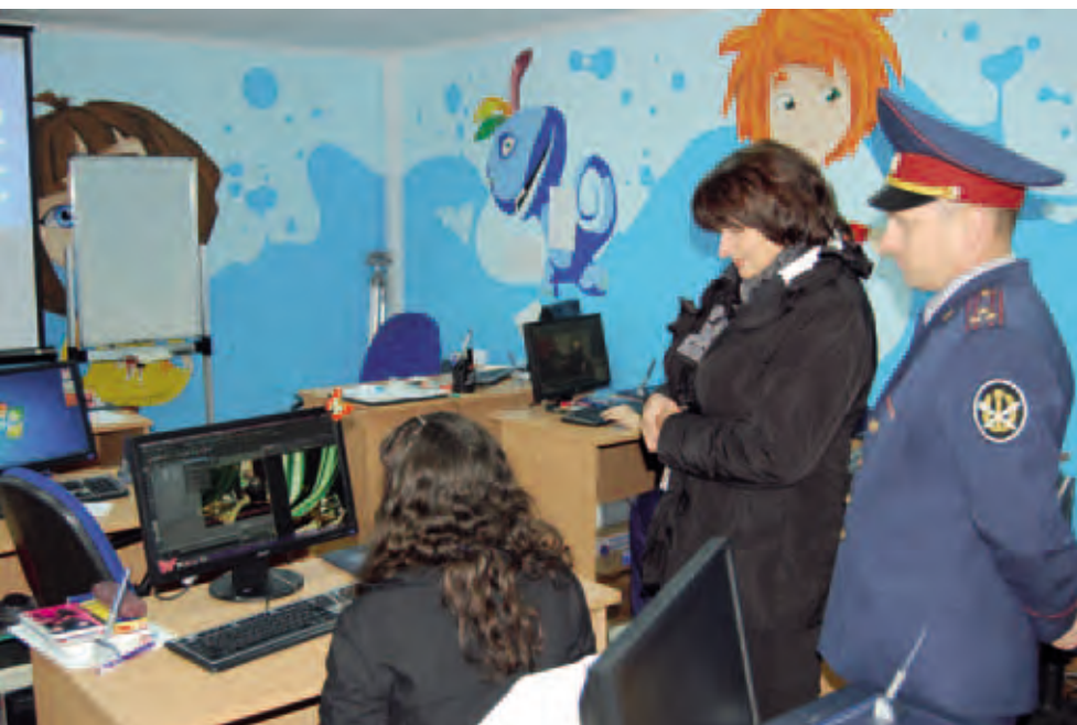
Уполномоченный по правам человека в Пермском крае в женской исправительной колонии – 32

датайства в суд. (Статистика нуждающихся, прошедших через суд и не доживших до суда.)