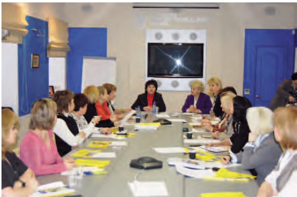
Клуб деловых женщин в Торгово-промышленной Палате Пермского края. Пермь

Одним из институтов защиты свободы предпринимательской деятельности может быть омбудсман. Эти предложения были сформулированы Пермской торгово-промышленной палатой и Центром «ГРАНИ». Инициатива была поддержана губернатором Пермского края и Уполномоченным по правам человека. В настоящее время в Законодательное Собрание вне-