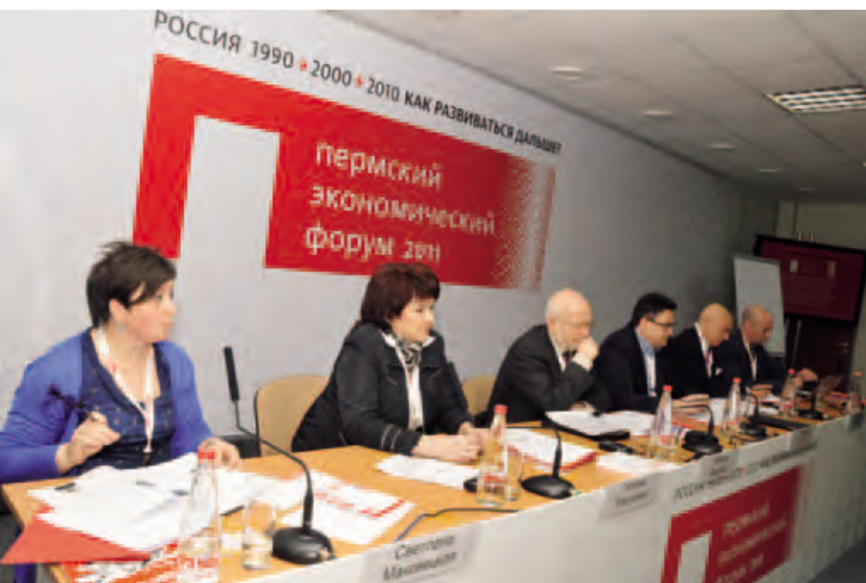
Заседание Совета по развитию гражданского общества и правам человека при Президенте РФ. Апрель 2011. Пермь

в Прикамье, проводить ежегодный мониторинг соблюдения прав детей;