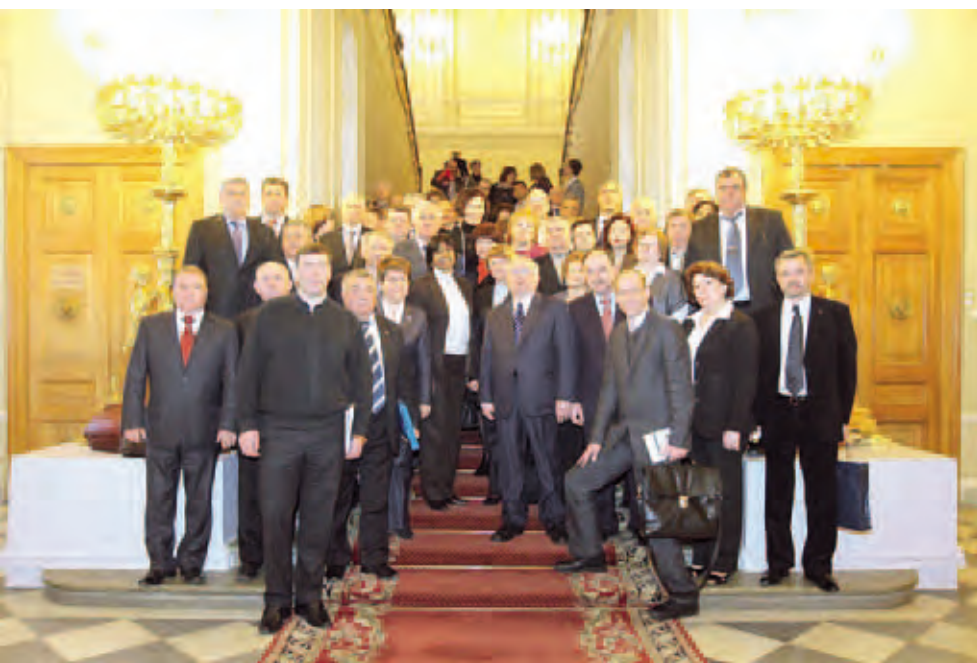
Российские уполномоченные по правам человека на встрече с Верховным комиссаром ООН по правам человека Наванетхем Пиллэй. Февраль 2011. Санкт-Петербург

Согласно ст. 11 Закона Пермского края 05.08.2007 № 77-ПК «Об Уполномоченном по правам человека в Пермском крае», одной из основных задач Уполномоченного является содействие развитию международного сотрудничества в области прав и свобод человека.