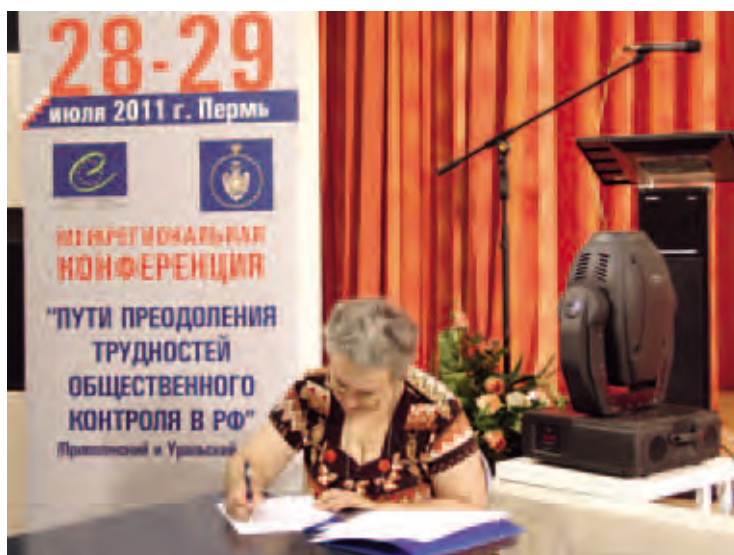
Межрегиональная конференция по общественному контролю мест принудительного содержания. Июль 2011. Пермь