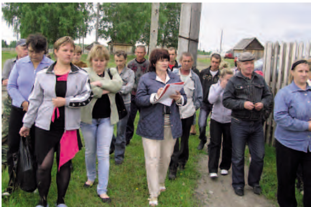
На встрече Уполномоченного по правам человека в Пермском крае Т.И. Марголиной с жителями поселка и сотрудниками психоневрологического интерната. Июль 2011. Поселок Булатово, Красновишерский район