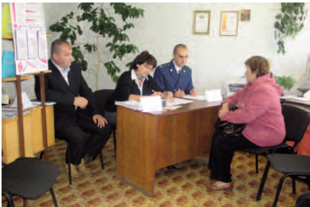
Кизеловская межпоселенческая библиотека. Прием граждан. Ноябрь 2011

В целом в 2011 году произошло поэтапное увеличение