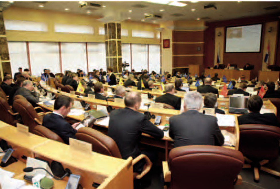
Заседание Законодательного Собрания Пермского края