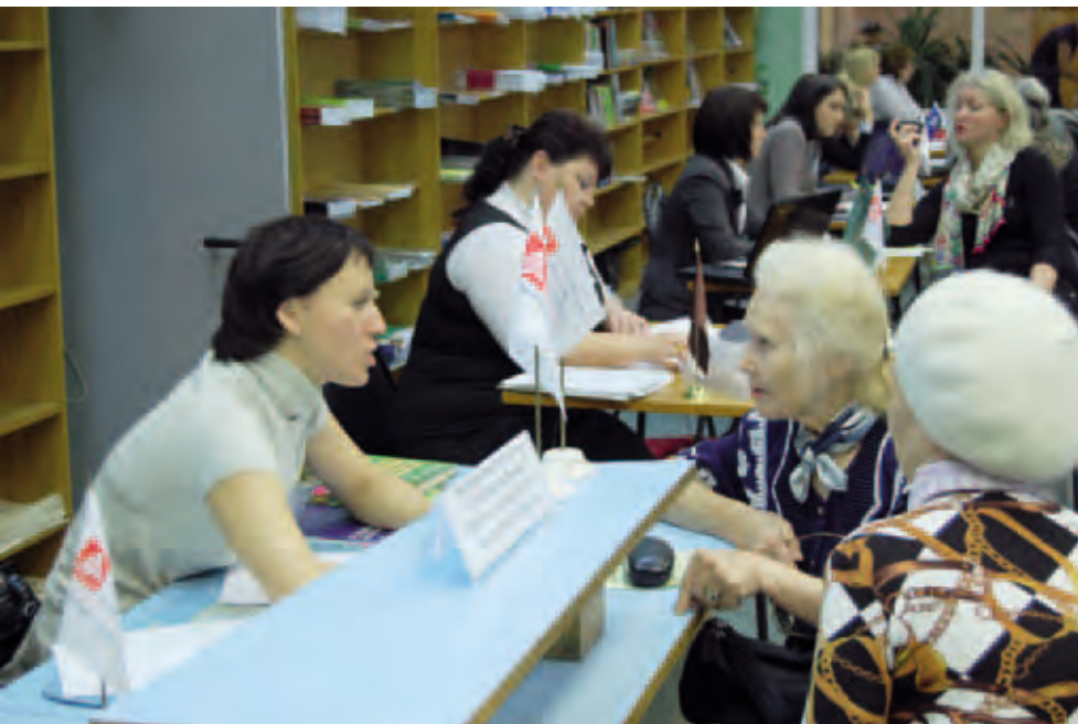
Совместные консультации аппарата Уполномоченного по правам человека в Пермском крае и Российской гильдии риэлторов в Пермском крае. Пермь

Рассматриваются возможности внедрения и апробации в секторе ЖКХ технологий медиации для урегулирования конфликтов.