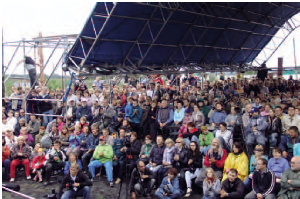
VII Международный гражданский форум «Пилорама-2011»