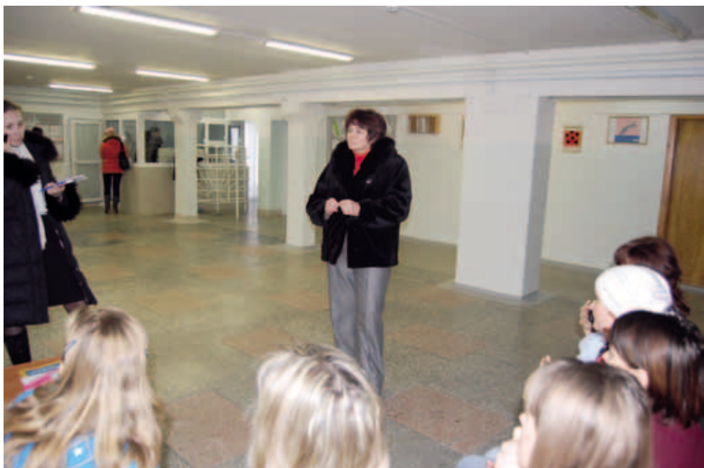
Встреча Уполномоченного с жителями общежития Пермского национального исследовательского политехнического университета по проблеме их выселения. Февраль 2011. Пермь

Работа с жильцами других государственных общежитий (ул. Карпинского, 79а, ул. Обвинская, 12а, ш. Космонавтов, 185, ул. Р.-Крестьянская, 17 Перми и ул. Энтузиастов, 24 Краснокамска, а также общежития Кудымкара и Чайковского) была продолжена. Ранее все общежития находились на балансе различных государственных и образовательных учреждений Пермского края, позже были переданы на баланс краевого государственного автономного учреждения «Управление общежитиями Пермского края», в связи с чем всем жильцам было предложено перезаключить договоры найма. Тем, кто не согласился заключить новые срочные договоры найма жилых помещений специализированного жилищного фонда,