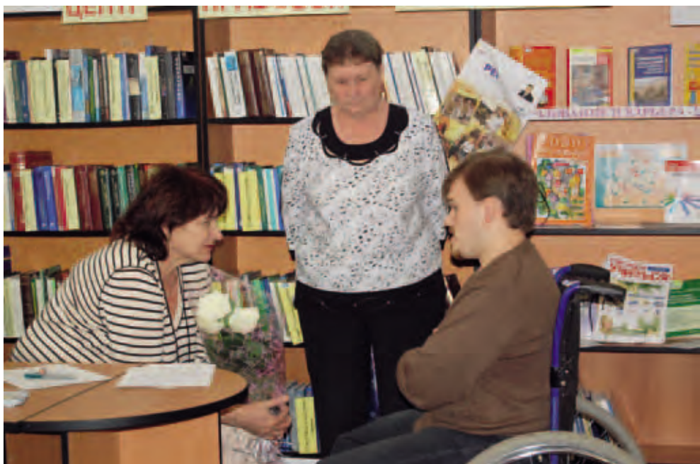
Прием в Красновишерске. Как решить проблемы о переселении инвалида на первый этаж?

1. Снята возможность субъективного подхода в отказе постановки на учет нуждающихся в жилых помещениях социального использования. Законодательная инициатива Уполномоченного по правам человека в Пермском крае уточнила основания, по которым можно отказать нуждающемуся в постановке на учет. Изменения в Закон Пермского края «О порядке ведения органами местного самоуправления учета граждан в качестве нуждающихся в жилых помещениях, предоставляемых по договорам социального найма» № 2694-601