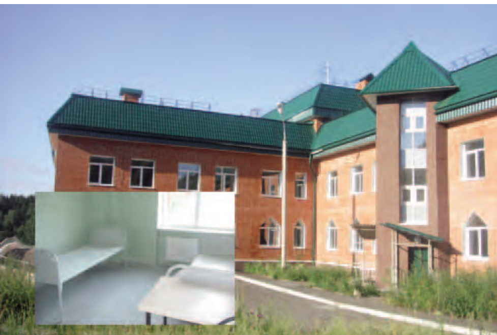
Новый корпус Пермской краевой клинической психиатрической больницы в микрорайоне Банная гора. Июль 2011

Как было отмечено на заседании, психические заболевания – серьезная медико-социальная проблема современного общества. По данным Всемирной Организации Здравоохранения (ВОЗ) более 450 млн людей в мире имеют психические отклонения. По прогнозам ВОЗ, к 2020 году психические расстройства войдут в первую пятерку болезней, ведущих к потере трудоспособности.