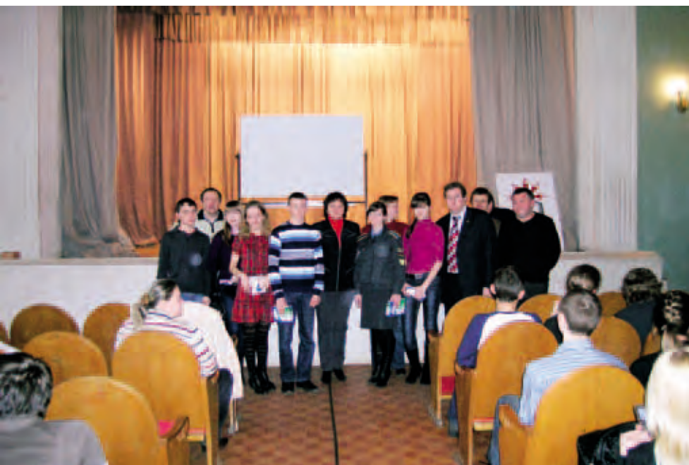
Победители XI Пермской городской открытой олимпиады по правам человека среди учащихся 9-11 классов. Апрель 2011. Пермь

и гражданскому образованию детей и взрослых Пермского края. В течение года организовывались различного уровня переговорные площадки с участием представителей некоммерческих организаций, представителей органов исполнительной власти для дальнейшей разработки единой концепции развития гражданского образования и правового просвещения в крае, а также продолжения действия Программы развития политической культуры и гражданского образования населения Пермского края в 2012 году и последующие годы.