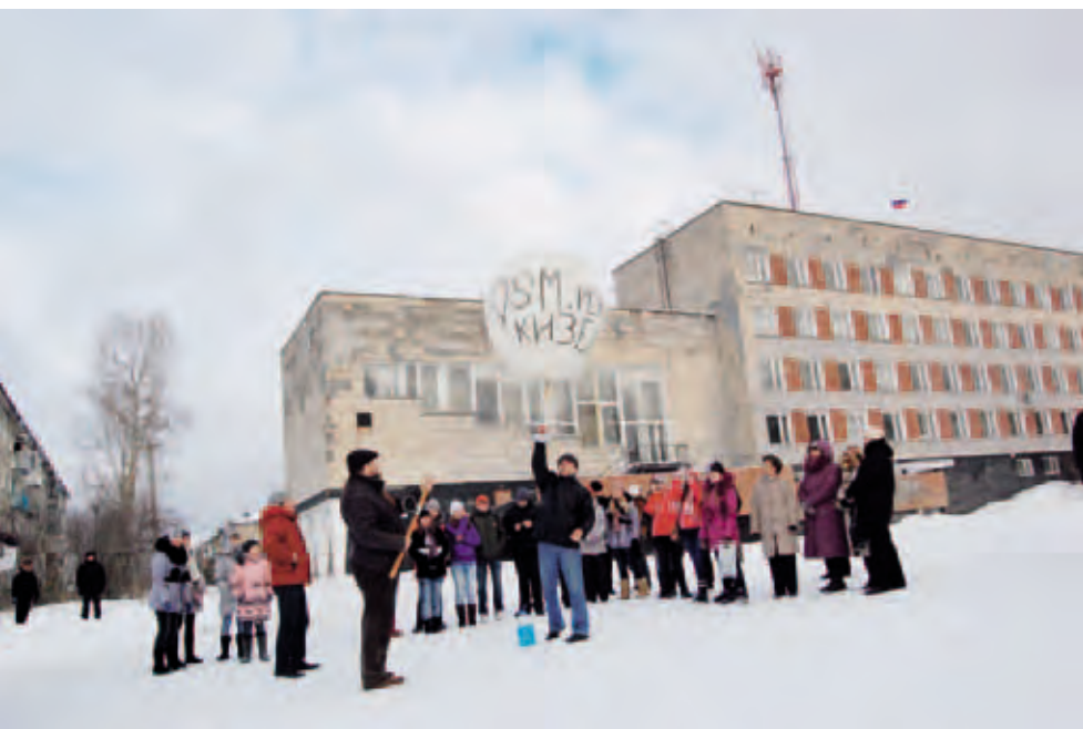
Проект «Открытые карты Пермского края». Запуск метеорологического зонда с фотоаппаратом для проведения аэрофотосъемки. Ноябрь 2011. Кизел

Эти первые проекты показывают уникальные возможности краудсорсинга – совместного решения задач в он-лайн среде большими группами людей.