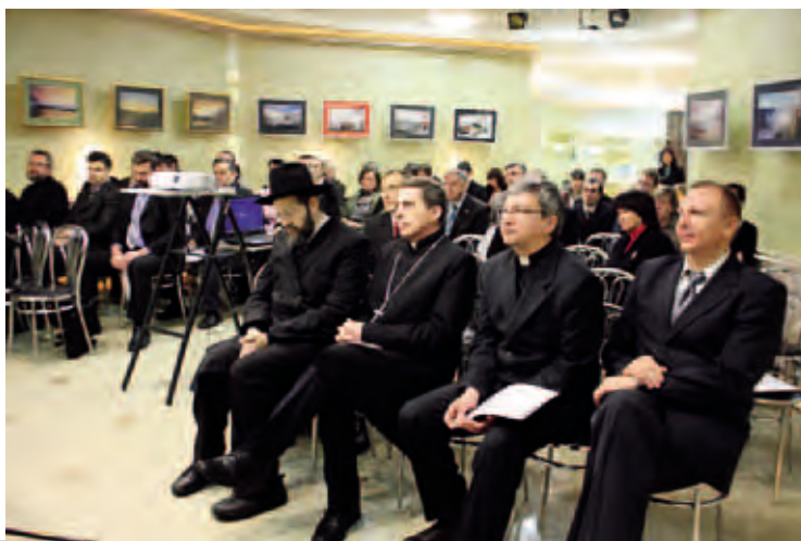
Первый Пермский региональный молитвенный завтрак. Ноябрь 2011. Пермь

бежья. В рамках выставки состоялись различные круглые столы, презентации православных учебных заведений.