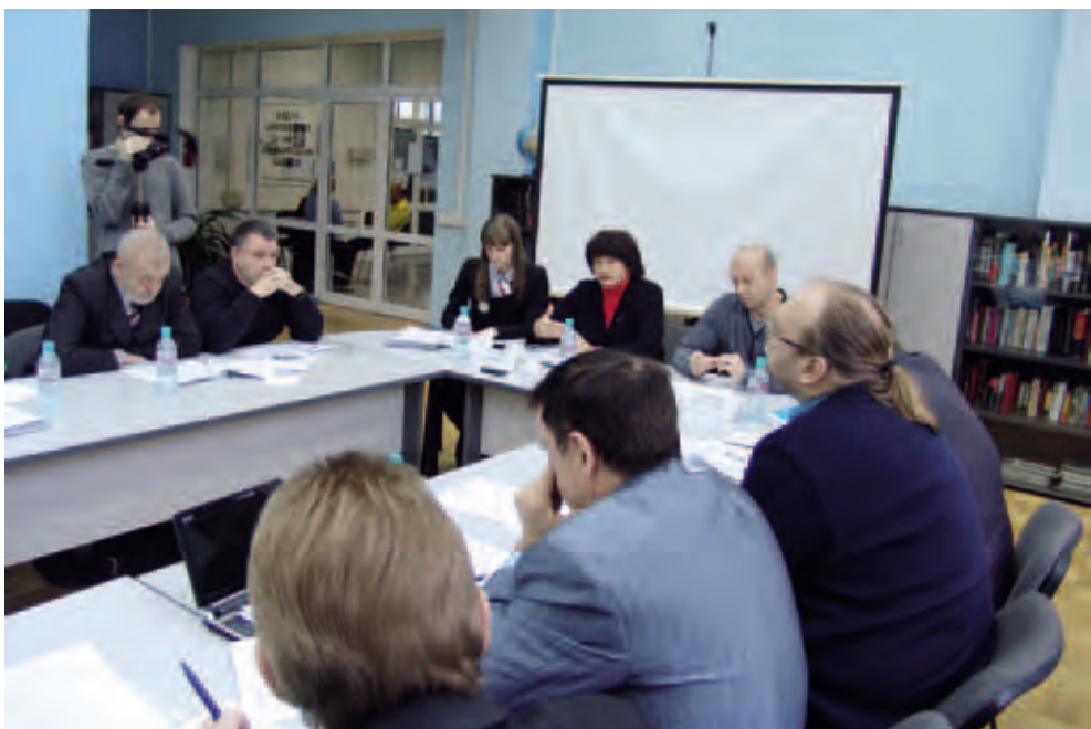
Обсуждение закона «Об общественном (гражданском) контроле в Пермском крае». Ноябрь 2011. Пермь

Отдельно в Законе прописана процедура наделения полномочиями членов региональной группы, кандидатуры в состав которой имеют право выдвигать некоммерческие организации. Специально для реализации мероприятий по общественному (гражданскому) контролю предусматривается создание Комиссии при Общественной палате Пермского края, не менее половины которой также должны составлять представители некоммерческих организаций. С этой целью Уполномоченным по правам человека в рамках законодательной инициативы были внесены изменения в Закон Пермского края «Об Общественной палате Перм-