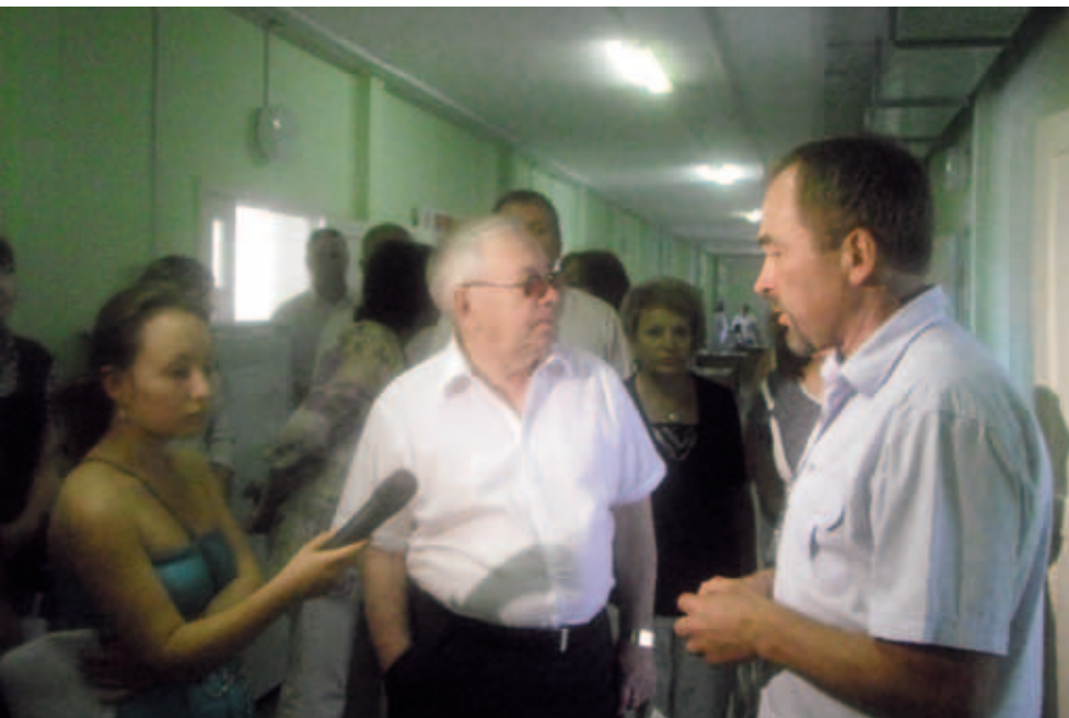
Посещение Уполномоченным по правам человека в Российской Федерации В.П. Лукиным психиатрического стационара в д. Байболовка Пермского края. Июль 2011