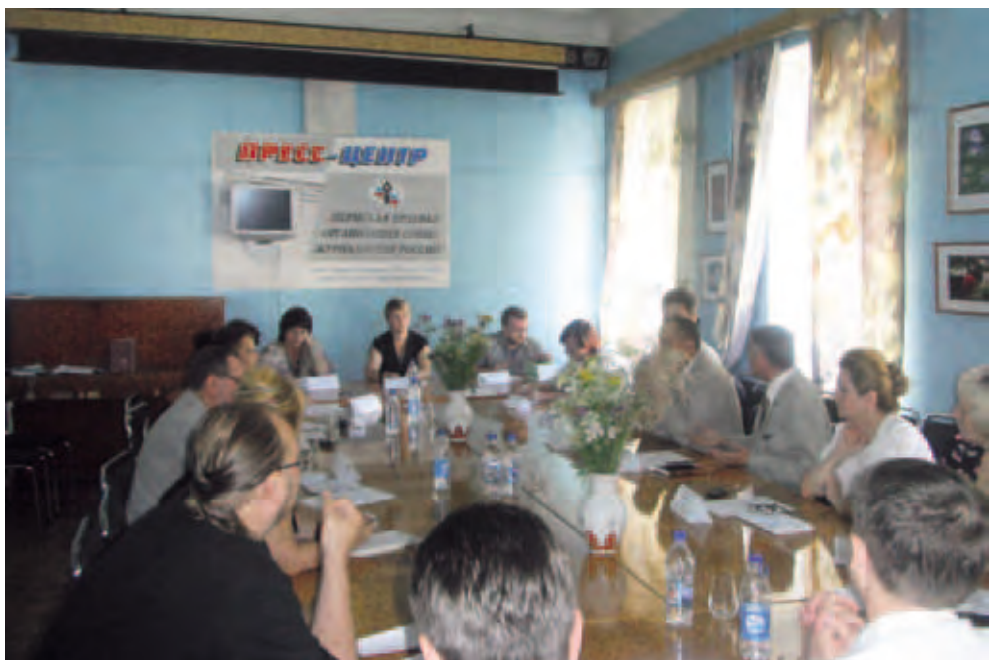
Круглый стол «Экстремизм сегодня: формы и степени проявления, проблемы определения». Июль 2011. Пермь

Эти рекомендации, судя по настроению руководителей средств массовой информации, будут выполнены, поскольку муниципальные редакции серьезно зависят от финансовой поддержки краевой власти и органов МСУ. А результатом такого «избирательного молчания» станет не только нарушение конституционных прав граждан на получение своевременной и достоверной информации, но и отказ кандидатам в депутаты Законодательного Собрания в доступе к печатной