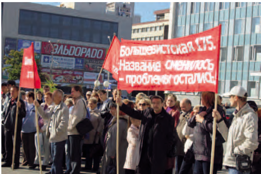
Митинг обманутых дольщиков. Август 2011. Пермь

- вернуть органам местного самоуправления полномочия по проверке деятельности УК в МКД по обращениям собственников;