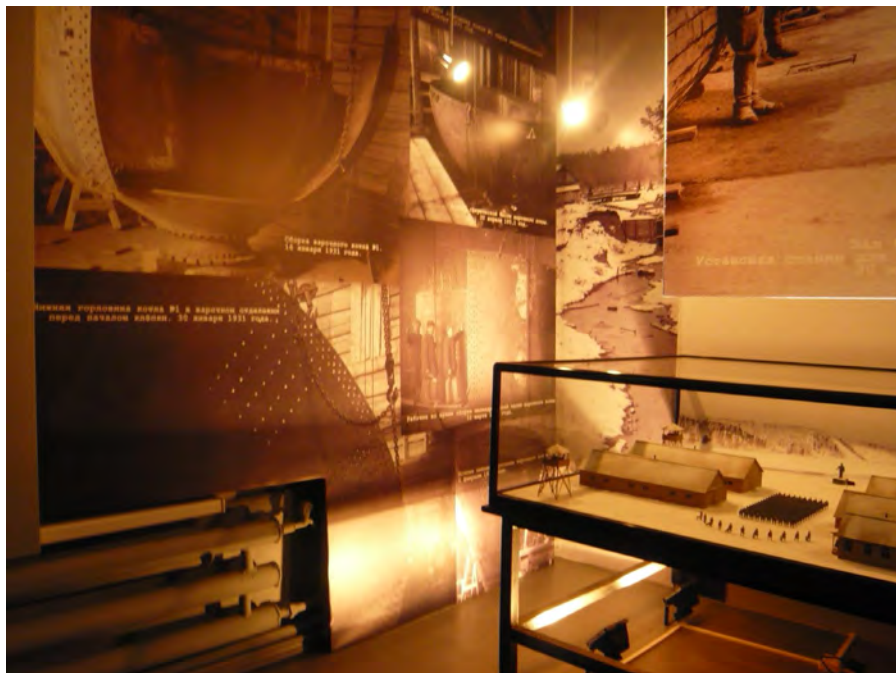
Музей-диорама «Лагерь на Красной горке», г.Красновишерск