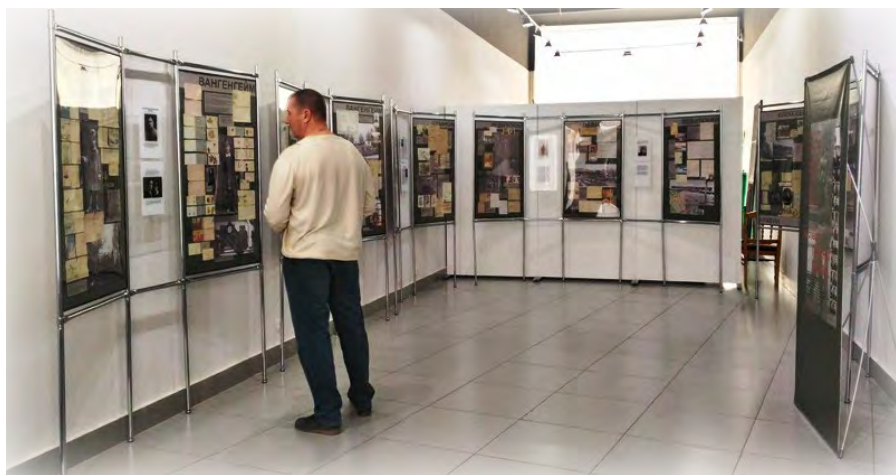
Передвижная выставка «Папины письма», организатор – Пермское краевое отделение Международного общества «Мемориал»

Более пятнадцати лет при содействии учреждений культуры, образования, архивного отдела, краеведческого музея и общественности в Красновишерском районе проводится активная работа по теме политических репрессий, имеющих место как по всей стране в 1930-50-е годы XX столетия, так и Вишерской земле, где находился ВИШЛАГ, четвертое отделение Соловецких лагерей (СЛОН). В результате совместных действий в Красновишерске за последние годы проведено множество мероприятий, направленных на реализацию краевого проекта «Территория культуры Пермского края»: с 2011г. проведено 12 выставок на тему репрессий 30 – 40-х годов 20 века. Наиболее значимые: «Города несвободы» совместно с 5 города-