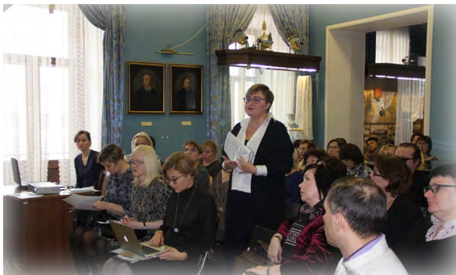
Встреча Уполномоченного с директорами муниципальных музеев

Уполномоченным по правам человека в Пермском крае в целях разработки настоящего доклада в музеи края был направлен запрос о предоставлении необходимой информации, направленной на реализацию Концепции. Стоит отметить, что на запрос Уполномоченного поступили ответы из 32-х музеев Перми и Пермского края, но в данном докладе будут проанализированы ответы муниципальных музеев г. Перми и Пермского края, что составило 26 музеев.