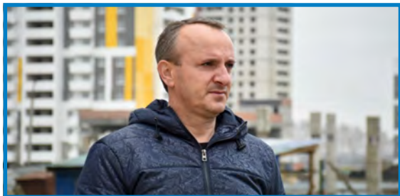
Агамагомедов М. К., заместитель главы администрации г. Пензы