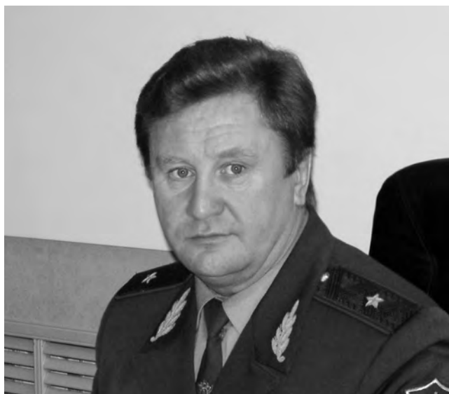
Юрий Денисов, начальник УФСКН России по Пензенской области

Данная отсрочка объяснялась необходимостью обсудить возможность данных ограничений с про-