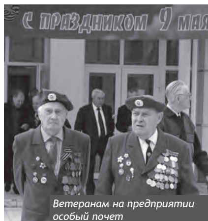
Ветеранам на предприятии особый почет

Особое внимание уделяется ветеранам Великой Отечественной войны и трудового фронта, блокадникам Ленинграда, узникам концлагерей. Каждый год проводятся мероприятия, посвященные празднованию годовщины Великой Победы. Финансирование этих мероприятий за 2009-2011 гг. составило около 7,5 млн. руб.