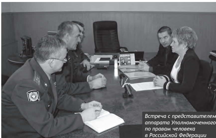
Встреча с представителем аппарата Уполномоченного по правам человека в Российской Федерации

В марте 2012 года в аппарат Уполномоченного поступило обращение от жительницы Пензы об оказании ей содействия в решении вопроса о ремонте вентиляционной труб в квартире. Она указала, что по данному вопросу не раз обращалась в ООО «Управляющая организация «Жилье-7-1», ООО «Генеральная управляющая компания», но мер принято не было. Самостоятельно осуществить данные работы у заявительницы не было возможности. После обращения Уполномоченного в ООО «ГУК» была выполнена прочистка дымохода с устранением завалов в квартире заявительницы.