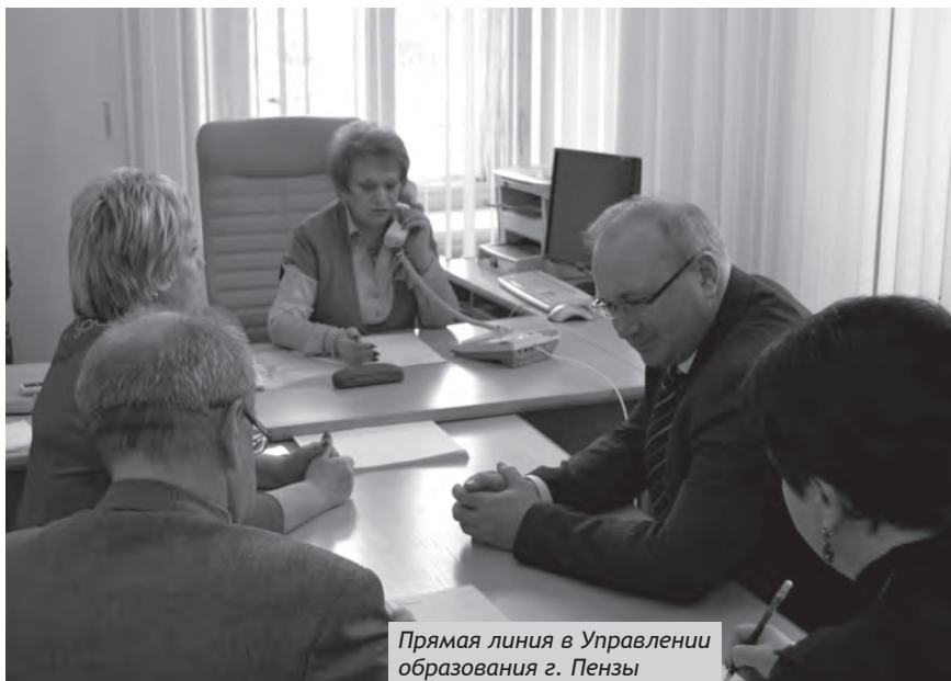
Прямая линия в Управлении образования г. Пензы

Уполномоченным направлены письма в компетентные органы, после чего 23 января сотрудниками Управления ГИБДД совместно с представителями администрации Колышлейского района было осуществлено обследование указанных улиц и дорог. Установлено, что подъездная дорога к с. Скрипицыно заужена, обочина не расчищена от снега. За несоблюдение требований по