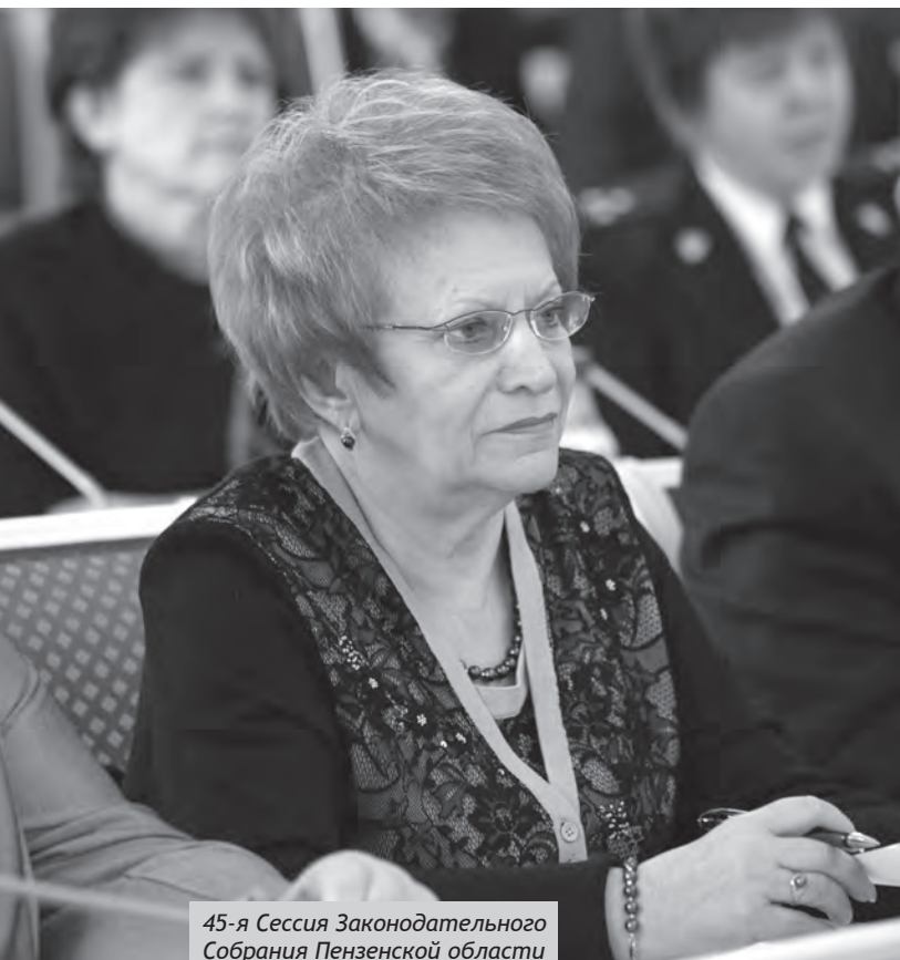
45-я Сессия Законодательного Собрания Пензенской области