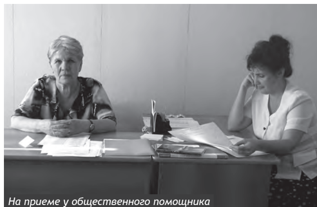
На приеме у общественного помощника

Зачастую жители области не готовы самостоятельно решать свои проблемы или не имеют такой возможности, поэтому вынуждены обращаться за помощью к Уполномоченному по правам человека и его общественным помощникам на местах. Научить граждан грамотно излагать суть жалоб на бумаге, направлять их в адрес тех, кто обязан по действующему законодательству их разрешать, непосредственно рассматривать обращения — одна