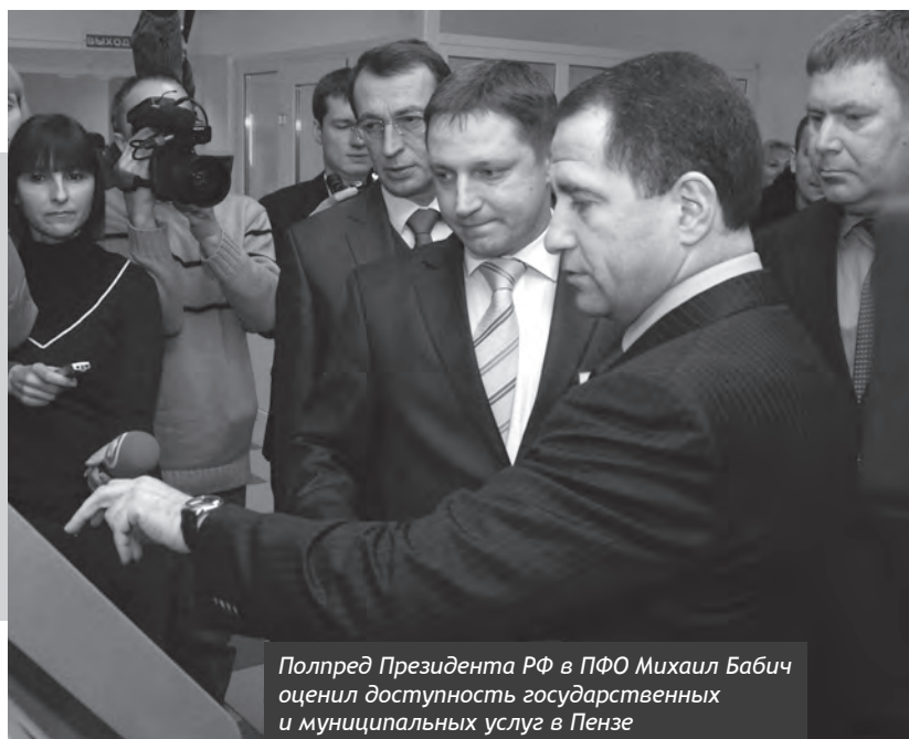
Полпред Президента РФ в ПФО Михаил Бабич оценил доступность государственных и муниципальных услуг в Пензе

Составлено: исковых заявлений — 4133, других документов — 4367, дано устных консультаций — 34745. Кроме того, за указанный период специалисты отдела принимали участие в 12-ти судебных заседаниях.