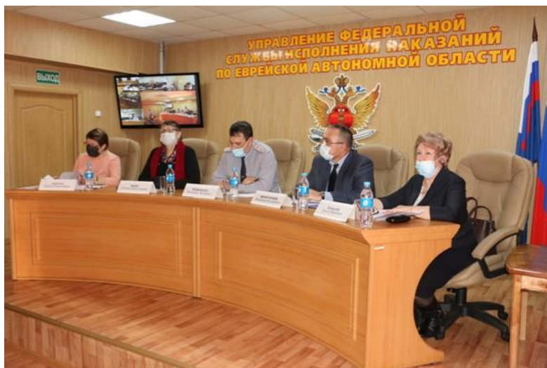
Совещание по вопросу защиты прав осужденных граждан в учреждениях УФСИН России по ЕАО (в режиме видеоконференцсвязи)

На информационном стенде Уполномоченного по правам человека в офисе в отчетном периоде было размещено более 120 материалов по различным тематикам, на сайте Уполномоченного 86 материалов в разделе «Новости».