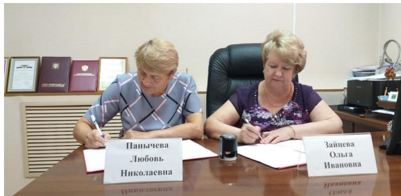
Подписание Соглашения о взаимодействии с региональным отделением Всероссийского общества инвалидов ЕАО

Заключено соглашений с государственными органами – 14.