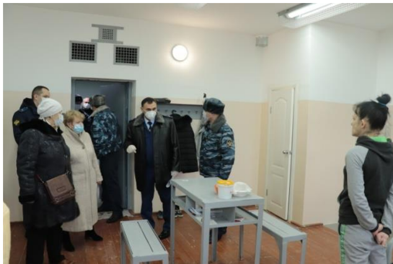
Проверка ФКУ «Следственный изолятор № 1» УФСИН России по ЕАО, прием по личным вопросам совместно с прокуратурой ЕАО

- Прокуратура ЕАО – 4 (нарушение прав граждан в части обеспечения медицинскими препаратами льготного назначения, неисполнение судебного решения в части обеспечения жильем семьи с ребенком-инвалидом, нарушение прав граждан в части получения компенсационных выплат в связи с подтоплением, нарушение прав граждан при содержании в местах принудительного содержания (ИВС), нарушение прав осужденных – инвалидов);