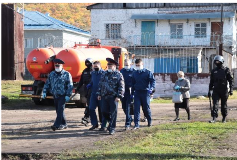
Проверка ФКУ «Исправительная колония № 10» УФСИН России по ЕАО