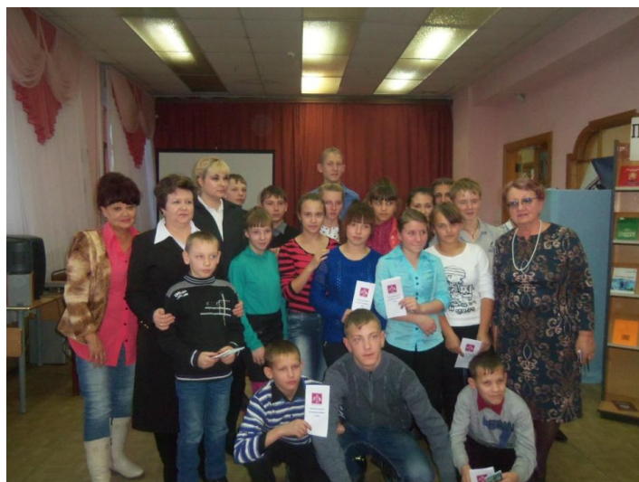
День Правовой помощи для детей 20.11.2019