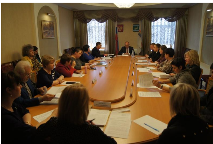
Заседание Координационного совета Правительства ЕАО по вопросам оказания бесплатной юридической помощи