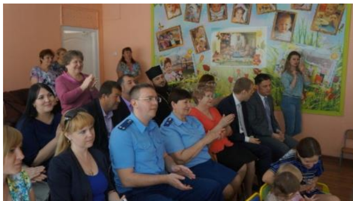
Встреча с воспитанниками Детского дома г. Биробиджана