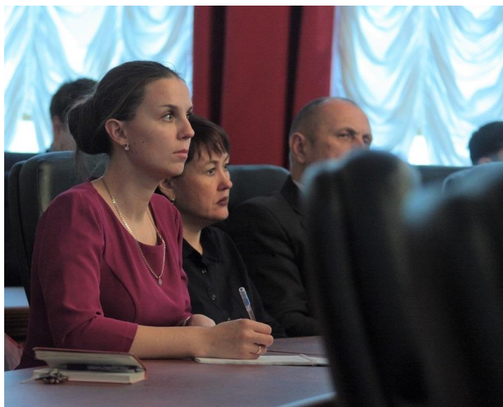
Сотрудник аппарата Уполномоченного по правам человека на общественных слушаниях по вопросу охраны общественного порядка