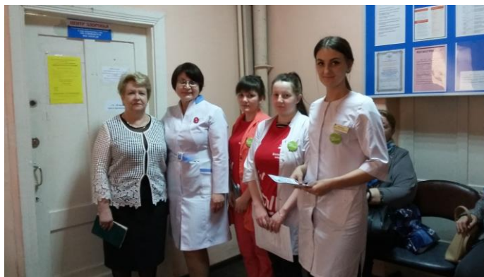
Проведение акции «Волонтеры - медики» в ОГБУЗ «Областная больница»