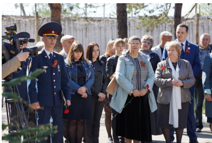
Митинг, посвященный Дню Победы, в Биробиджанской воспитательной колонии УФСИН России в ЕАО