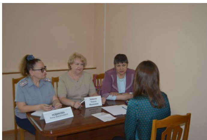
Личный прием родственников осужденных граждан Уполномоченным по правам человека, председателем Общественной наблюдательной комиссии