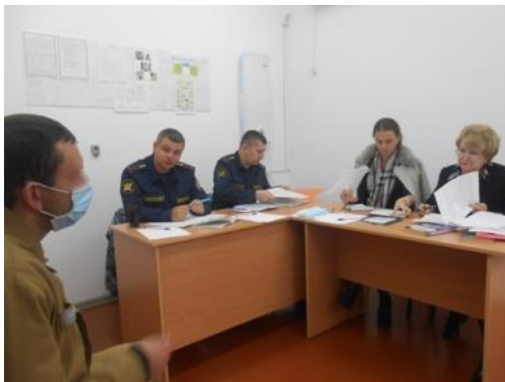
Прием граждан по личным вопросам в Лечебно-исправительном учреждении УФСИН России по ЕАО