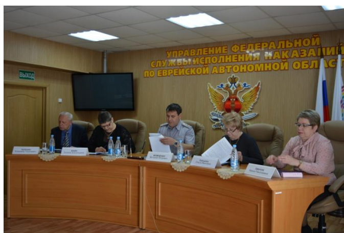
Заседание коллегии УФСИН по итогам работы за 2018 г.