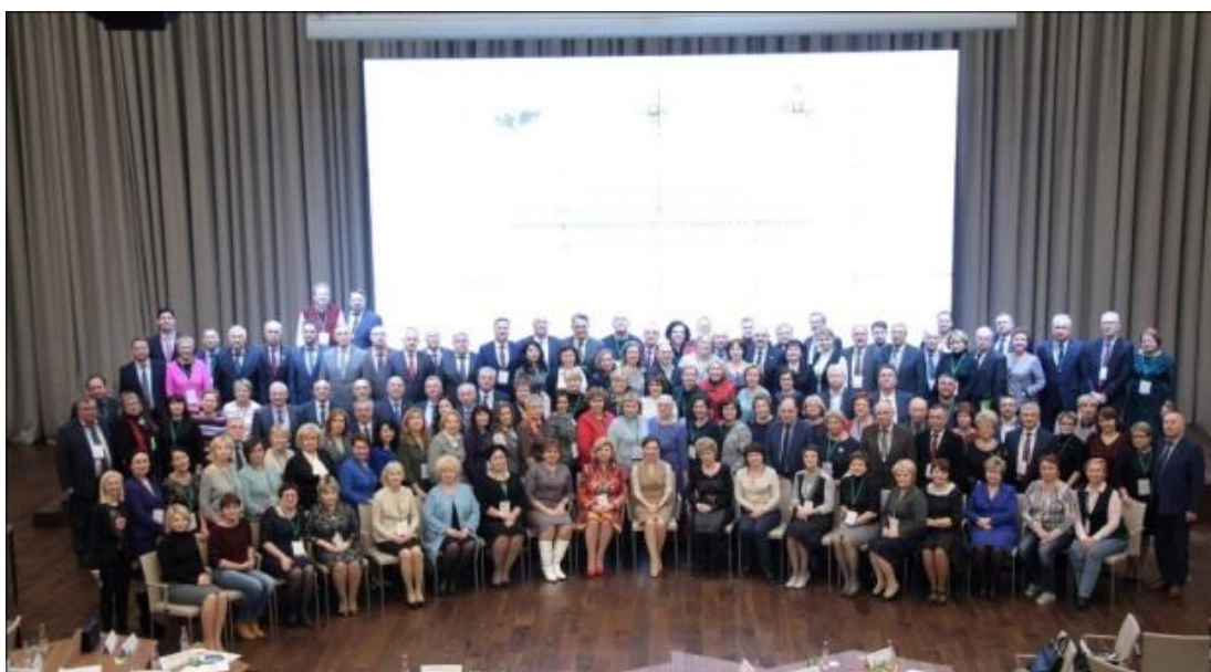
Заседание Координационного Совета Уполномоченных по правам человека в Российской Федерации