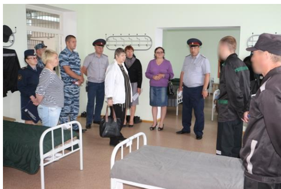
Проверка условий содержания осужденных граждан в Будуканской колонии № 10 правозащитниками ЕАО

На состоявшейся коллегии УФСИН по итогам работы в 2017 году для решения этой задачи определены меры для улучшения ситуации по защите трудовых прав граждан.