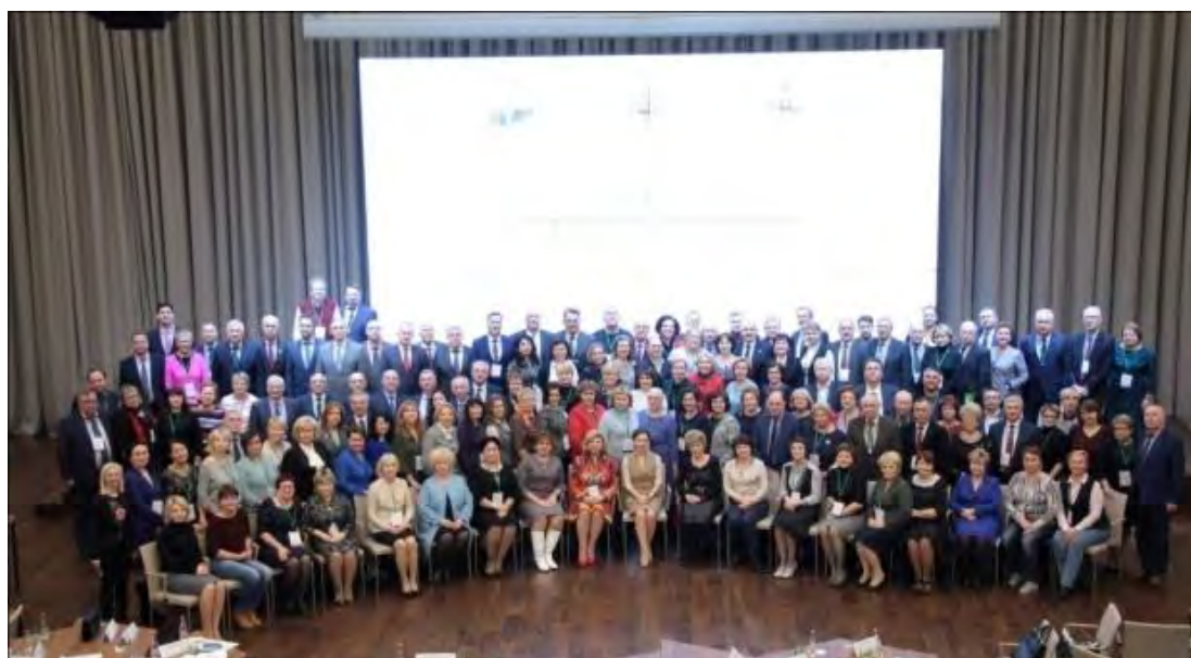
Заседание Координационного Совета Уполномоченных по правам человека в Российской Федерации