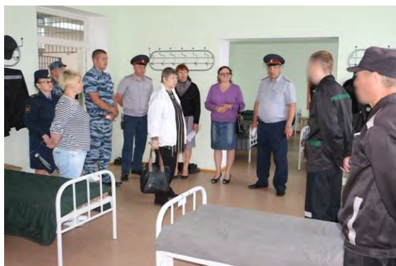
Проверка условий содержания осужденных граждан в Будуканской колонии № 10 правозащитниками ЕАО

На состоявшейся коллегии УФСИН по итогам работы в 2017 году для решения этой задачи определены меры для улучшения ситуации по защите трудовых прав граждан.