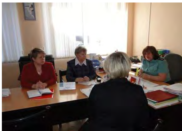
Совместный прием граждан в Управлении Федеральной службы судебных приставов по Хабаровскому краю и ЕАО

Как показывает практика работы Уполномоченного с обращениями граждан по вопросу исполнения судебных решений, проблем в этой сфере достаточно много. Они происходят от несовершенства законодательства до действий отдельного пристава – исполнителя. Этот вопрос неоднократно обсуждался на селекторных совещаниях, проводимых Федеральной службой судебных приставов с участием Уполномоченного по правам человека в РФ Т.Н. Москальковой. В практической работе регионального Уполномоченного максимально используются возможности взаимодействия с УФССП по Хабаровскому краю и ЕАО для рассмотрения обращений граждан и принятия решений в защиту их прав.