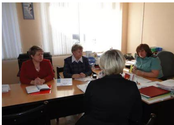
Совместный прием граждан в Управлении Федеральной службы судебных приставов по Хабаровскому краю и ЕАО