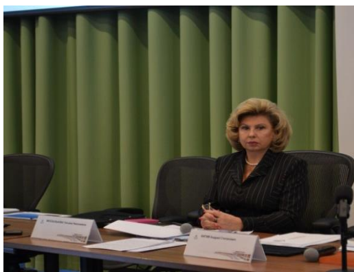
Уполномоченный по правам человека в Российской Федерации Т.Н.Москалькова во время парламентских слушаний по законопроекту о региональных уполномоченных по правам человека / Москва, декабрь 2016 г./

Проект федерального Закона «Об общих принципах организации и деятельности уполномоченных по правам человека в субъектах Российской Федерации» рассматривается как приложение к ежегодному Докладу Уполномоченного по правам человека в ЕАО. (приложение № 1)