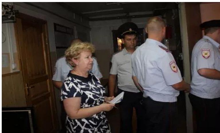
Проверка изоляторов временного содержания в Облученском и Смидовичском РОВД