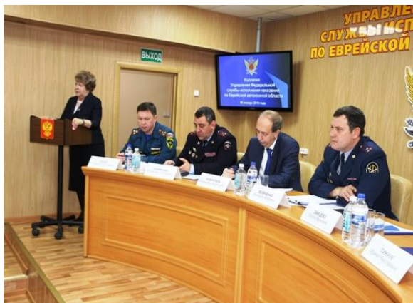
Заседание коллегии УФСИН России по ЕАО

В 2017 году наблюдалось увеличение количества обращений из мест лишения свободы. Как показал анализ обращений, в абсолютном большинстве они содержали просьбы подготовить юридическую консультацию, либо ответ на вопросы, связанные с социальной защитой. Обращений, связанных с фактами насилия, применения запрещенных средств, оружия, отсутствия питания, медикаментов не поступало. По мнению Уполномоченного, это результат осуществления постоянного контроля за условиями отбывания наказания со стороны руководителей УФСИН, контролирующих органов, Общественной наблюдательной комиссии, религиозных организаций.