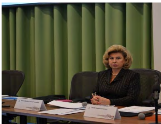
Уполномоченный по правам человека в Российской Федерации Т.Н.Москалькова во время парламентских слушаний по законопроекту о региональных уполномоченных по правам человека / Москва, декабрь 2016 г./

Проект федерального Закона «Об общих принципах организации и деятельности уполномоченных по правам человека в субъектах Российской Федерации» рассматривается как приложение к ежегодному Докладу Уполномоченного по правам человека в ЕАО. (приложение № 1)