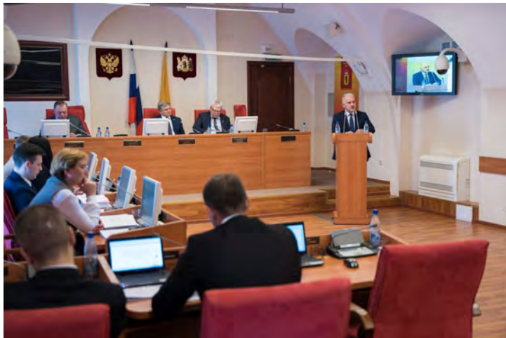
Обсуждение Ежегодного доклада Уполномоченного на заседании Ярославской областной Думы

Содействие Уполномоченным соблюдению и восстановлению прав и свобод человека и гражданина в Ярославской области осуществляется также посредством подготовки и направления предложений по совершенствованию механизма защиты прав и свобод.