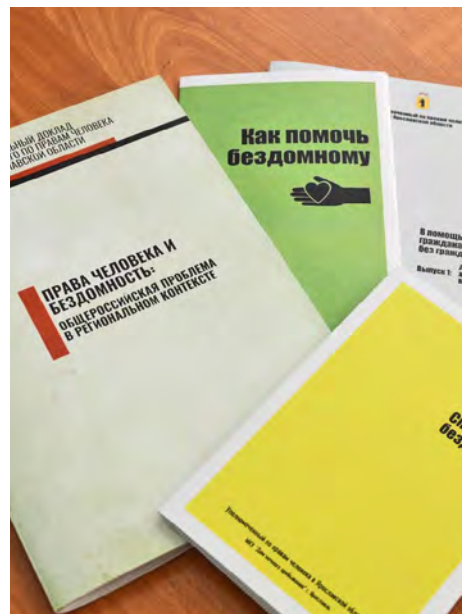
Правовое просвещение - важная сторона работы омбудсмана

Люди приходят ко мне с проблемами, порой неразрешимыми, с болью. Каждая ситуация требует полного включения, сопереживания. Как мы говорим, с радостями к нам не идут. Но это все компенсируется, когда удается отстоять позицию и восстановить права ярославцев. Люди всегда в таких случаях благодарны. Для многих из них уполномоченный был последней надеждой на решение вопроса.