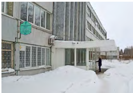
Заводские корпуса служили домом нескольким семьям