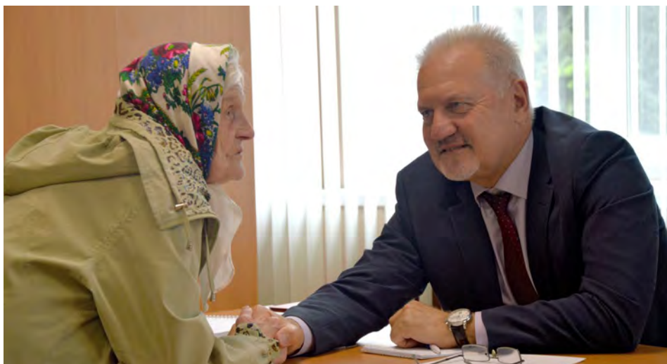
На личном приеме граждан

Омбудсмен поможет человеку объективно разобраться в его проблеме, он имеет право побудить властные инстанции уважать, обеспечивать и, в случае нарушения, восстановить права граждан. Он, таким образом, создает для гражданина дополнительную возможность защиты его прав. Все это можно делать через суд. Но обращение к Уполномоченному дает возможность решить эти вопросы во внесудебном порядке, без формальных процедур, оперативно и, конечно же, бесплатно.