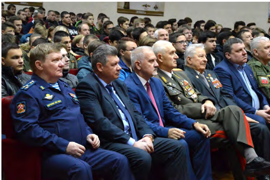
На Дне призывника

ного правозащитника - закономерный шаг. Институт омбудсмана (под разными названиями) существует более чем в сотне современных государств, в том числе в тех странах, которые имеют давние и глубокие традиции правового государства.