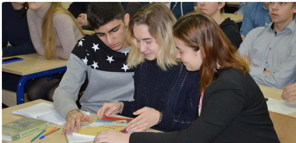
Единый урок прав человека для ярославских школьников

ИНТЕРНЕТ-САЙТ Уполномоченного www.up76.ru создан в 2017 году. На нем можно найти информацию в сфере соблюдения и защиты конституционных прав и свобод, получить онлайн правовую консультацию по вопросам защиты и восстановления прав и свобод.