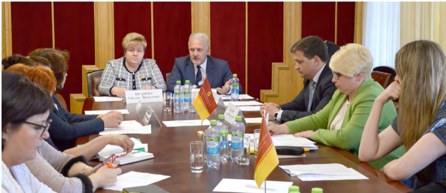
На заседании экспертной группы