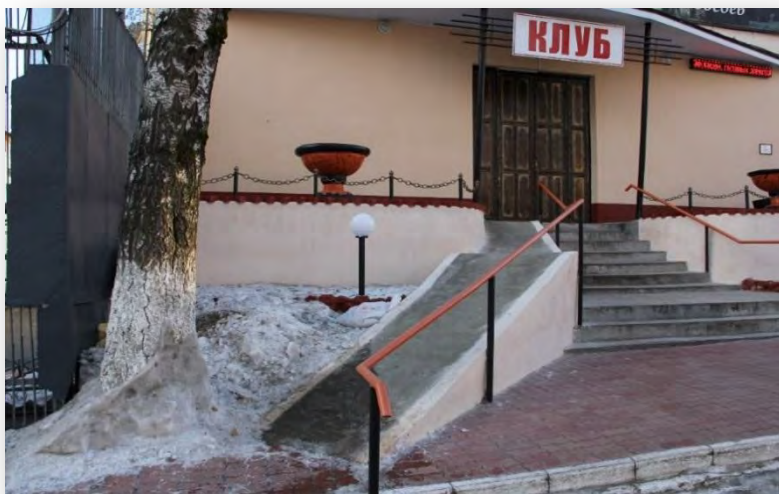
Фото № 1 Пандус не доступен для маломобильных осужденных (клуб исправительной колонии)

Если уклон пандуса больше 18 %, инвалиду-колясочнику потребуются посторонняя помощь для подъема. Пандусы, предназначенные для передвижения инвалидов в креслах-колясках, должны быть оснащены с обеих сторон одиночными или парными поручнями с учетом технических требований к опорным стационарным устройствам по ГОСТ Р 51261.