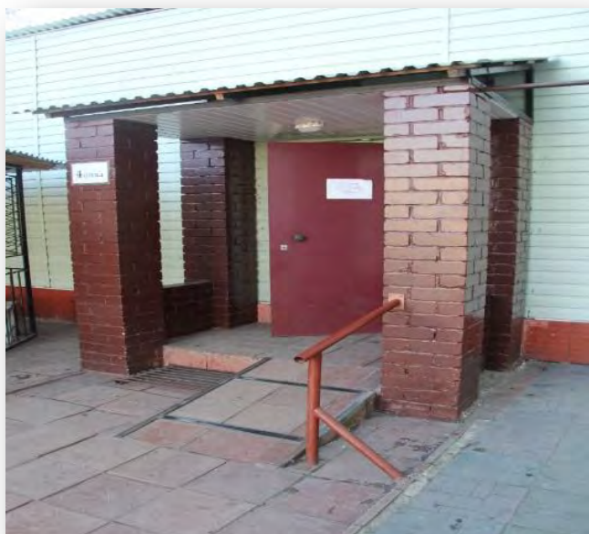
Фото № 2 Поручень располагается выше начала пандуса, а должен превышать длину пандуса с каждой стороны хотя бы на 30 см. (вход в отряд для инвалидов в исправительной колонии)