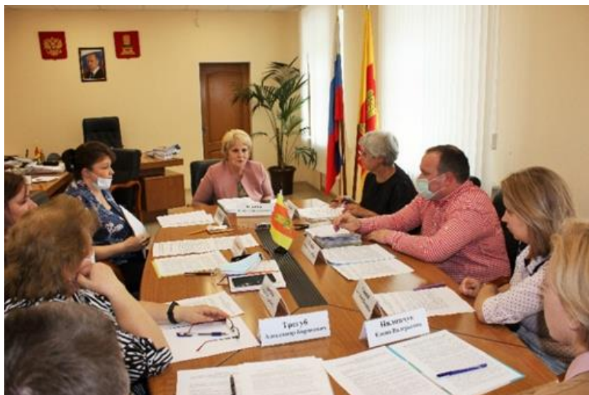
Заседание рабочей группы, май 2021 года

Совместно с кафедрой социологии и социальных технологий Тверского государственного технического университета при тесном взаимодействии с общественными организациями инвалидов, общественными помощниками Уполномоченного был проведен социологический опрос 158 лиц с ограниченными возможностями здоровья, проживающих в различных муниципальных образованиях Тверской области. Анкетирование проводилось среди представителей тех категорий граждан, для которых отсутствие доступной среды в МКД является фактором, существенно снижающим качество их жизни. Это, прежде всего, инвалиды с нарушениями функций опорно-двигательного аппарата (45%), ограничениями по зрению (34%), ограничениями по слуху (20%).