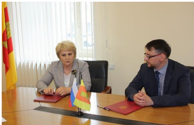
Подписание Соглашения о взаимодействии и сотрудничестве с и.о. ректора ТГМУ