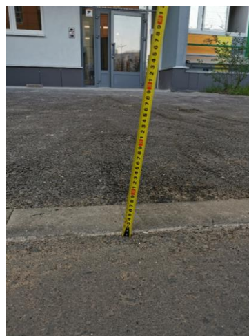
г. Тверь, ул. Оснабрюкская, дома №№ 14,16