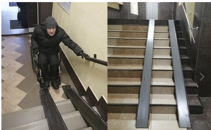
Недоступный путь к зоне лифтов. ЖК «Новый город» г. Тверь

Если СП59 (Свод правил 59.13330.2016 «Доступность зданий и сооружений для маломобильных групп населения») - это борьба с причинами, то постановление Правительства РФ №649 - это борьба с последствиями. Игнорирование СП59 приведёт к бесконечному циклу работы в рамках постановления Правительства РФ № 649, а исправление всегда дорогой и менее эффективный способ решения проблем с доступностью.