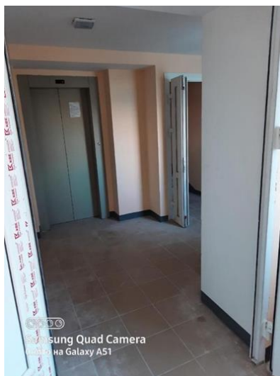
г. Тверь, пер.1 Вагонников, д.2

По информации общественных организаций инвалидов, далеко не все вновь построенные и введенные в эксплуатацию МКД отвечают указанным требованиям. Комиссиями, выезжающими на приемку МКД в эксплуатацию, качество объектов безбарьерной среды не проверяется. В связи с чем Уполномоченный полагает, что в состав комиссий, выезжающих на приемку МКД в эксплуатацию, необходимо в