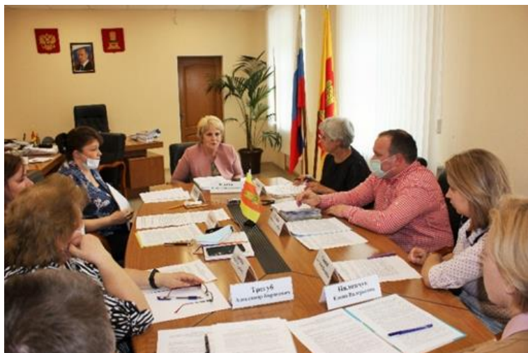
Заседание рабочей группы, 14.05.2021