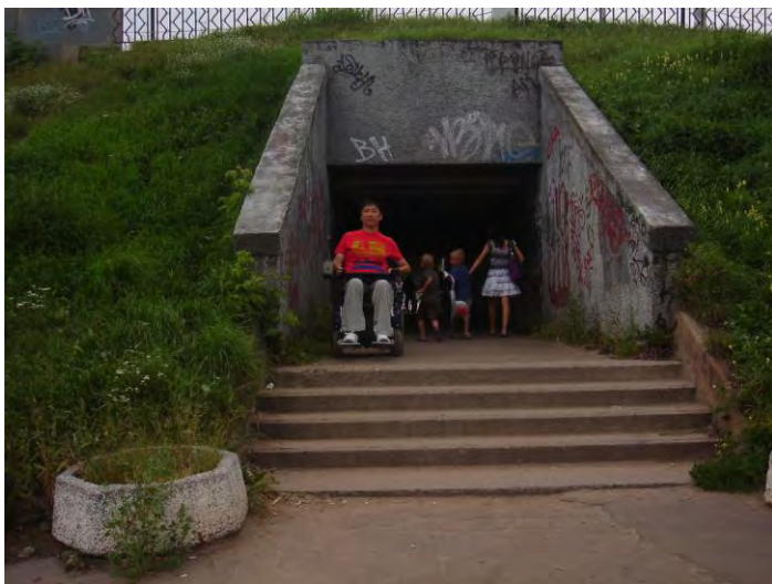
Переход под старым волжским мостом с пляжной зоны на набережную г. Тверь (отсутствует пандус)

Участники обсуждения пришли к выводу о том, что, несмотря на реализацию в регионе государственной программы «Доступная среда», социальная инфраструктура для инвалидов остается ограниченно доступной даже в областной столице, в муниципальных же образованиях региона данная программа практически не реализована.