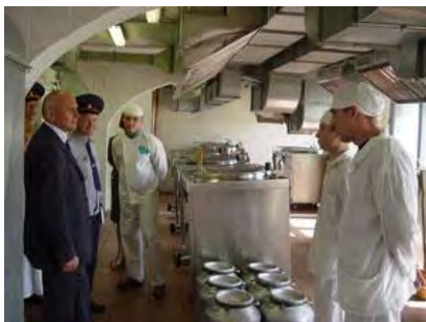
Посещение Уполномоченным СИЗО- 1 УФСИН России по Тверской области

В рамках Соглашения Уполномоченным проводилась работа по контролю за соблюдением прав и законных интересов подозреваемых, обвиняемых, осужденных.