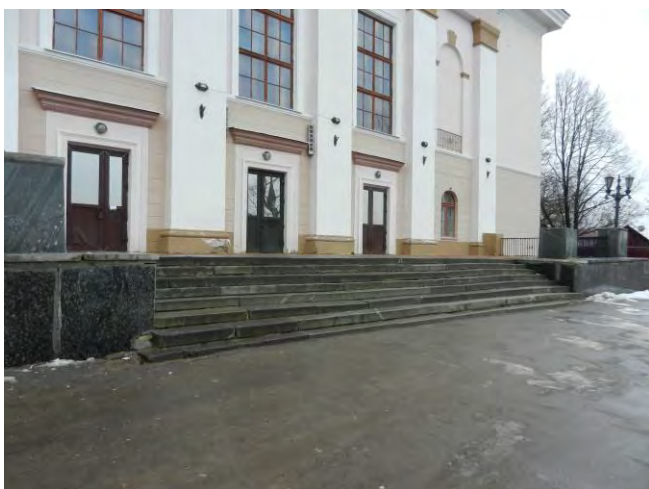
Дворец культуры г. Ржев (отсутствует пандус)

Проблемы, названные руководителем общественной организации инвалидов г. Ржев «МИР», послужили поводом для поездки Уполномоченного 7 ноября 2013 года в г. Ржев. В ходе поездки был проведен личный прием граждан; с целью изучения ситуации по обеспечению доступной среды жизнедеятельности для инвалидов Уполномоченный посетил ЦРБ, комплексный центр социального обслуживания населения, городской Дом культуры, Клуб железнодорожников, школу № 12, где находится центр дистанционного обучения детей. Все посещенные объекты, за исключением реабилитационного центра, не адаптированы для людей с ограниченными возможностями здоровья.