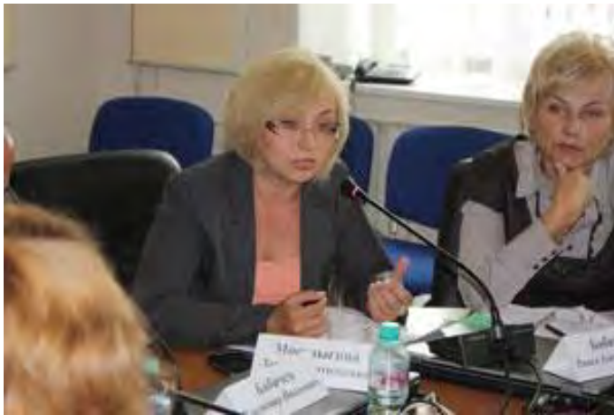
Общее собрание помощников Уполномоченного по правам человека в Тверской области, работающих на общественных началах, по вопросу организации отдыха детей и подростков Тверской области в летний период 2013 года

Самыми многочисленными в почте Уполномоченного являются обращения, касающиеся нарушений социальных прав граждан: защиты материнства, семьи и детства, прав на охрану здоровья и медицинскую помощь, на благоприятную окружающую среду, социальное обеспечение, жилищных прав. В 2013 году доля этих обращений в общем количестве составила 56%. В 28% случаев нарушаются гражданские (личные) права граждан. Самые распространенные темы таких жалоб: несогласие с приговором, судебным решением, нарушения в ходе предварительного расследования. Количество обращений об имеющихся нарушениях экономических прав составило 7%, культурных прав – 4%, иных - 2%, не содержат указаний на факты нарушений прав - 3% обращений.