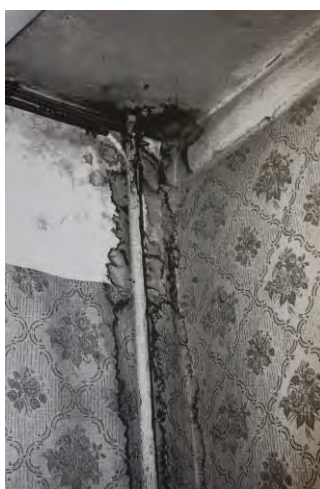
Квартира заявительницы П. в доме № 41 по ул. Советской г. Тверь