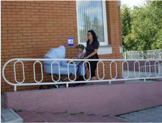
Специальный вход в детскую поликлинику в г. Луховицы

Чтобы не нарушать права потребителей в подобных ситуациях, магазин обязан обеспечить покупателю возможность сделать покупку, например, попросить у инвалида список необходимых продуктов и принести их к месту платежа или назначить сотрудника, который будет отвечать за сохранность коляски, пока мама делает покупки в магазине.