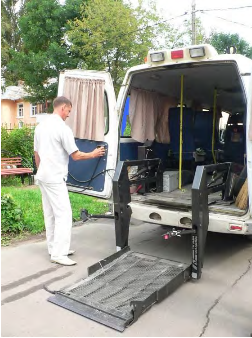
Социальное такси, оборудованное специальным подъемным устройством

В городском округе Подольск транспортные услуги пожилым людям и инвалидам, в том числе инвалидам-колясочникам, предоставляет Подольский городской центр социального обслуживания граждан пожилого возраста и инвалидов, на балансе которого состоят три автомашины: две - марки «Газель» и одна - УАЗ. Автотранспорт используется для доставки горячего питания малообеспеченным гражданам, транспортировки жителей в учреждения здравоохранения и социальной защиты, а