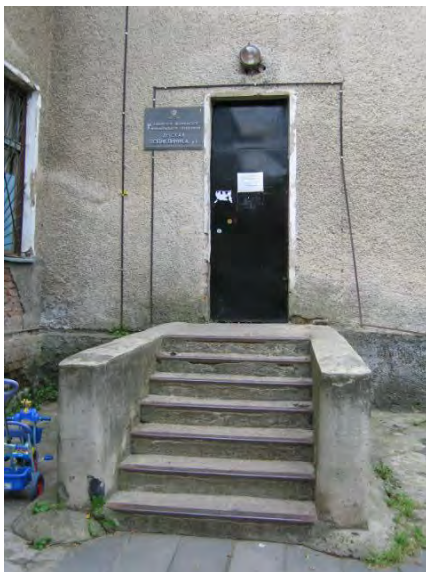
Вход в детскую поликлинику в г. Кашира

установлена компенсационная выплата взамен выдачи транспортных средств инвалидам, вставшим на учёт в органах социальной защиты населения Подмосковья до 1 января 2005 года.