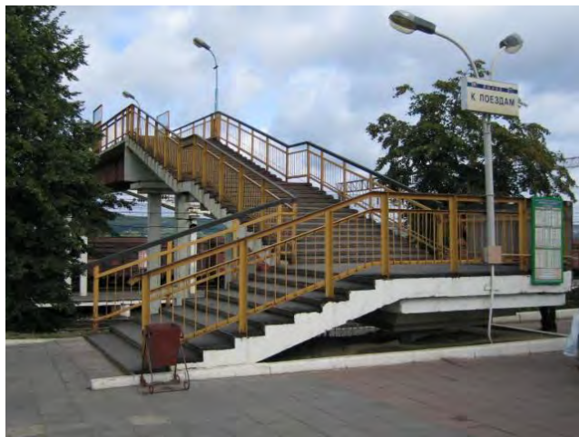
Железнодорожный мост в г. Кашира

Например, недавно построенные в г. Кашира железнодорожный вокзал и мост через платформы не оснащены специальными приспособлениями и оборудованием для обеспечения беспрепятственного доступа инвалидов. И люди вынуждены пересекать железнодорожное полотно с риском для жизни. Или