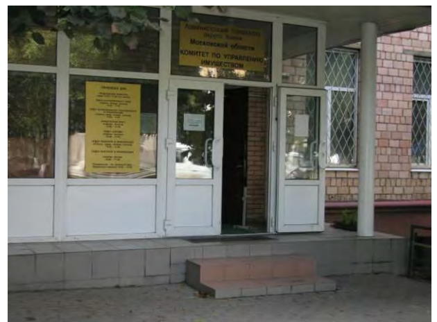
Вход в Комитет по управлению имуществом в г. Химки

Недоступность для маломобильных групп населения