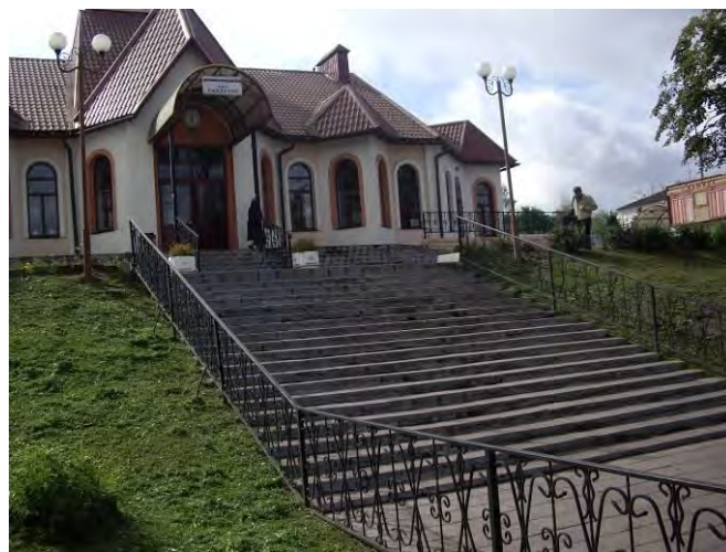
Железнодорожный вокзал в г. Кашира не оснащен специальными приспособлениями для обеспечения беспрепятственного доступа маломобильных групп населения

Начальнику Московской железной дороги филиала ОАО «РЖД» было рекомендовано провести реконструкцию данного вокзала и принять меры по оснащению его специальными приспособлениями и оборудованием. Однако эта инициатива осталась без внимания руководства данного ведомства.