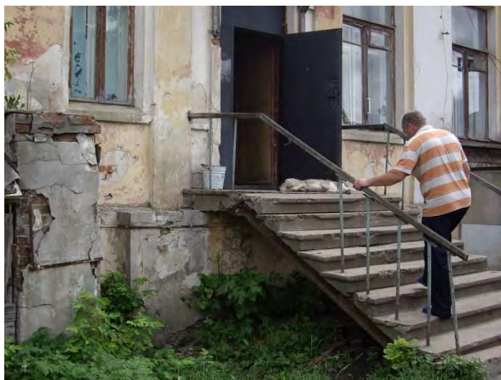
Вход в хирургическое отделение в больнице г. Кашира

Сегодня достаточно широко обсуждается проблема безбарьерной среды для инвалидов. Объективно существуют условия, лишаящие их возможности свободного передвижения и реализации своих прав наравне с другими людьми. Эти ограничения выражены в