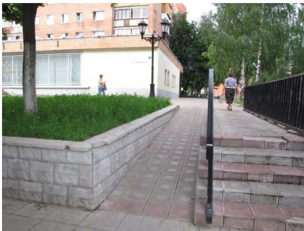
Пандус у торгово - офисного центра в г. Долгопрудный

специальными приспособлениями и оборудованием для обеспечения беспрепятственного доступа инвалидов, и определён перечень этих специальных приспособлений и оборудования.