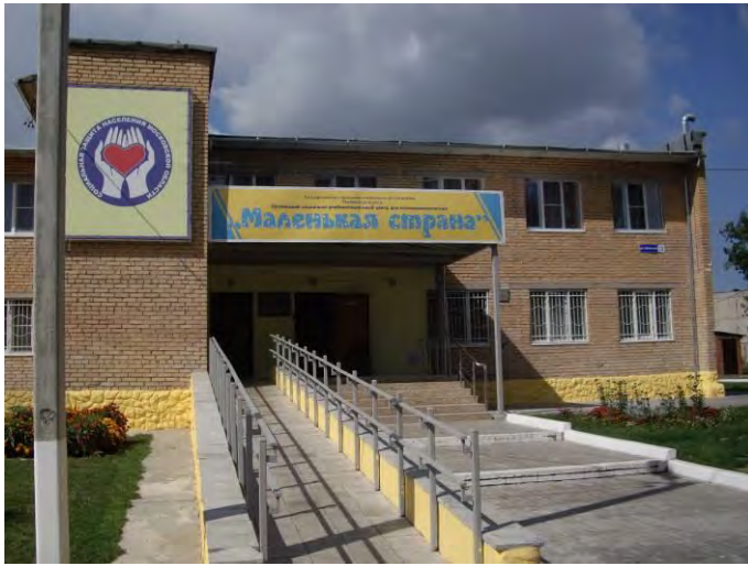
Социально-реабилитационный центр для несовершеннолетних в д. Матыра Луховицкого района

Королёв и Домодедово, а также в Зарайском, Дмитровском, Одинцовском, Раменском и Ступинском муниципальных районах.