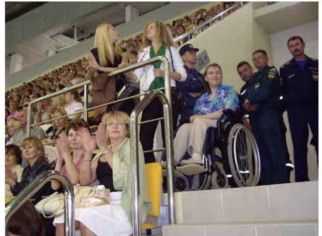
На городском празднике в ледовом дворце г. Коломна

В городском округе Коломна в социально-значимых объектах (почта, аптеки, БТИ, магазины и др.), которые наиболее часто посещают инвалиды, сделаны пандусы и поручни. Пандусами оборудованы 68 трамвайных и 155 автобусных остановок. Жилье 46 инвалидов адаптировано к