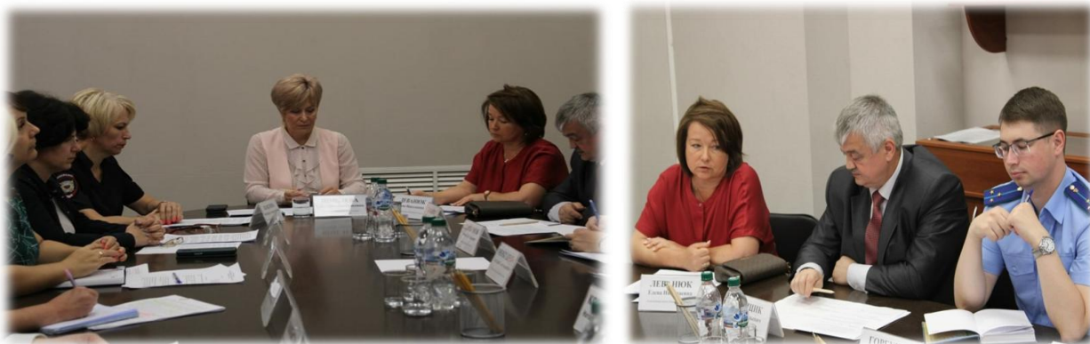
Заседание Экспертного совета

20 июля текущего года состоялось заседание Экспертного совета при региональном омбудсмене на тему: «Об обеспечении прав эвакуированных граждан из Луганской народной республики, Донецкой народной республики и Украины на территорию Ивановской области», где были приняты решения о необходимости внесения соответствующих изменений в региональные и нормативно-правовые акты, высказаны рекомендации по внесению дополнений в федеральное законодательство.