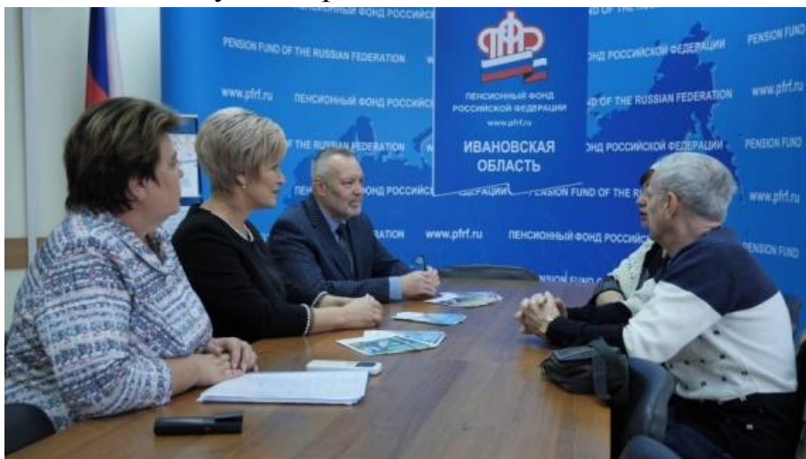
Совместный прием граждан в Отделении Пенсионного фонда РФ

С целью оказания помощи эвакуированным гражданам Отделом по обеспечению деятельности Уполномоченного организован консультативный прием. Проблемные вопросы обсуждаются с представителями Отделения, по результатам даются соответствующие рекомендации.