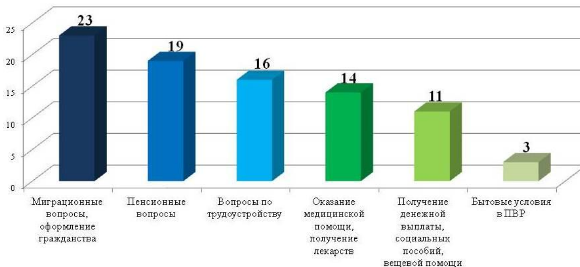
Рис. 3. Тематика обращений, поступивших в ходе посещения ПВР