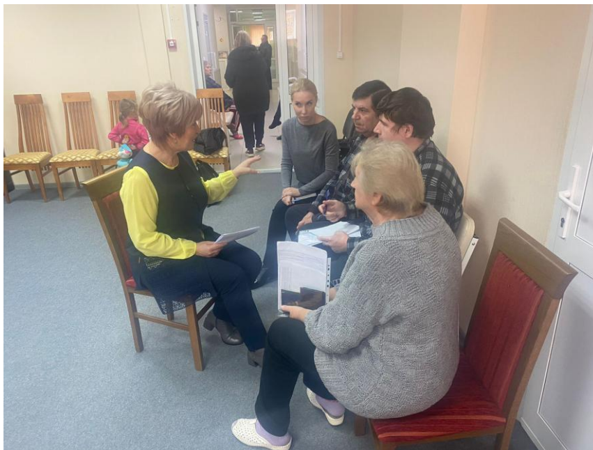
Работа «консультативного пункта» в ПВП (Дом-интернат «Лесное»)

Следует отметить, что в Ивановской области органами власти проводится системная работа с эвакуированными гражданами. У прибывших централизованно в Пункты временного пребывания (ПВП) определен социальный пакет - люди обеспечены бесплатно проживанием, питанием, медицинской помощью. Дети имеют возможность посещать детские сады и школы, студенты зачислены в вузы, согласно выбранным специальностям.