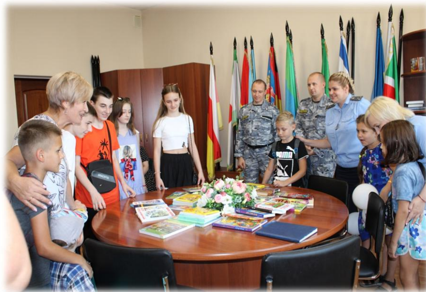
Социальная акция «Поможем собрать детей в школу»

На социально – правовых площадках «свой почерк» в работу по обеспечению гарантий соблюдения прав граждан внесли: