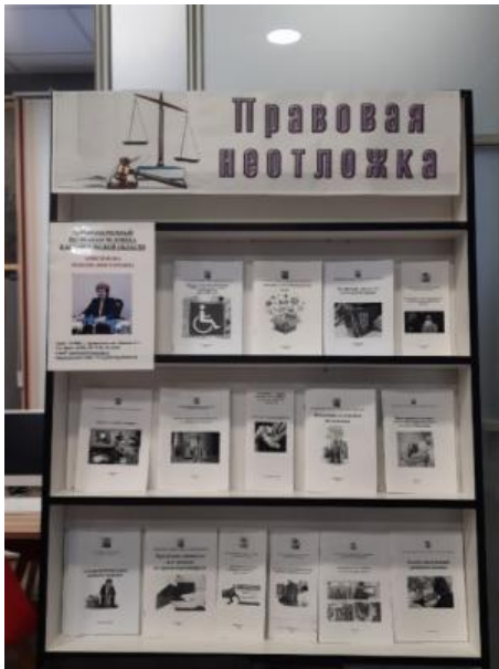
Информационно-консультационные материалы Уполномоченного в МБУК «Ленская межпоселенческая библиотека» , с. Яренск, 2021 г.

Выстраивая свою работу по правовому просвещению граждан в 2021 г. в условиях действия ограничительных мер в связи с распространением новой коронавирусной инфекции, Уполномоченный уделял особое внимание дистанционным формам правового консультирования граждан, разработке и распространению тематических информационно-методических и презентационных материалов, организации правовых стендов в библиотеках, культурных, образовательных и социальных учреждениях и др.