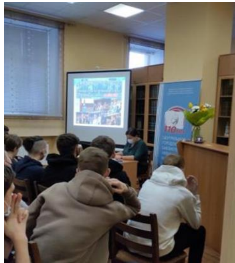
Встреча со студентами в рамках Единого урока прав человека, ноябрь 2021 г.

В преддверии Дня прав человека Уполномоченный и сотрудники аппарата встретились с детьми, находящимися в Архангельском центре помощи детям-сиротам и детям, оставшимся без попечения родителей, детям с ограниченными возможностями здоровья «Лучик», которому Уполномоченный оказывает всестороннюю поддержку на протяжении ряда лет. Уполномоченный и сотрудники аппарата приняли участие в организованных в учреждении в рамках профилактической работы, правовых мер и мер педагогической помощи и поддержки воспитанников центра мероприятиях, посвященных Дню прав человека и Дню Конституции РФ.