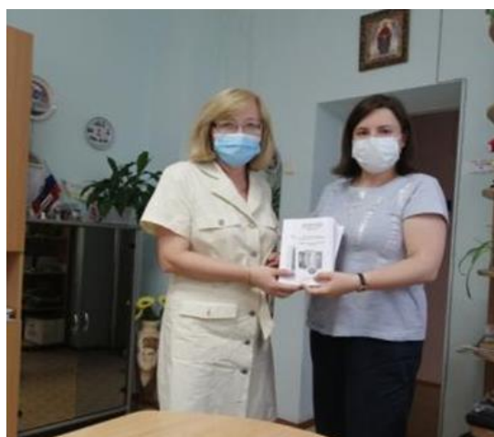
Посещение КЦСО г. Новодвинска, 22.06.2021

– При участии АРОО «Мост» - единственной общественной организацией в Архангельской области, предлагающей широкий спектр реабилитационных мероприятий для взрослых людей с ментальными особенностями состоялось посещение ГБУ СОН АО «Новодвинский комплексный центр социального обслуживания». В ходе посещения с руководством и сотрудниками учреждения были