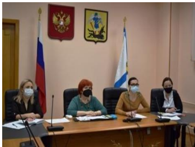
Семинар для помощников Уполномоченного, декабрь 2021 г.

В 2021 г. помощниками Уполномоченного осуществлялись также различные формы работы, направленные на повышение доступности правовой помощи и содействие правовому просвещению граждан. Помощники Уполномоченного традиционно принимали активное участие в просветительских мероприятиях и проектах, организованных Уполномоченным, в работе заседаний, рабочих совещаний, межведомственных комиссий, проводимых органами местного самоуправления поселений и районов, а также встречах, тематических семинарах, прямых телефонных линиях в сфере соблюдения прав и законных интересов граждан.