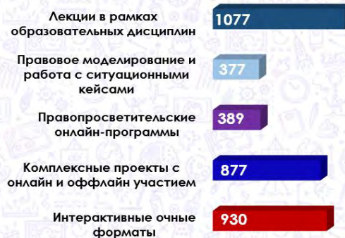
Рисунок 5 Эффективность форматов правового просвещения