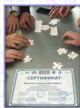
Рисунок 4 Деятельность Корпуса правовых волонтеров

Модель правового просвещения распространена более чем в 30% субъектов Российской Федерации, её форматы доработаны с учетом мнения участников и экспертов. Адаптирована электронная просветительская инфраструктура (lk.hrdschool.ru и ресурсы-спутники) для участия неограниченной аудитории. Сформирован межрегиональный молодежный кластер для дальнейшего развития правопросветительской среды.