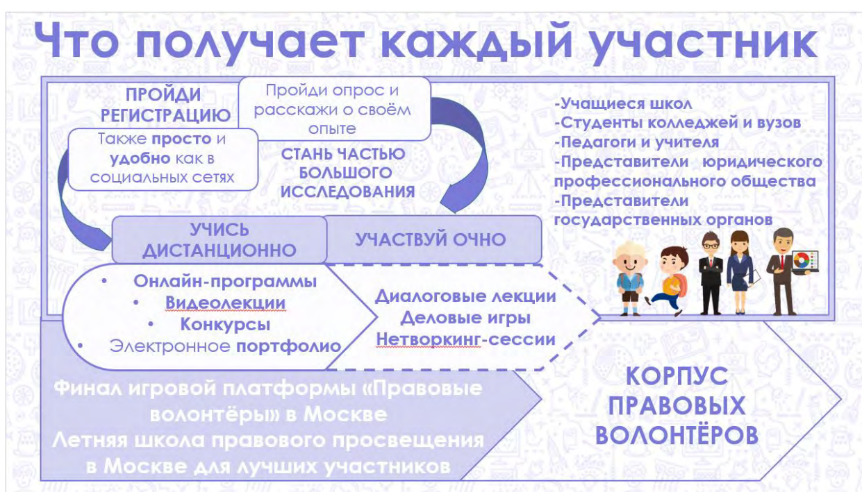
Рисунок 2 Возможности участников

приобрести навыки для правового просвещения российского общества.