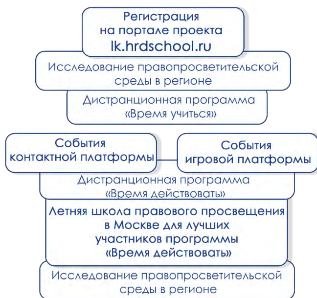
Рисунок 1 Структура и технологии проекта

Для команд учащихся старших классов школ (7-11 классы) разработаны уровни игровой платформы «Правовые волонтеры», а для студентов колледжей, вузов, участников волонтерских организаций и иных участников экспертами проекта создана деловая игра «Мой правозащитный навигатор», которая в сочетании с диалоговой лекцией «Я знаю право» позволяет участникам не только узнать о деятельности того или иного правозащитного органа, но и «примерить» на себя роль правозащитника, так как перед участниками ставится задача — защитить и восстановить нарушенное право главного героя задачи (кейсового задания). Ключевое место в контенте лекции и структуре игры занимает компетенция Уполномоченного по правам человека в Российской Федерации, а на региональном уровне она может быть дополнена компетенцией регионального или при необходимости - отраслевого уполномоченного, например – по защите прав коренных и малочисленных народов.