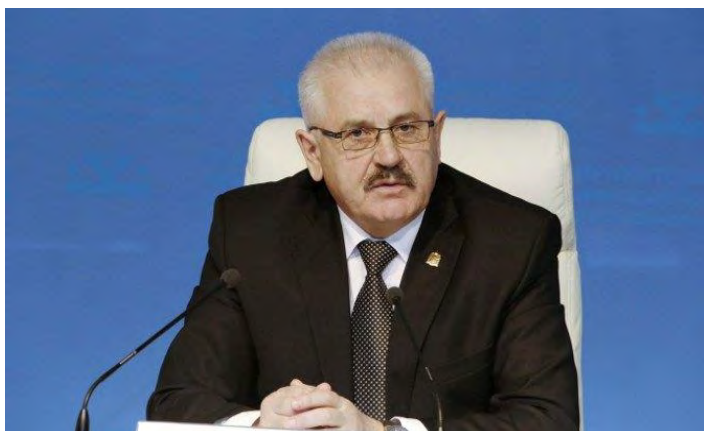
Сак Анатолий Иванович, Уполномоченный по правам человека в Ямало-Ненецком автономном округе

Совершенствование правового государства, формирование гражданского общества и укрепление национального согласия в России требуют наличия высокого уровня правовой культуры.